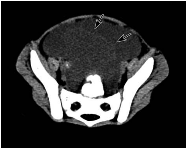
Slika 3. Kompjutorizirana tomografija zdjelice prikazuje obilan, septiran, inhomogen, slobodni intraperitonejski tekući sadržaj (strelice)

Figure 3. Computed tomography of the abdomen showing huge, septated, inhomogenous intraperitoneal fluid (arrows)