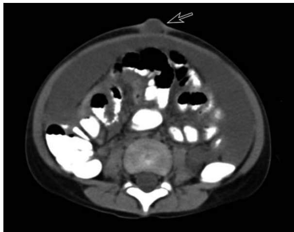
Slika 2. Kompjutorizirana tomografija abdomena prikazuje zadebljani omentum s umjereno gustim tekućim sadržajem koji se nalazi i u umbilikalnoj herniji (strelica)

U daljnjoj dijagnostičkoj obradi učinjena je punkcija intraperitonejskog sadržaja, a citološka i biokemijska anali-