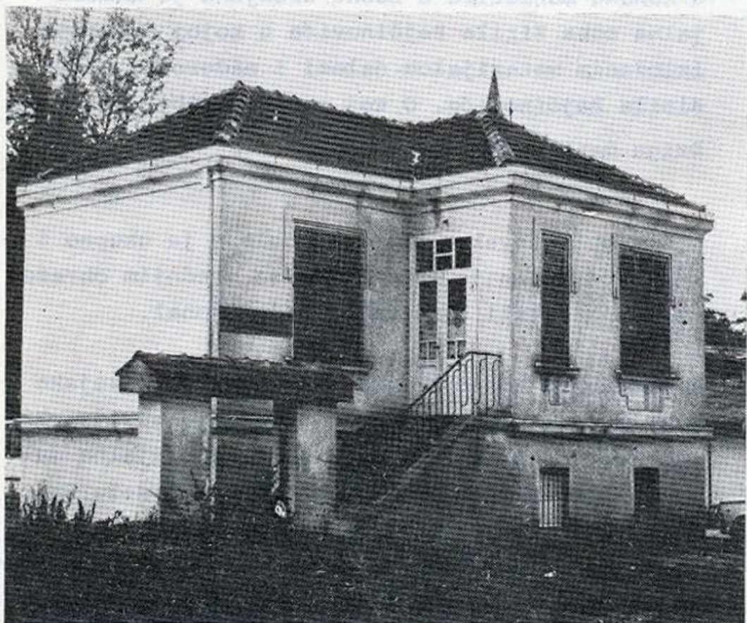
Skopje - Memorijalni muzej Pokrajinskog komiteta KPJ za Makedoniju