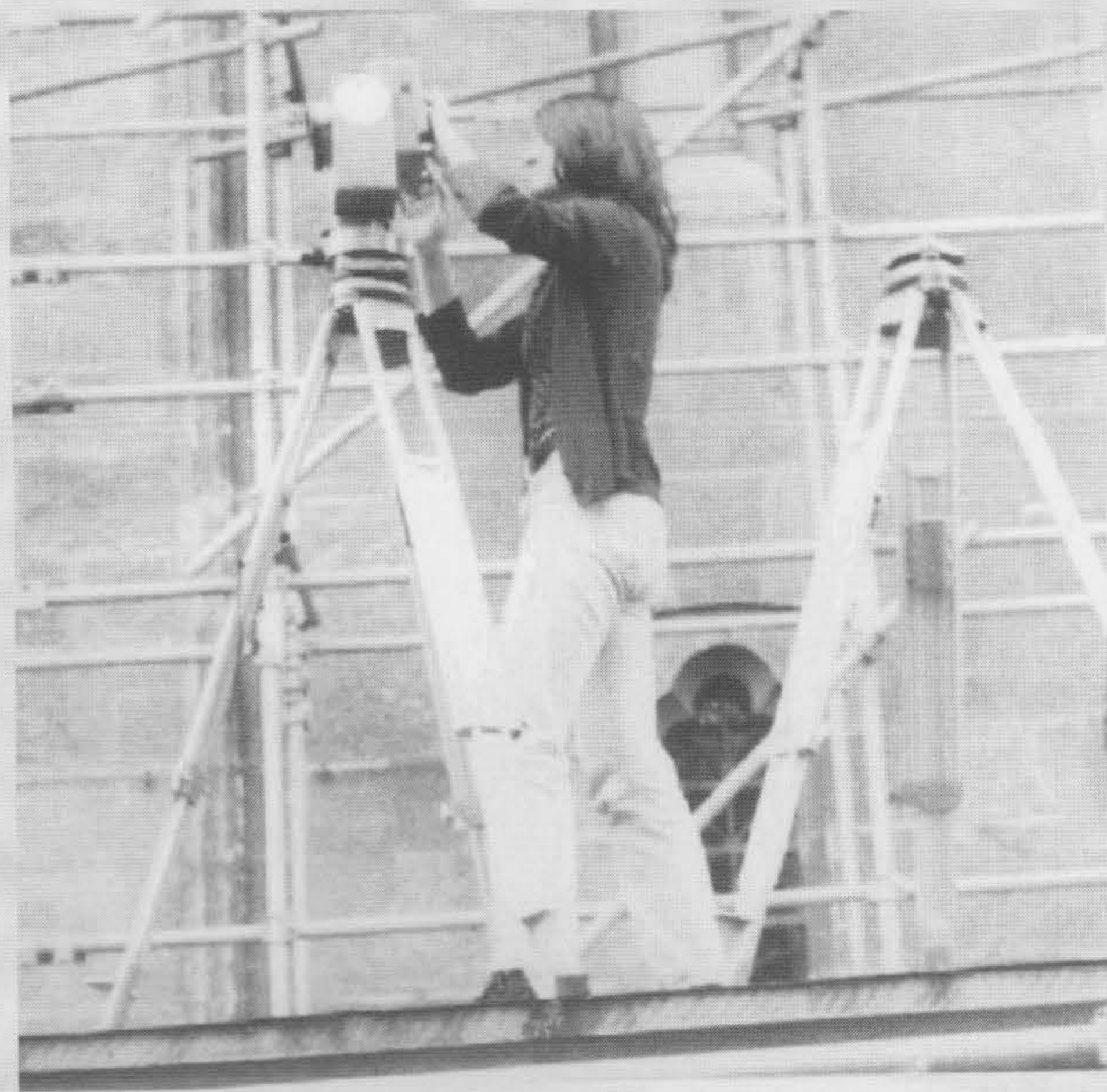
Rad na terenu, na skeli konstruiranoj oko same katedrale

Danas kada je restauracija naše prvostolnice u tijeku, mogu sa zadovoljstvom reći da sve potrebne elemente koji su restauratorima potrebni, počevši od definiranja područja koncesije za eksploataciju arhitektonsko-građevinskog kamena u Bizeku pa do jasne slike trenutnog stanja samoga objekta, je dao Zavod za fotogrametriju. Moram spomenuti da već 60 godina djelatnici tog Zavoda daju svoj doprinos kako bi se sačuvali podaci o mnogim vrijednim povijesnim građevinama, objektima naše kulturne baštine, koji su jedini način da se oštećeni pa i srušeni objekti rekonstruiraju i dovedu u prvobitan oblik.