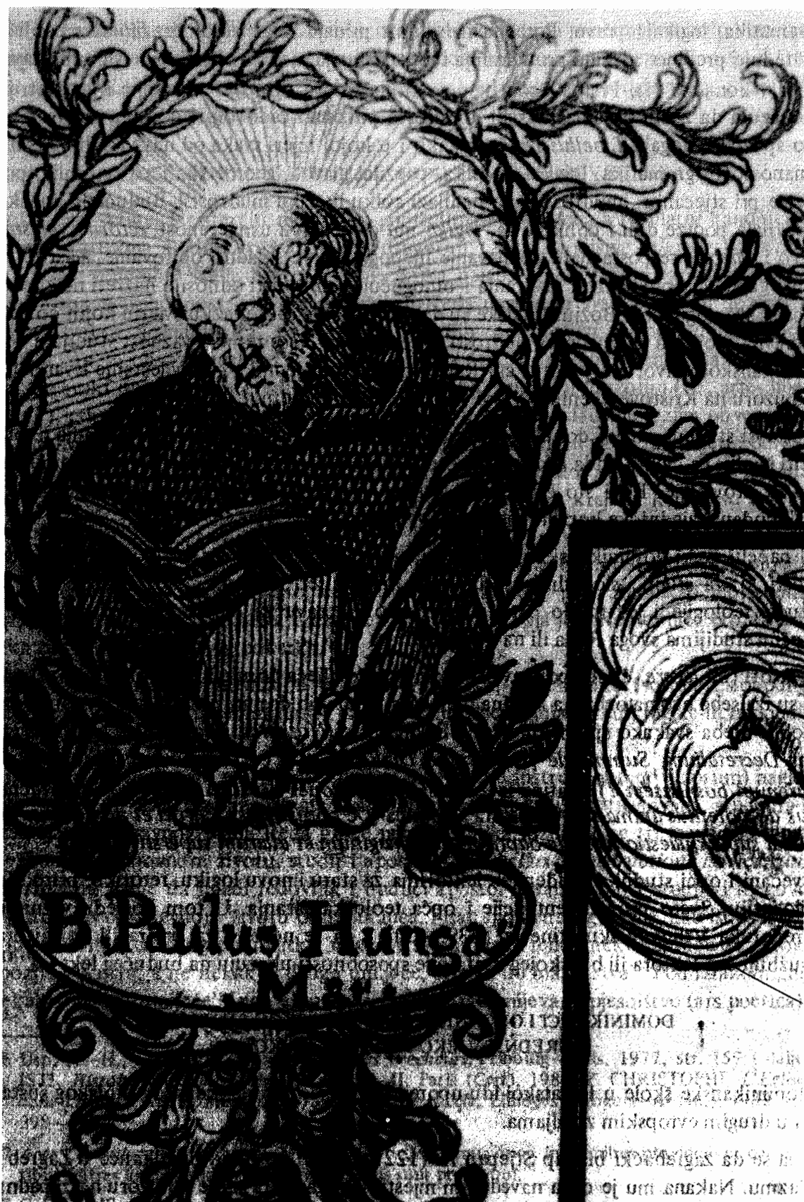
Pavao Dalmatinac, suradnik sv. Dominika i utemeljitelj prvih dominikanskih samostana u našim krajevima (drvorez prema izd. S. Ferrarius, De rebus Hungaricae provinciae Ordinis praedicatorum, Viennae, 1637)