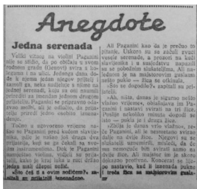
Slika 7. Rubrika Anekdote u „Hrvatskom listu“, izdanje od 13. prosinca 1936.

Početak 1941. godine naslovnice počinju odražavati tmurniju atmosferu. Svakodnevno se objavljuju vijesti o ratnim događajima i odlukama vođa. No rat nije prouzročio mijenjanje rubrika, ratni se događaji svode u postojeće (Prvi je svjetski rat u ranije analiziranim novinama stekao vlastitu rubriku, pa se ovdje može govoriti o neovisnosti rubrika čak i o iznimno turbulentnim i trajnim događajima). Zabavne rubrike opstaju, a dodaju se i nove: mala rubrika Prije 25 godina donosi vijesti iz drugih novina otprije 25 godina; Radio daje frekvencije za domaće i inozemne stanice; rubrika Za zabavu i razonodu prilog je s križaljka, vicevima i sl., nova je zabavna rubrika i Ulična prislušivanja Petera Franje . Niz je povremenih regionalnih rubrika: Novosti iz Vinkovaca , Novosti iz Vukovara , Novosti iz Slavonskog Broda , Vijesti iz bosanske Hrvatske i sl. Roman u nastavcima izlazi neometano. Nedjeljom se pojavljuju dodatni sadržaji iste naravi, npr. Iz riznice uma (poslovice i mudrosti), Za naše majke i djecu (savjeti o dječjim bolestima, higijeni itd.). Dječji Hrvatski list sada izlazi pod nazivom Hrvatski list za mladež .