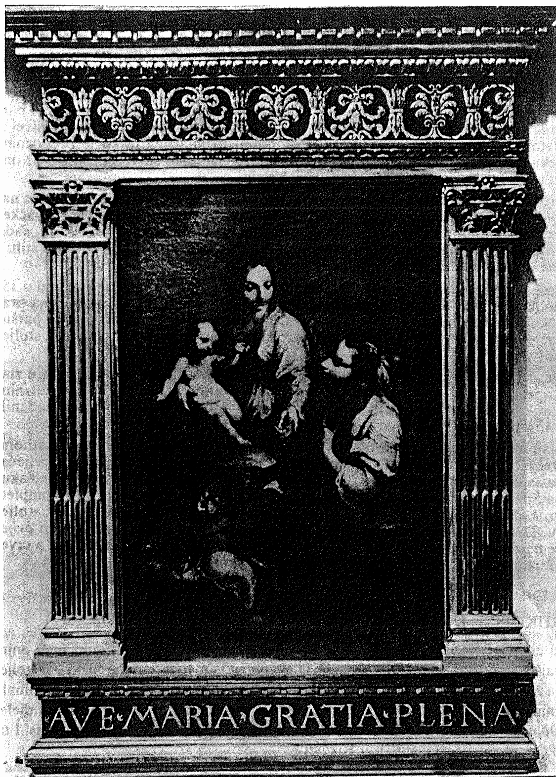
Zaruke sv. Katarine. — Nepoznati majstor s kraja 17. st.