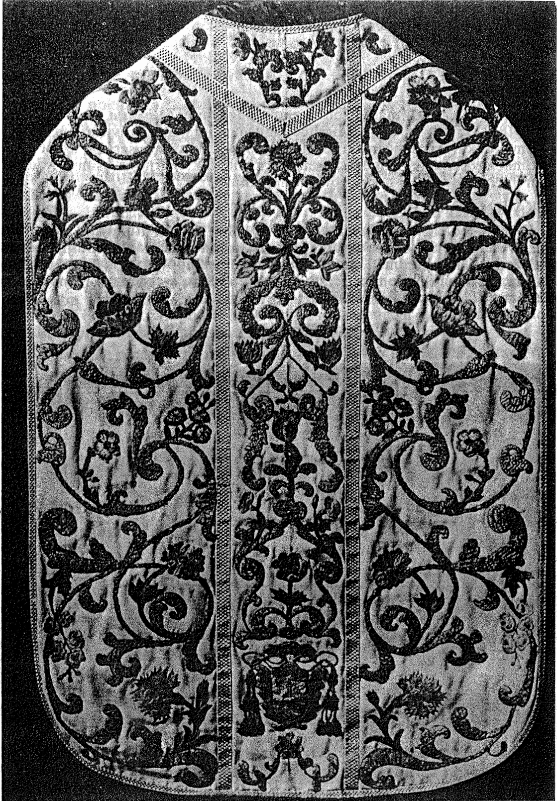
Misnica biskupa Španiáa. — 17 st.