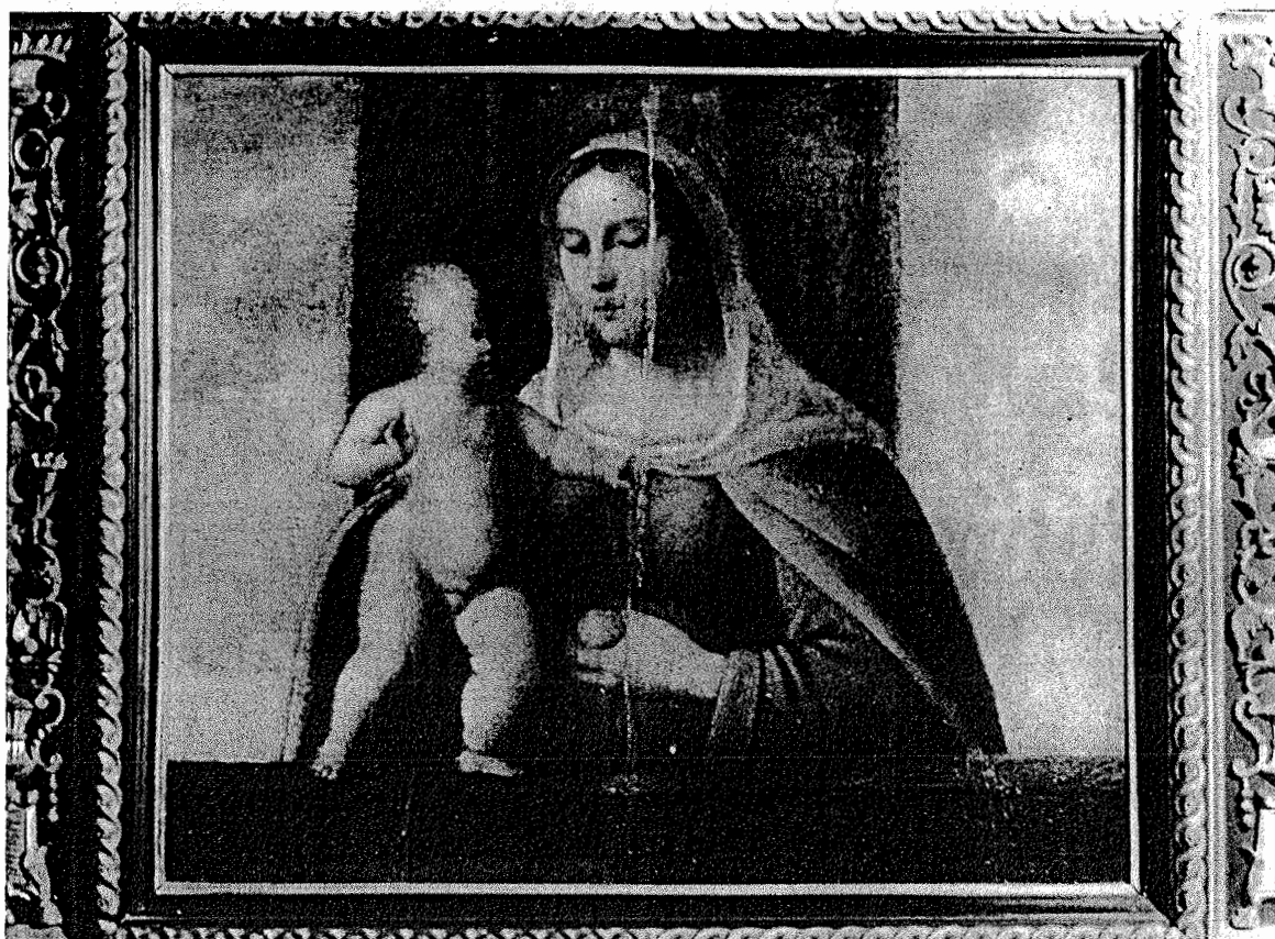
Bogorodica s Djetetom. — Kraj 15. st. (Girolamo da Santa Croce?)

Neophodan dio crkvenog inventara bilo je ruho, gornja liturgijska odjeća biskupa, svećenika i đakona, a za obrede služe još i nebnice, antependiji, pokrivači kaleža i sl. Ti su predmeti izrađivani od raznih skupocjenih tkanina: brokata, damasta, baršuna i svile te su često vezeni zlatnom, srebrnom i raznobojnom svilenom niti.