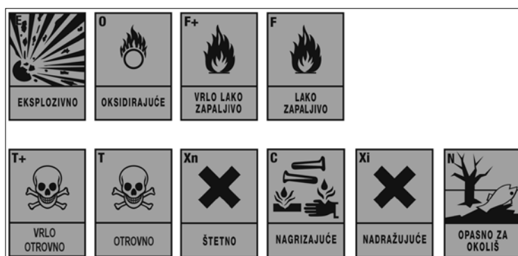
Slika 2. Simboli i oznake opasnosti prema Pravilniku o razvrstavanju, označavanju, obilježavanju i pakiranju opasnih kemikalija (N.N., br. 64/11.)

Umjesto oznaka upozorenja (R) uvode se nove oznake upozorenja H (prema engl. Hazard statement) za pojedine kategorije opasnosti: fizikalno-kemijske opasnosti, opasnosti za zdravlje i opa-