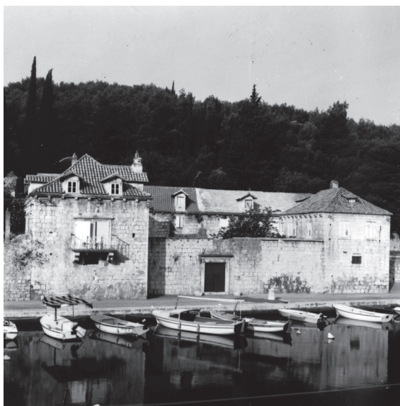
Slika 2. Kaštel Gligo u luci Bobovišća

Jezgru - okosnicu cijelog sklopa - činila je kuća koja pripada najstarijem dijelu Kaštela, s nizom obrambenih elemenata u svojoj unutrašnjosti i baroknim luminarom u potkrovlju. Na nju je dodana velika kuća s bunarom, nedovršena kuća s terasom, a na istočnoj strani izgrađena je rezidencijalna kuća. U donjem isturenom zapadnom dijelu rezidencijalne kuće prema vratima, nalazi se otvor za top. Otvor za top se nalazio i uz istočna vrata. Sve ove kuće opasane su obrambenim zidom s puškarnicama uz glavna barokna vrata. Uza zid je dijelom sačuvana kamena