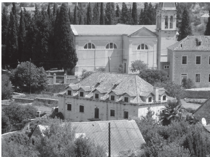
Slika 3. Kuća obitelji Gligo u selu Bobovišća

Kuća Gligo, svojom linijom i obradom stilskih elemenata pročelja i unutrašnjeg prostora, uz naglašenu otvorenost prema okolnom prostoru te svojom veličinom i oblikom, jedan je od najljepših primjera arhitekture toga vremena. (slika 3)