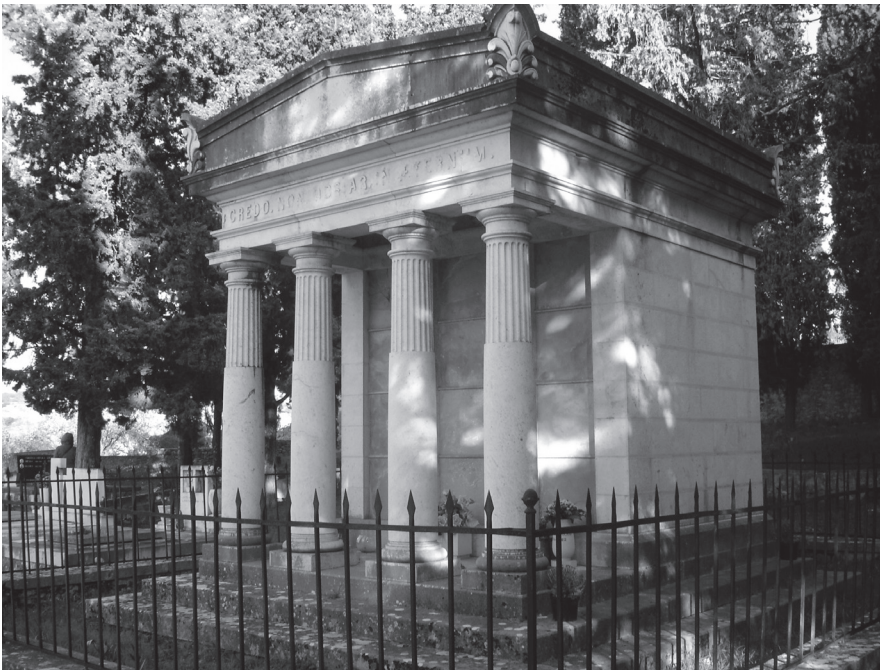
Slika 5a. Mauzolej obitelji Gligo u Bobovišćima