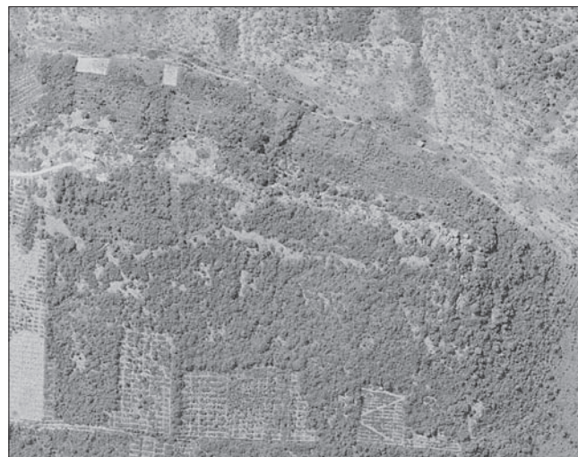
Sl. 2. Gradina Kremik. Detalj zračnog snimka gradine (Državna geodetska uprava RH, cikličko snimanje, zadatak Lika-Zadar-Šibenik-Split, film 19/01, snimak 2085)

Čitava površina unutar bedema kao i padine izvan, a posebice grudobran, puni su ulomaka keramičkih posuda, kako onih što pripadaju pretpovijesnom razdoblju, tako i ulomaka karak-