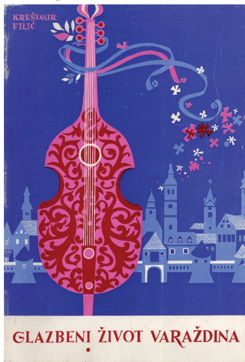
Slika 6. Glazbeni život Varaždina

skom glazbenika koji su autoru slali svoje životopise, a često i fotografijama. 109 O ovom radu prikaz je napisala Dolores Ivanuša, 110 dok je u novije vrijeme analizu objavljenih izvora u Filićevom djelu, koji se bavi prvom polovicom 19. stoljeća, predstavila u svom radu Ljerka Perči, 111 istaknuvši nedostupnost nekih izvora predstavljenih u Filićevoj knjizi. Od tiskovina, prikaz ove knjige objavljen je u Vjesniku, 112 u kojem autor ističe da su ovdje činjenice izvučene iz zaborava i uredno i pažljivo sistematizirane, dok su u Telegramu 113 objavljena dva rada od kojih treba naglasiti rad Lovre Županovića.