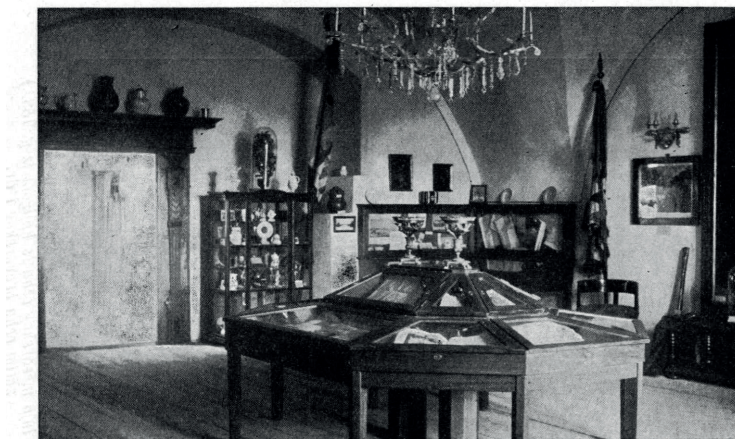
2. Pogled u renesansnu sobu s vitrinom, staklenim svjetionikom i renesansnim dovratnikom u pozadini

Iako su kritike varaždinskog muzeja od strane muzejskih stručnjaka bile prisutne u javnosti još prije njegova otvaranja, 24 Filić obrazlaže da će to biti skroman muzej, bez velikih pretenzija biti će prezentirani predmeti lokalnog značenja koji govore o kulturnom i društvenom životu Varaždina i njegove okolice. Prvi stalni postav otvoren je tek u nekoliko prostorija drugog kata nekadašnje varaždinske feudalne utvrde 16. studenoga 1925. kao dio proslave 1000. godišnjice hrvatskog kraljevstva. Sam Filić, autor je iscrpnog prikaza tog novootvorenog postava 25 sa šesnaest fotografija dok su sa samog otvorenja izvještavale različite novine 26 s puno pohvala.