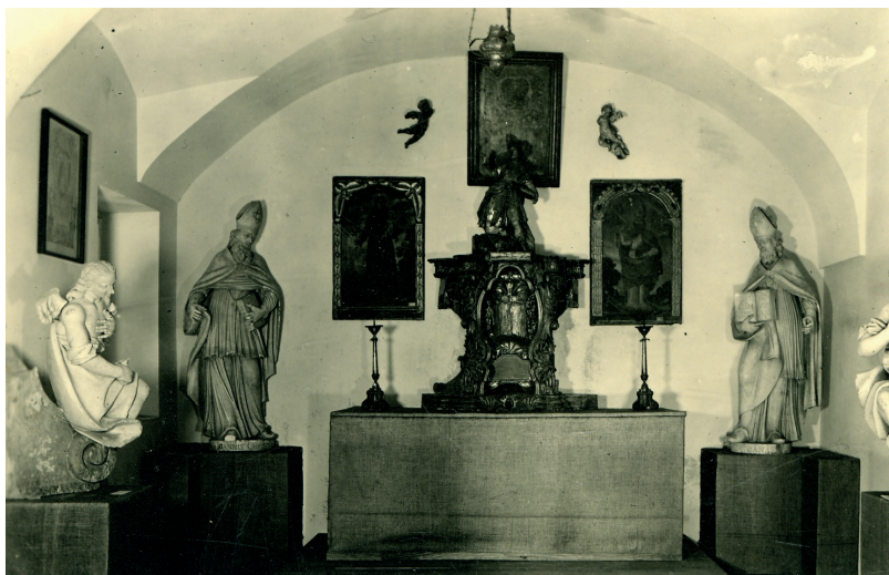
Slika 4. Stalni postav Muzeja grada Zagreba, 1946.