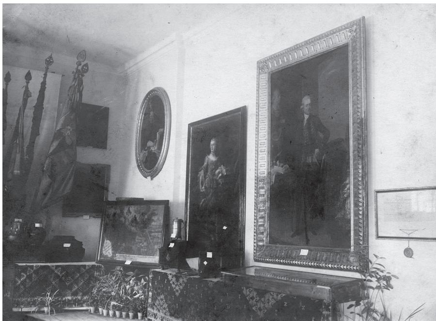
Slika 4. Kulturno-historijska izložba grada Varaždina

pozornost i prostor, prateći njezino pripremanje, tijek i postignute rezultate, a mnoge hrvatske i slovenske novine dale su joj pozitivne ocjene i kritike. 37