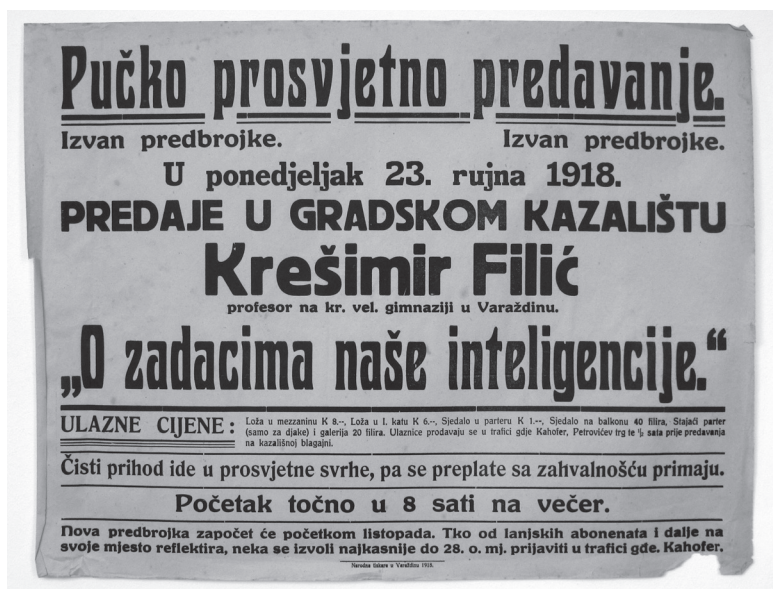
Slika 1. Plakat za predavanje „Zadaci naše inteligencije“

okolnim selima, 6 pri čemu je obrađeno 70-ak različitih tema. Odaziv slušateljstva prelazio je brojku od prosječno dvije stotine slušatelja po predavanju u gradu, te između stotinu pedeset i četiristo na selu. U njima su uglavnom obrađivane teme vezane uz povijest, politički sustav, uz razvoj kulture i društva te loše stanje gospodarstva i pogoršane higijenske prilike u uvjetima rata. Predavači su bili pripadnici različitih struka, što je ovisilo o tematici i sadržaju predavanja. Kako bi se priređivačima olakšalo organizaciju i bitno smanjilo ukupne troškove, uz predavače iz Zagreba, često su bili angažirani domaći. Stoga među predavačima nerijetko nailazimo na profesore varaždinske Gimnazije poput: Milana Kamana, Mateja Potočnjaka, Franje Koščeca, Adolfa Wisserta, Stjepana Kropeka i Vladimira Deduša. Po povratku u Varaždin u ove se aktivnosti, uz svoje kolege, uključio i mladi Krešimir Filić, ponesen idejom kontinuiranog sitnog rada među narodom, nastojeći je što revnije provesti u djelo. Profesor Filić je u okviru te aktivnosti u Varaždinu održao predavanje Zrinski i Frankopani , 7 a predavanje O povijesti i seobi Južnih Slavena je osim u Biškupcu, ponovio u Maruševcu, Varaždinskim Toplicama i Ivancu. Predavanje pod naslovom Zadaci naše inteligencije je, osim u Varaždinu, održao još u Krapini, Koprivnici, Ivancu i Varaždinskim Toplicama, dok