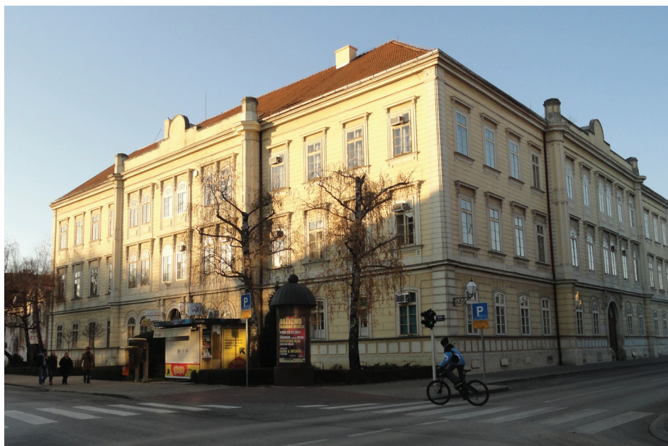
Slika 2. Zgrada Gimnazije

čela je samostalno djelovati. Tijekom zimskih i proljetnih mjeseci 1920. godine, oni su u razdoblju od 25. siječnja do 10. travnja, priredili ukupno osam javnih predavanja, 12 što je bio svojevrsni začetak pučkog sveučilišta koje su oni sami obično nazivali Ekstenza , 13 No, ta je aktivnost započeta prije nego su vlasti novooblikovane Kraljevine SHS uspjele propisima regulirati ovu djelatnost. Okružnica kojom je Povjerenstvo za prosvjetu i vjeru zemaljske vlade definiralo uređivanje srednjoškolskih ekstenzija, bila je objavljena 19. svibnja 1920. godine, dakle nekoliko mjeseci nakon početka spomenutih aktivnosti u Varaždinu. Na osnovu toga je krajem listopada iste godine bio održan sastanak profesorskog zbora varaždinske Gimnazije na kojem je oformljen Odbor Varaždinske gimnazijske ekstenze . Time je i službeno bila oblikovana nova ustanova tipa ekstenzije, čijim radom je upravljala i rukovođila varaždinska Gimnazija. Bila je organizirana po uzoru na zagrebačko pučko sveučilište koje je također djelovalo kao ekstenzija Sveučilišta u Zagrebu. Varaždinska gimnazijska ekstenza bila je jedna od prvih takvih ustanova organiziranih u pokrajini i po uzoru na nju su kasnije bile organizirane srednjoškolske ekstenzije kao začeci pučkih sveučilišta u drugim gradskim sredinama.