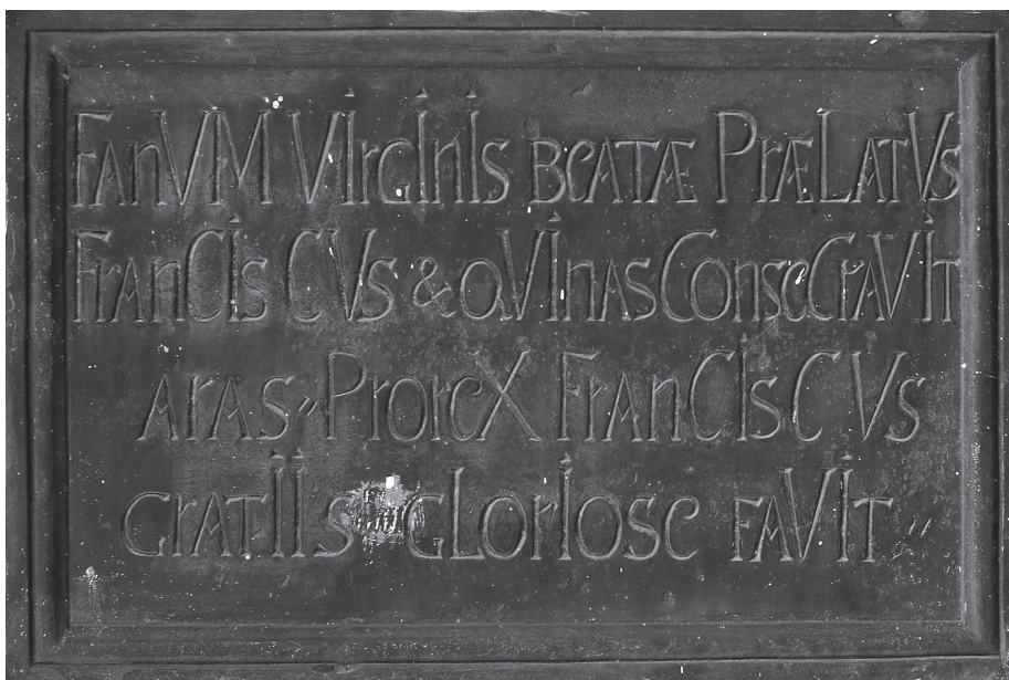
Slika 3. Prvi natpis uzidan kod ulaza u zvonik