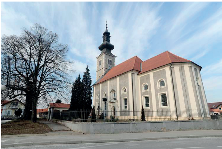
Slika 1. Župna crkva Uznesenja Blažene Djevice Marije u Biškopcu