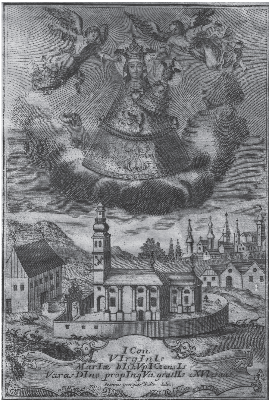
Slika 2. Grafika iz 1747. godine