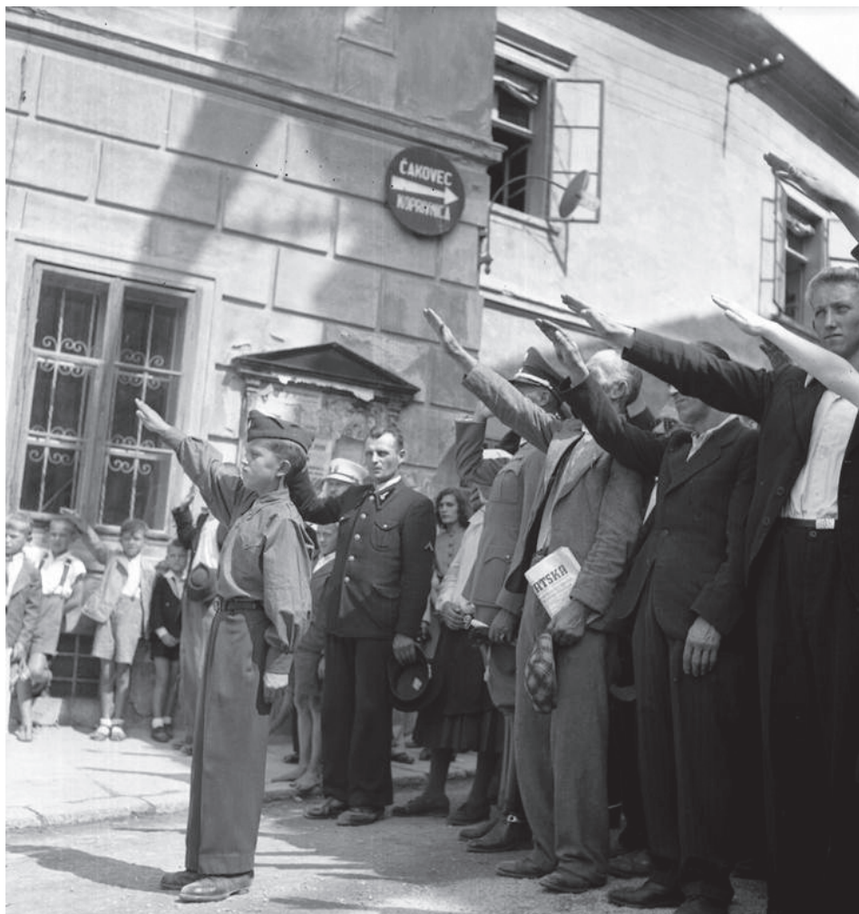
Slika 19. Član Ustaške mladeži na glavnom gradskom trgu u ljeto 1941. godine 131