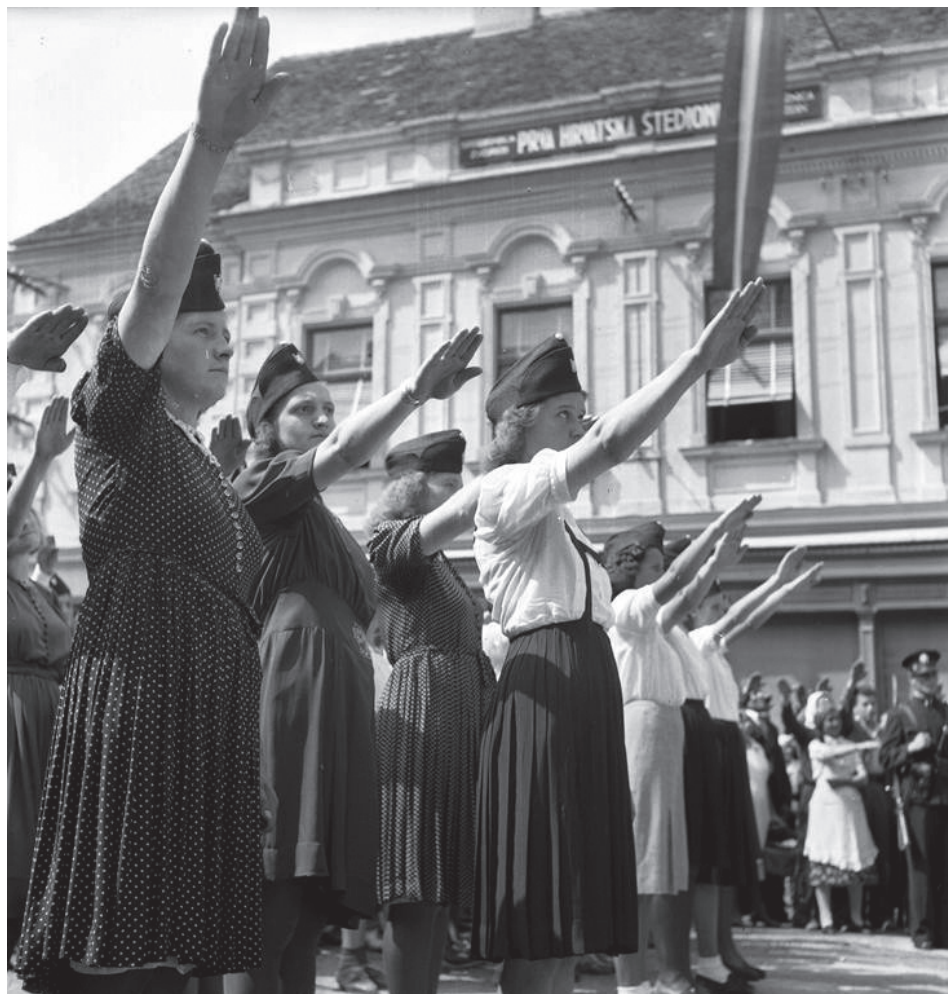
Slika 20. Članice Ustaške mladeži na glavnom gradskom trgu u ljeto 1941. godine 132