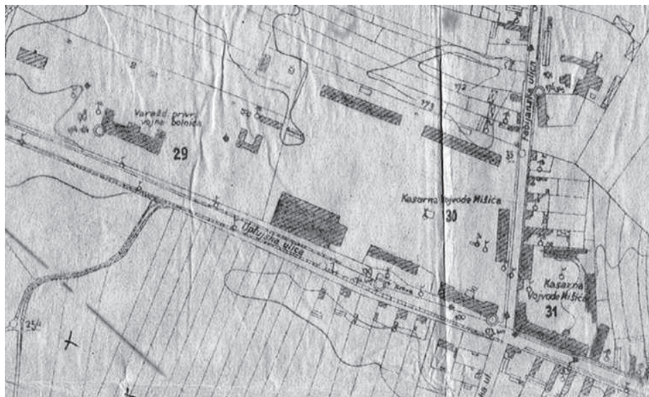
Slika 3. Kasarna Vojvode Mišića i Varaždinske privremene vojne bolnice 115