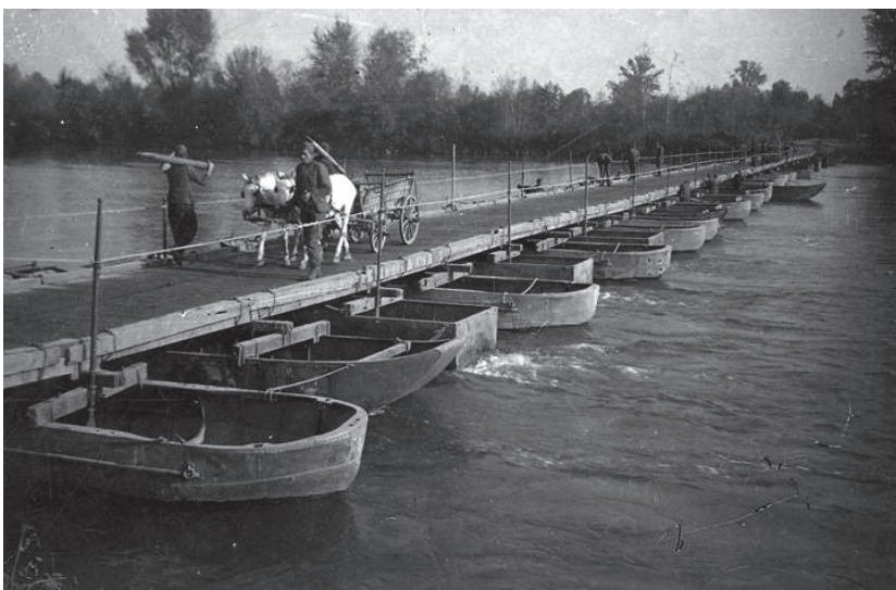
Slika 7. Pontonski most na Dravi 119