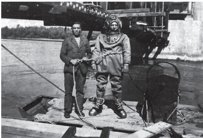
Slika 8. Ronilac pri obnovi mosta na Dravi 120