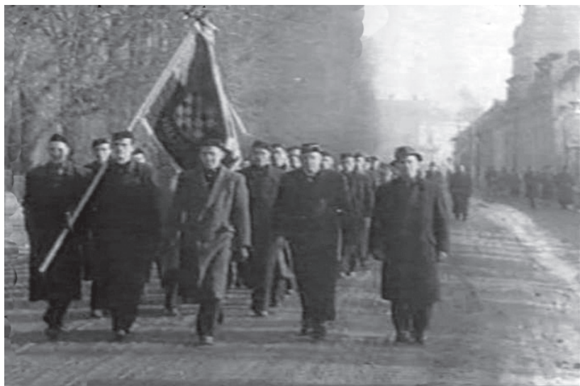
Slika 10. Mimohod današnjom Cesarčevom ulicom 122