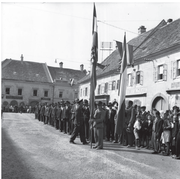
Slika 17. Javi skup na glavnom varaždinskom trgu u ljeto 1941. godine 129