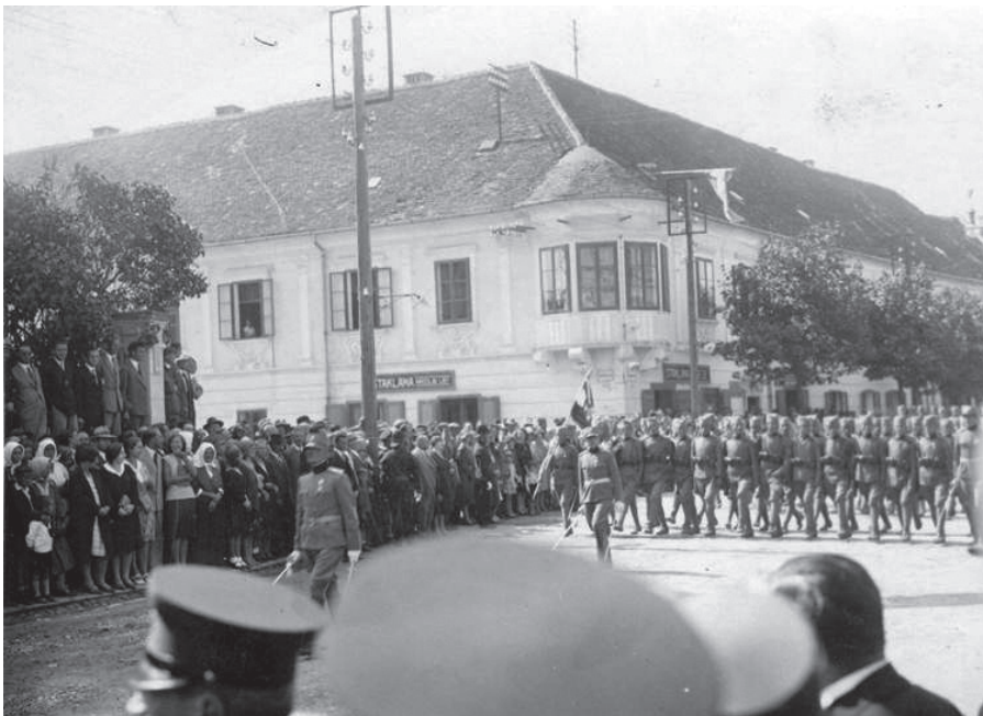
Slika 1. Mimohod vojske Kraljevine Jugoslavije varaždinskim ulicama 113