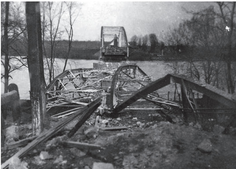
Slika 6. Srušeni kolni most preko Drave 118