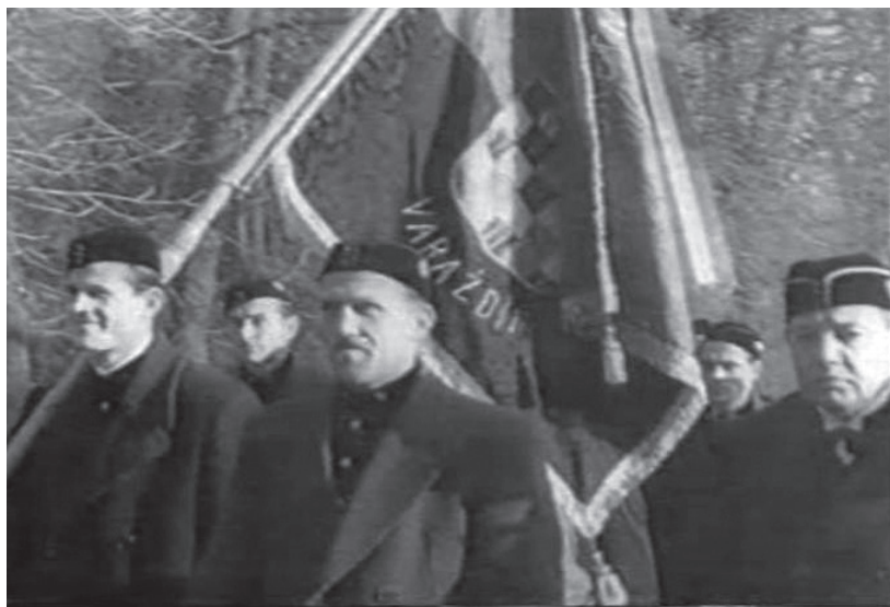
Slika 11. Mimohod današnjom Cesarčevom ulicom 123