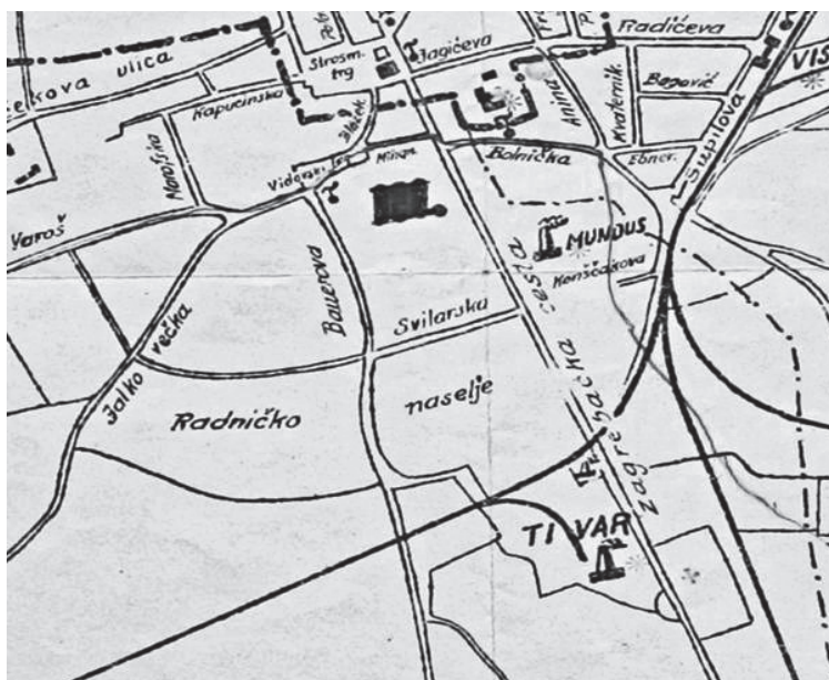
Slika 15. Karata Varaždina s prikazom lokacije radničkog naselja 127