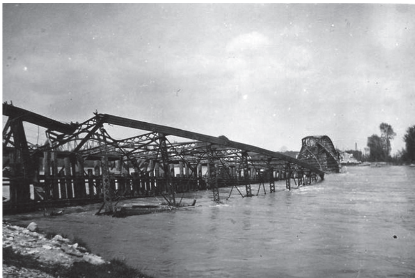
Slika 5. Srušeni željeznički most preko Drave 117