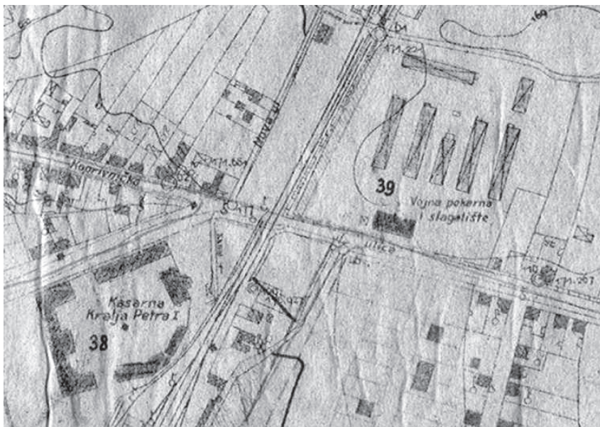
Slika 4. Kasarna Kralja Petra I. te Vojna pekarna i slagalište 116