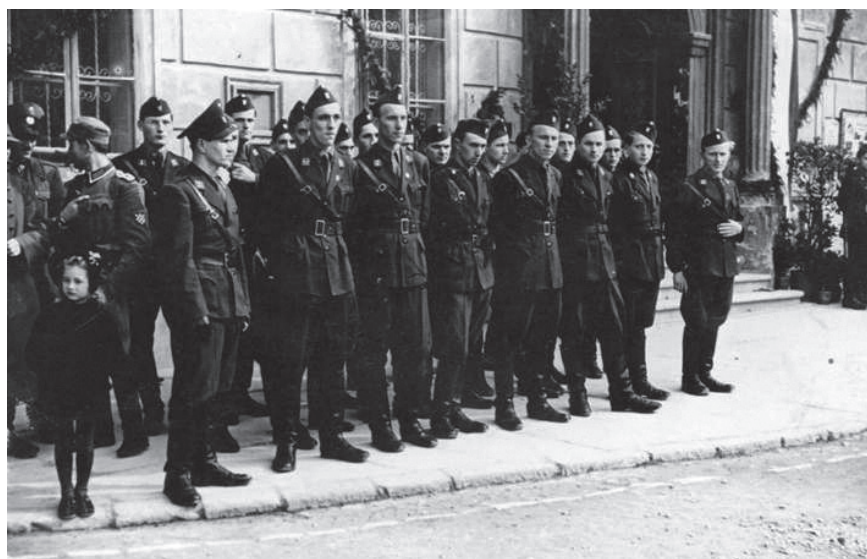
Slika 13. Fotografija snimljena ispred gradske vijećnice 125