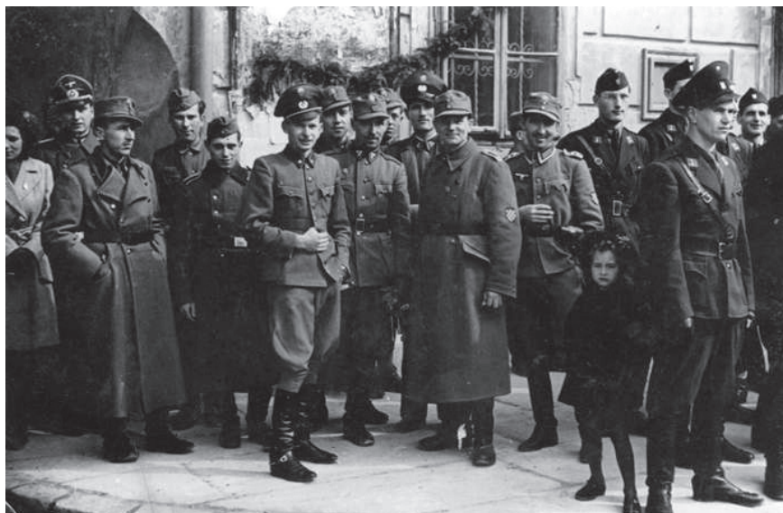
Slika 12. Fotografija snimljena ispred gradske vijećnice 124