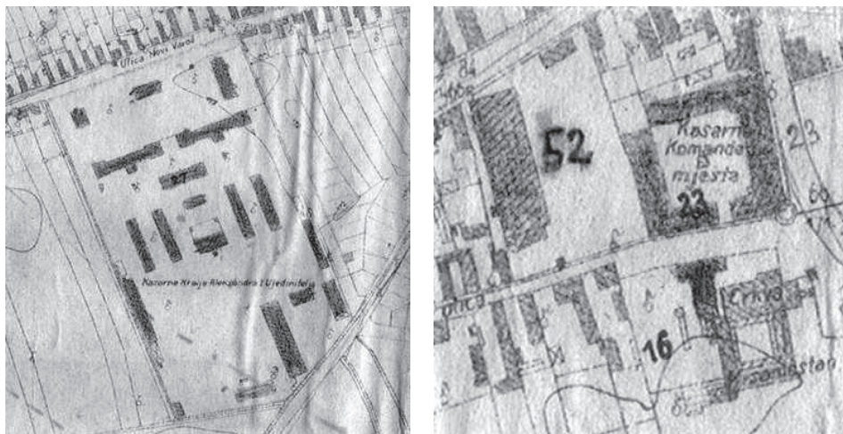
Slika 2. Kasarna Kralja Aleksandra I. Ujedinitelja i Kasarna Komanda mjesta 114