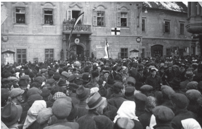
Slika 9. Varaždinci na glavnom gradskom trgu 11. travnja 1941. godine 121