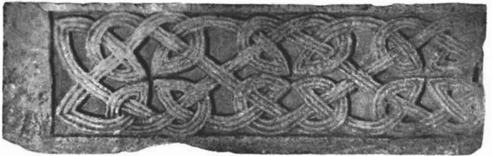
Dekoratívni pilastar iz Bola na otoku Braču