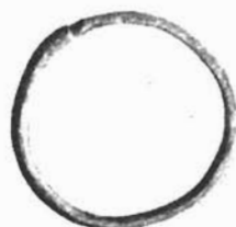
Sl. 7. Brončani prsten iz groba 5. Sl. 8. Brončani prsten iz groba 6. Sl. 12. Brončani prsten iz groba 14.