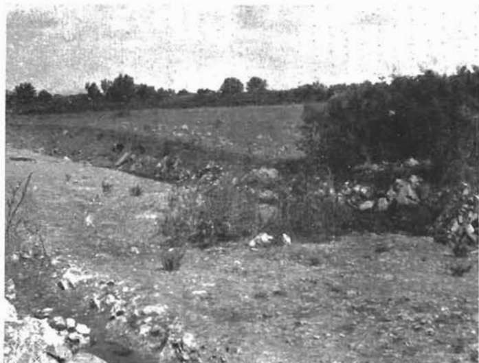
Sl. 1. Zemljište, na kojem se pojavila starohrvatska nekropola u Škabrnji.