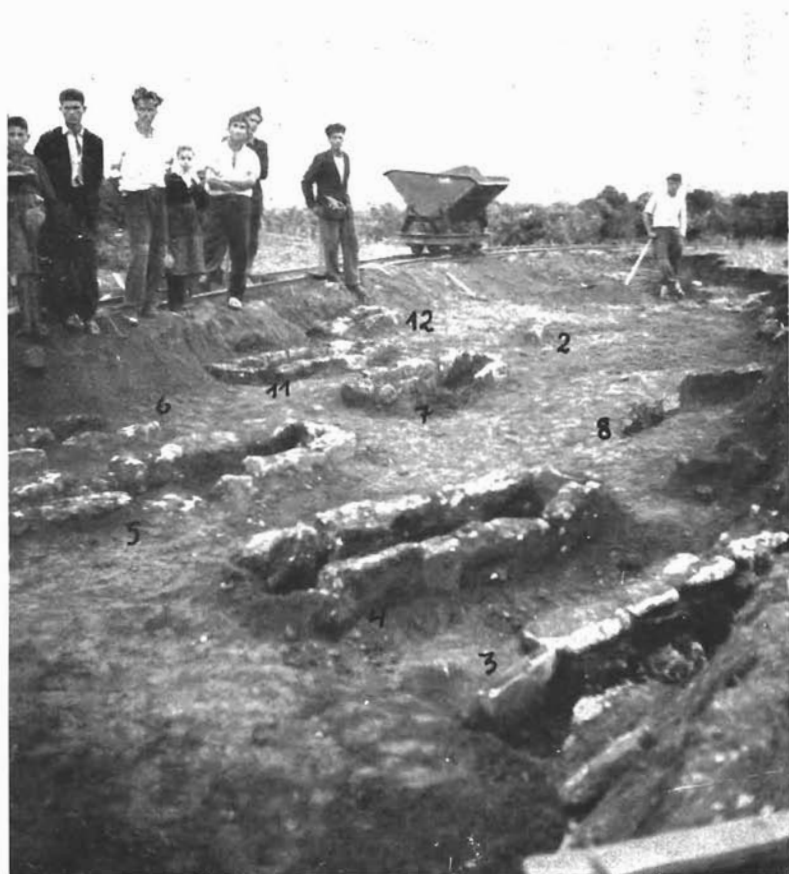
Sl. 4. Pogled na istražene starohrvatske grobove u Škabrnji.