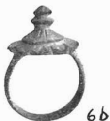
Sl. 6. Brončani prsten iz groba 3. Sl. 6. a Brončani prsten iz Nina. Sl. 6. b Brončani prsten iz Nina.