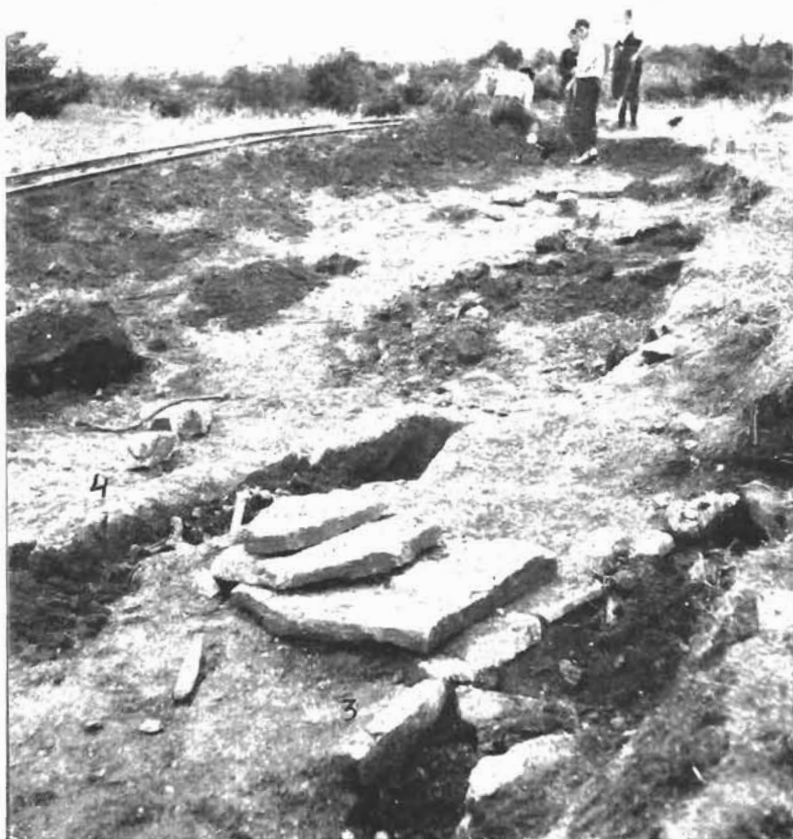
Sl. 3. Prvi pogled na otkrivene grobove.