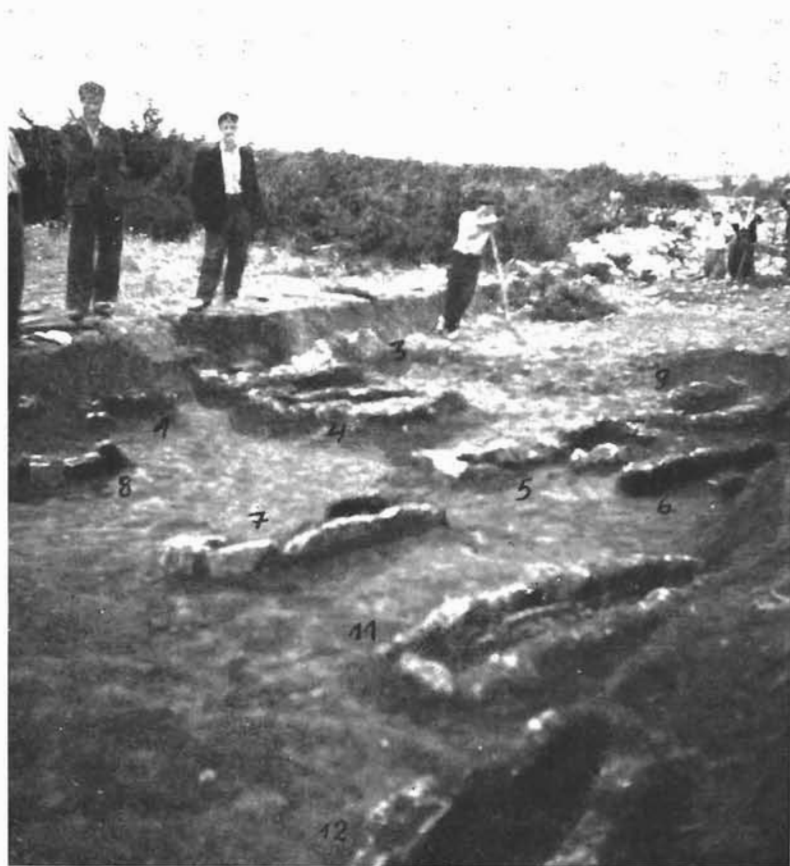
Sl. 5. Pogled na istražene starohrvatske grobove u Škabrnji.