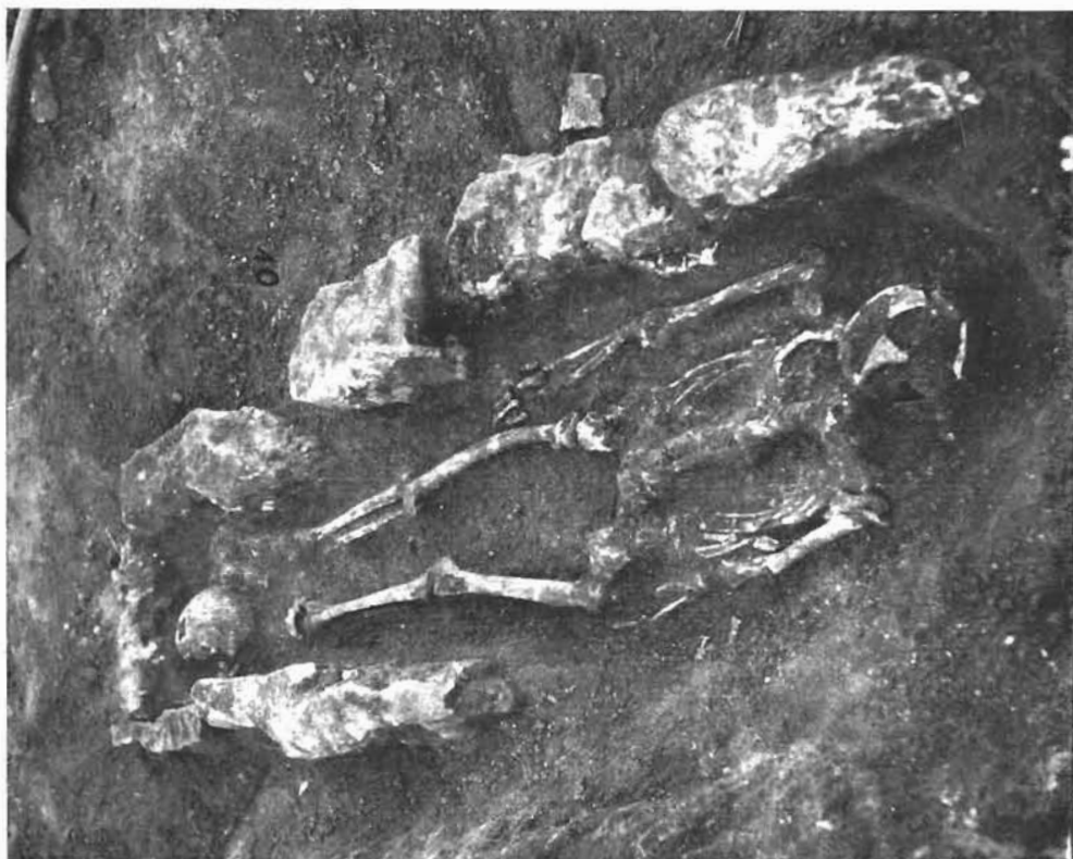
Sl. 14. Grob 10.