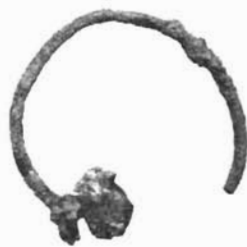
Sl. 9. Brončani prsten i nausnice s jagodom iz groba 9.