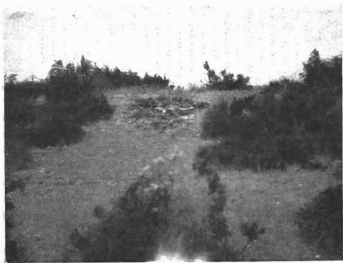
Sl. 2. Humak s ostacima crkve i grobovima.