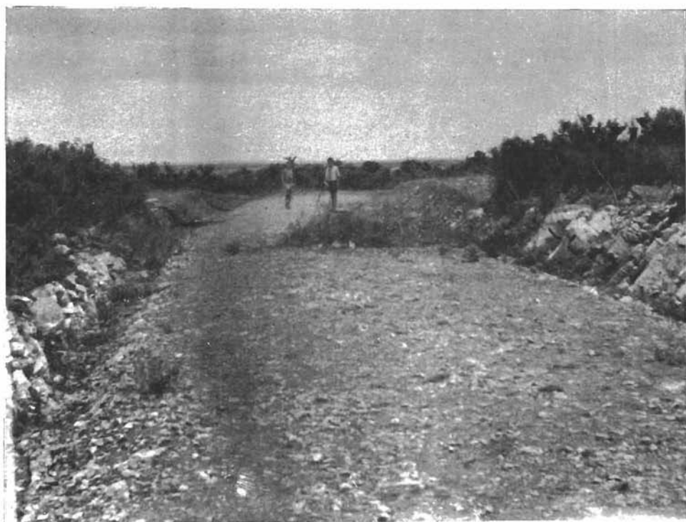
Sl. 15. Trasa željezničke pruge u Škabrnji, koja je presječla starohrvatsku nekropolu.