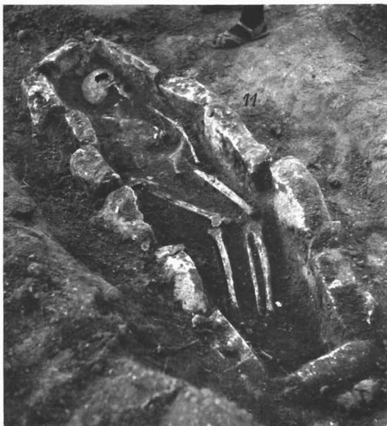
Sl. 13. Grob 11