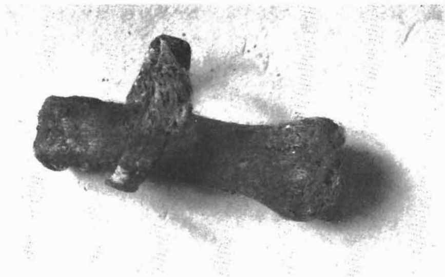
Sl. 10. Brončani prsten s ostatkom tkanine iz groba 13.