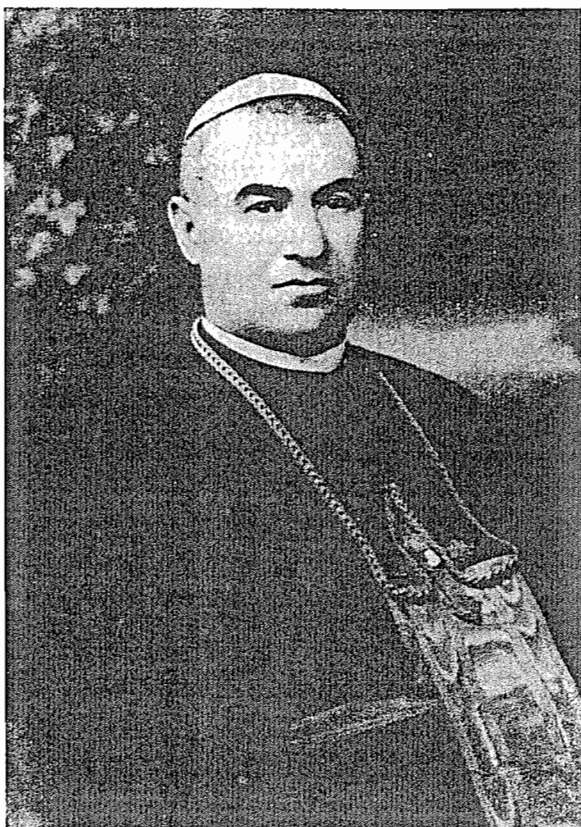
Subotički biskup Lajčo Budanović (1873–1958)