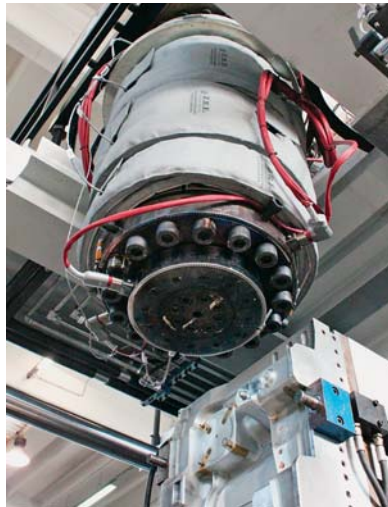
SLIKA 25 – Hidraulična glava stroja za ekstruzijsko puhanje

Glavna struktura uključuje hidraulični cilindar (za puhalo s jednostrukim hodom) i pneumatski cilindar, koji se upotrebljava za razvlačenje predoblika. Hvataljke za izvlačenje otpreska mogu se prilagoditi po visini i tako smanjiti proizvodni otpad. Pneumatski kontrolirane i sinkronizirane preko zupčanika s recirkuliranim kugličnim ležajevima, hladene su vodom. Cijeli postupak ne zahtijeva nikakvo podmazivanje. Sila zatvaranja kalupa je između 300 i 1 500 kN, obujam akumulacije glave od 3 do 40 litara, a promjer pužnog vijka od 50 do 120 mm.