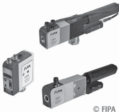
SLIKA 22 – FIPA -ina izbacivala

Izbacivala tvrtke FIPA (slika 22) s integriranom regulacijom tlaka smanjuju potrošnju komprimiranog zraka u poroznim i zatvorenim otprescima uz uštedu energije i bez skraćanja ciklusa proizvodnje. Izbacivala serije EKPP , EKP i EMM opremljena automatskom regulacijom tlaka smanjuju potrošnju komprimiranog zraka do 50 % po otpresku bez obzira na poroznost. Za pločaste otpreske, izbacivala serije EMA i EKP-LSE , uz funkciju elektroničke uštede zraka, postižu uštede i do 97 %. Integrirana elektronika aktivira se čim stupanj podtlaka dosegne određenu granicu i do tada se ne troši komprimirani zrak. Za razliku od industrijskih sustava za komprimirani zrak koji rade na 4 do 8 bara, sva FIPA -ina izbacivala upotrebljavaju 3,5 bara i postižu maksimalan podtlak od 4 bara. Tako, na primjer, u primjenama koje uključuju rukovanje drvenim oplatom godišnja ušteda od 23 % može biti postignuta tlakom od 5 bara primjenjujući izbacivalo serije EKP s nominalnom širinom od 1,5 mm. Takva ušteda postignuta je s 20 ciklusa u minuti u dvije 14-satne smjene u 220 radnih dana i potrošnjom zraka od 64,5 l/min. U izbacivalima koja upotrebljavaju višestruke komore koje, također, smanjuju potrošnju zraka, podtlaku treba više vremena da poraste i time je produljeno vrijeme ciklusa. Sva FIPA -ina izbacivala imaju maksimalnu masu od 250 g i time su 50 % lakša od drugih izbacivala.