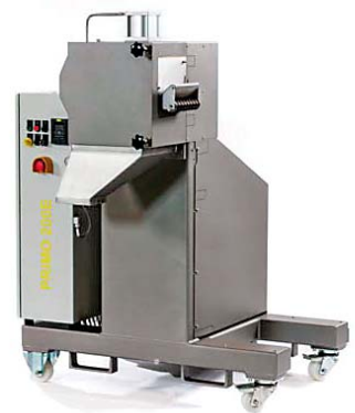
SLIKA 27 – Granulator PRIMO 200E