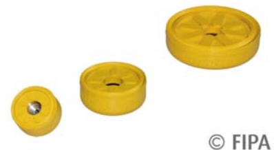
SLIKA 23 – Kratkohodne podtlačne čašice

Rukovanje vrućim injekcijski prešanim otprescima grube i zrnate površine postaje lakše s podtlačnom čašicom (slika 23) s visokom pridržnom silom i malih dimenzija, uporabnoga temperaturnog područja od –30 do 160 °C. Zahvaljujući uzlijebljenoj dvostrukoj brtvi dobiven je bolji omjer između aktivne usisne površine i potrebnog prostora, no u do sada korištenim podtlačnim čašicama s kosim usisnim brtvama. S tvrdoćom od 40 Shore A pripijaju se uz tvorevinu i razvijaju visoku pridržnu silu čak i na jako grubim površinama.