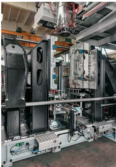
SLIKA 26 – Kalup za ekstruzijsko puhanje

ST SOFFIAGGIO TECNICA Press release, 02/2013