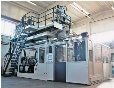
SLIKA 24 – Ekstruzijska puhalica ISIT

Tvrtka S.T. SOFFIAGGIO TECNICA S.R.L. iz Monze predstavila je puhalicu za ekstruzijsko puhanje ISIT (slika 24). Inovacija stroja očituje se u jedinici za zatvaranje s dva dijagonalna stupa koja podupiru i omogućuju da ploče kliču. Ta dva stupa, gledajući stroj frontalno, smještena su jedan gore lijevo, a drugi dolje desno, na strani izbacivanja tvorevina. Na taj način ne postoji za hvataljku i izbacivanje tvorevine nikakva zapreka u slučaju kad su tvorevina i kalup pozicionirani na višoj razini nego ploče. Jedinica za zatvaranje sastoji se od tri ploče, dvije koje pridržavaju kalup s dvije strane i treća na kojoj je instaliran hidraulični cilindar koji pomiče druge dvije ploče. Cilindar za taljenje ne treba više hladiti posebnim ventilatorima, a niti cjevčica za dobavu materijala ne zahtijeva intenzivno hlađenje, što pridonosi uštedi energije i omogućuje optimalnu kontrolu temperature taljenja.