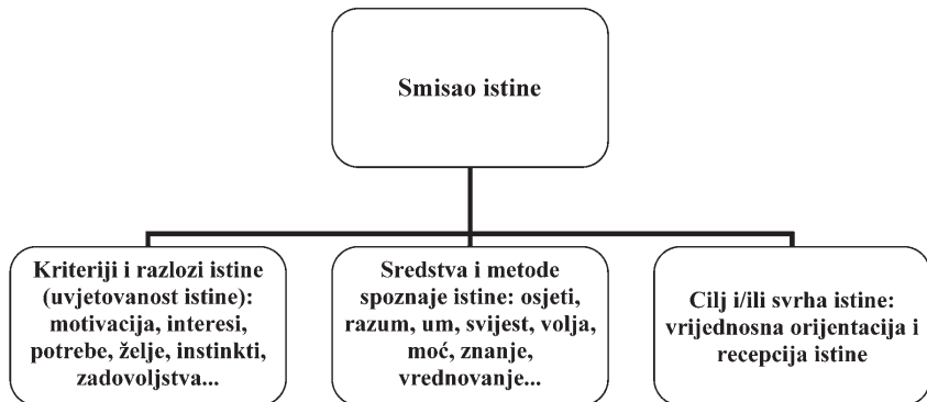
Slika 3. Osnovni strukturni dijelovi smisla istine

mjeriti prema tome koliko njegovo ostvarenje pridonosi općem dobru – prirode, čovjeka, društva, čovječanstva; u kojoj mjeri je taj cilj, primjerice, sa stajališta bioetike i holističke ekološke kulture, 27 vrijedan. Karakter ciljeva odgovara karakteru sredstava. Nemoralni ciljevi ostvaruju se nemoralnim sredstvima i metodama, a moralni ciljevi – ljudskim moralnim sredstvima i metodama. Potonje ciljeve ponajviše čine univerzalno-vrijednosni sadržaji čije su sastavnice – jednakost, pravednost, multikulturalnost, intersubjektivna komunikativnost, odgovorna sloboda, prospektivna odgovornost, demokratski etos, ekološki etos, svjetski ekološki etos, bioetička vrijednosna orijentacija i recepcija. Takav sustav vrijednosti zahtijeva da se sredstva za život ne shvaćaju mjerilom života, jer je jačanje samoga života njegovo mjerilo (Nietzsche). Razmotrimo osnovne strukturne dijelove smisla istine (Slika 3):