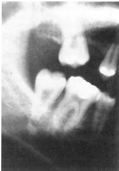
Slika 1. Istodobna pojava taurodontizma kod drugog gornjeg kutnjaka i piramidnog korijena kod drugog donjeg kutnjaka

Istraživanja taurodontizma često se temelje na analizi frekvencija pojedinih stupnjeva anomalije ustanovljene samo na temelju kliničkog izgleda i bez objektivne evaluacije što dobivene rezultate čini nekomparabilnima. U ovome radu taurodontizam je dijagnosticiran i klasificiran na temelju objektivne evaluacije morfoloških osobitosti molara izračunavanjem taurodontnog indeksa po metodi Shifmana i Channela (8). Također su u ukupnom uzorku analizirani razni stupnjevi taurodontizma zajedno sa zubima s piramidnim korijenima jer su dosadšnja istraživanja pokazala da se te anomalije korijena često javljaju zajedno u istih osoba (slika 1) i u istim obiteljima (9, 10, 23). Bixler (18) zbog toga smatra da se radi o istom genetskom uzroku obaju stanja.