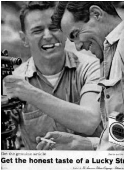
Get the genuine article Get the honest taste of a Lucky Str