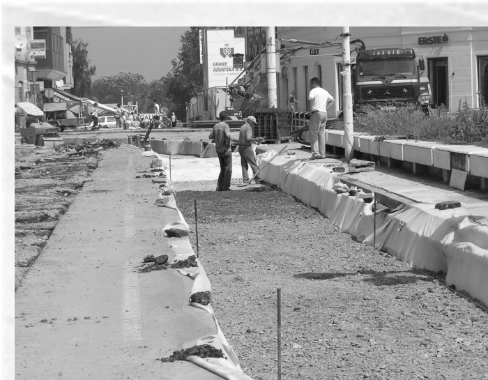
Slika 4. Pripremljen tamponski sloj.