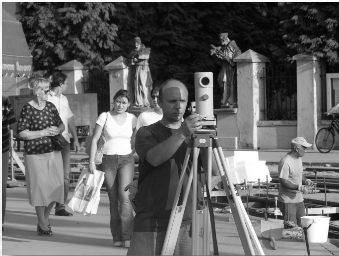
Slika 9. Precizni nivelir ZEISS KONI 007.

nekoliko centimetara ispod GRT-a. Pruge izvedene u cestovnom pojasu zatvaraju se montažnim betonskim pločama. Ti su elementi praktični jer ih je moguće lako ukloniti, što omogućuje popravke na montažnom priboru tračnice i olakšava rad pri budućim rekonstrukcijama pruge. Ploče su izrađene kao unikatni elementi i izrađuju se u kalupima napravljenim prema projektom zadanim radiusima, te prema projektiranim pružnim sklopovima (skretnicama i križalištima). Na izvedenoj betonskoj ploči iskolčavaju se mjesta na kojima se mijenja tip betonske ploče (mjesta na kojima se mijenja radijus, prelazi iz pravca u krivinu, itd.). Iskolčenje se obavlja instrumentom s poligonske mreže. Na betonskoj ploči u osi pruge urezuje se linija okomita na tu os. Ovime je iskolčenje tramvajske pruge završeno.