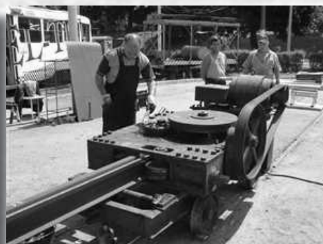
Slika 7. Stroj za savijanje tračnica.