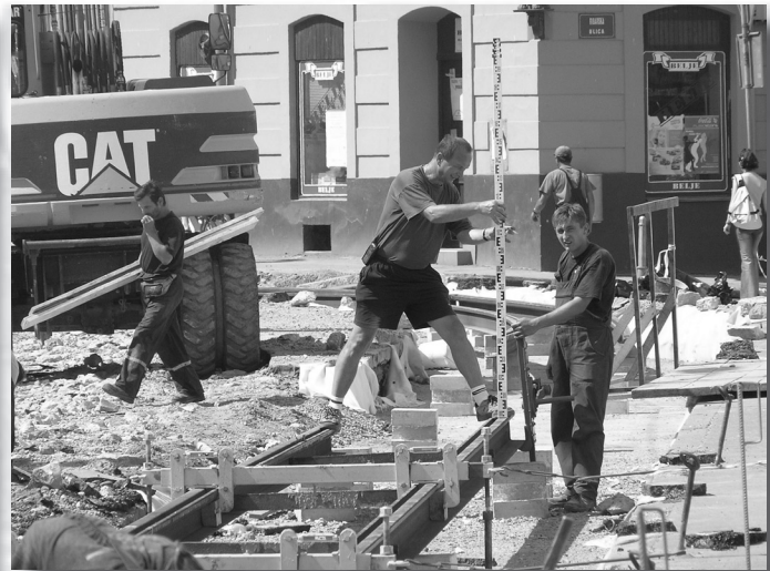
Slika 10. Visinsko iskolčenje pruge.

koje točke iskolčenja trebaju izvođaču za montažu pojedinih sklopova.