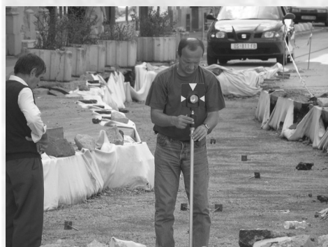
Slika 6. Iskolčenje osi pruge.

Kod pruga izvedenih u zasebnom pojasu (izvan cestovne površine), prostor između tračnica nasipava se kamenom – tucanikom, sve do visine od