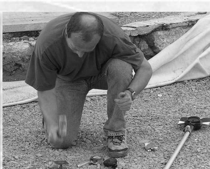
Slika 5. Označavanje točke čeličnim klinom.

Na tako pripremljenoj podlozi pristupa se iskolčenju osi novoprojektirane pruge. Dakle ne iskolčava se svaka tračnica zasebno, nego os pruge. Za iskolčenje osi tramvajske pruge na tamponu koriste se čelični klinovi duljine dvadesetak centimetara s oštrim vrhom i plosnatom glavom na gornjoj strani (5x5 cm). S poligonske mreže odredi se položaj točke iskolčenja na tamponu. Na tom mjestu se zabije čelični klin s plosnatom glavom. Zatim se ponovno iskolčava ista točka na glavi klina. Ukoliko to vidljivost dopušta, poželjno je iskolčenje na glavi klina obaviti uz pomoć male značke na kratkom nosaču ( R=0.10 m). Točka na glavi šipke označava se urezivanjem ili bojanjem križića tankim kistom. Iskolčenje se vrši u svim točkama koje su zadane projektom, čija je udaljenost na pruzi u pravcu 5 m. Udaljenost između točaka iskolčenja u krivini ovisi o radijusu krivine. Za krivine s malim radijusom, tračnice se unaprijed strojno savijaju prema zadanom radijusu, što olakšava njihovo polaganje u projektni položaj. Savijanje tračnica u krivinama s manjim radijusom nije moguće neposredno pri montaži.