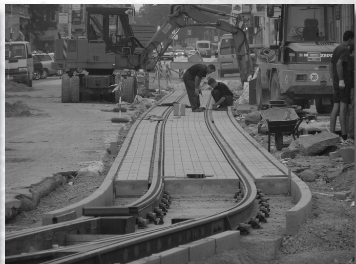
Slika 12. Postavljanje betonskih ploča.