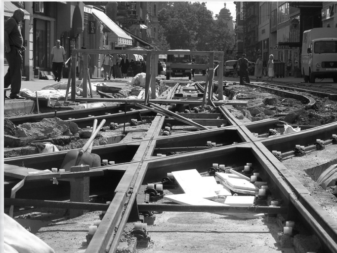
Slika 3. Križalište.

Pri rekonstrukciji postojećeg tramvajskog kolosijeka, novi kolosijek često vrlo malo odstupa od položaja postojećeg kolosijeka, pa je kod snimanja pojedinog profila tramvajске pruge potrebno, osim tračnice, snimiti i teren uz prugu, odnosno cestu