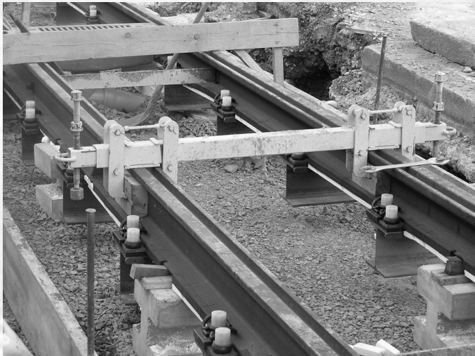
Slika 2. Pričvrtni pribor i "jaram".

kao neizjednačeni poligonski vlakovi sa zajedničkom početnom poligonskom stranicom, tako da i druge postojeće poligonske točke, koje će se naći u ovakvom vlakvu, dobivaju nove koordinate. Visine poligonskih točaka određuju se nivelmanom povećane točnosti između postojećih repera. Točnost određivanja visina poligonskih točaka jednako je važna kao i određivanje njihova položaja, kako zbog davanja vjerodostojnog podatka za potrebe projektiranja, tako i zbog točnosti od \pm 1 mm kojom je potrebno postaviti novopoložene tračnice na visinu. Ukoliko je pri niveliranju visinska pogreška između poznatih repera prevelika, potrebno je pristupiti određivanju visina poligonskih točaka isto kao pri određivanju njihova položaja. Niveliranje je obavezno izvršiti dva puta (naprijed - natrag). Pri razvijanju poligonskih vlakova za potrebe projektiranja tramvajskih pruga ne primjenjuje se računanje u lokalnom koordinatnom sustavu, jer se često istovremeno s projektiranjem pruge vrši i projektiranje drugih prometnih površina uz prugu. Eventualna manja odstupanja u koordinatama poligonskih točaka koje se koriste za iskolčenje cestovnih i pješačkih površina nisu bitna jer i tražena točnost iskolčenja tih objekata nije visoka kao kod iskolčenja pruge.