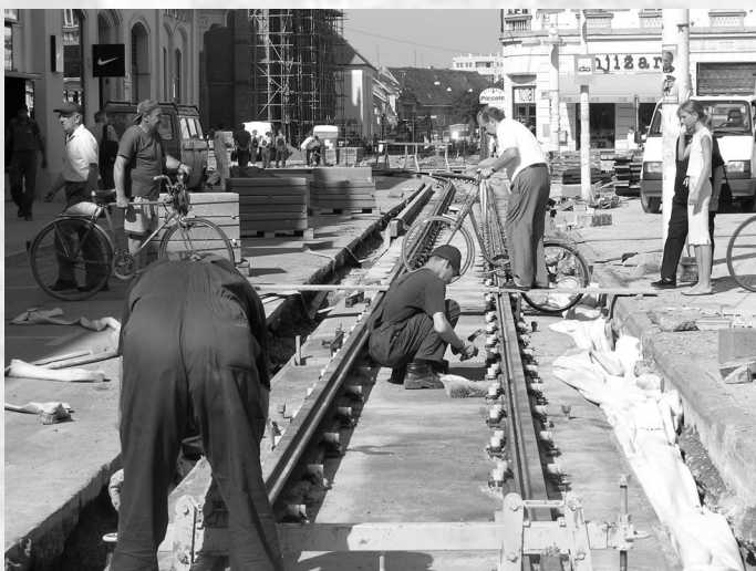
Slika 11. Pruga nakon betoniranja.

Za izvođenje ovakvih radova potrebno je poznavati elemente od kojih se sastoje tračnički sklopovi, kao i kompletne sisteme izvođenja tramvajskih tračnica. To je potrebno kako bi se snimanjem obuhvatili svi potrebni elementi za projektiranje nove pruge. Također, potrebno je znati što koja točka iskolčenja predstavlja na terenu i