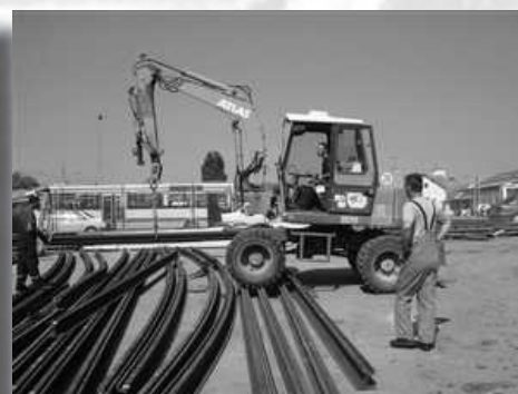
Slika 8. Tračnice savijene prema zadanom radijusu.