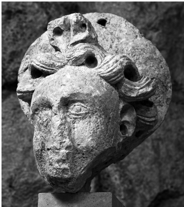
Glava sv. Mihovila (?)

koji ga je iza Drugoga svjetskog rata ustupio Muzeju grada Splita. 30 Zanimljivo je da se oko 1720. smatralo kako je to grb Ivana Ravenjanina, utemeljitelja crkve. 31