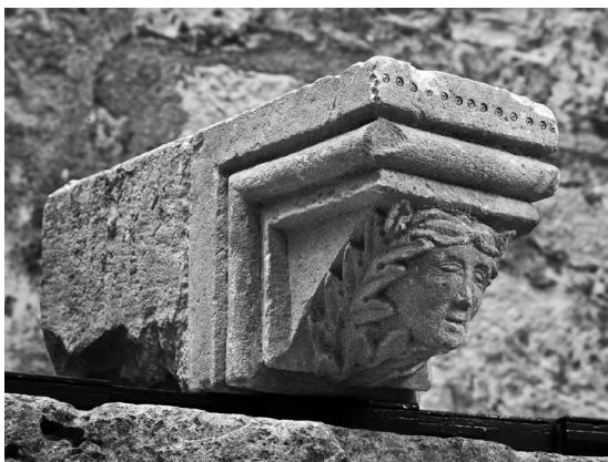
Donje konzole edikule sa Sv. Mihovila

Crkva sv. Mihovila nalazila se na prometnom mjestu, u ulici koja je od luke vodila prema glavnom trgu ispred Komunalne palače. Zato je uz nju u 15. st. bila podignuta loža u kojoj se prodavao kruh. Naime, Općina je pekarima htjela