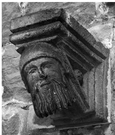
Lijeva i desna konzola sa Sv. Mihovila

u Arheološkom muzeju. 33 Njeno podrijetlo nije poznato, ali se po oštećenju lica i naslagama kamena 34 može zaključiti da je stajala negdje vani i bila izložena vremenskim nepogodama, tj. na mjestu kao što je edikula sa Sv. Mihovila. 35 Zato