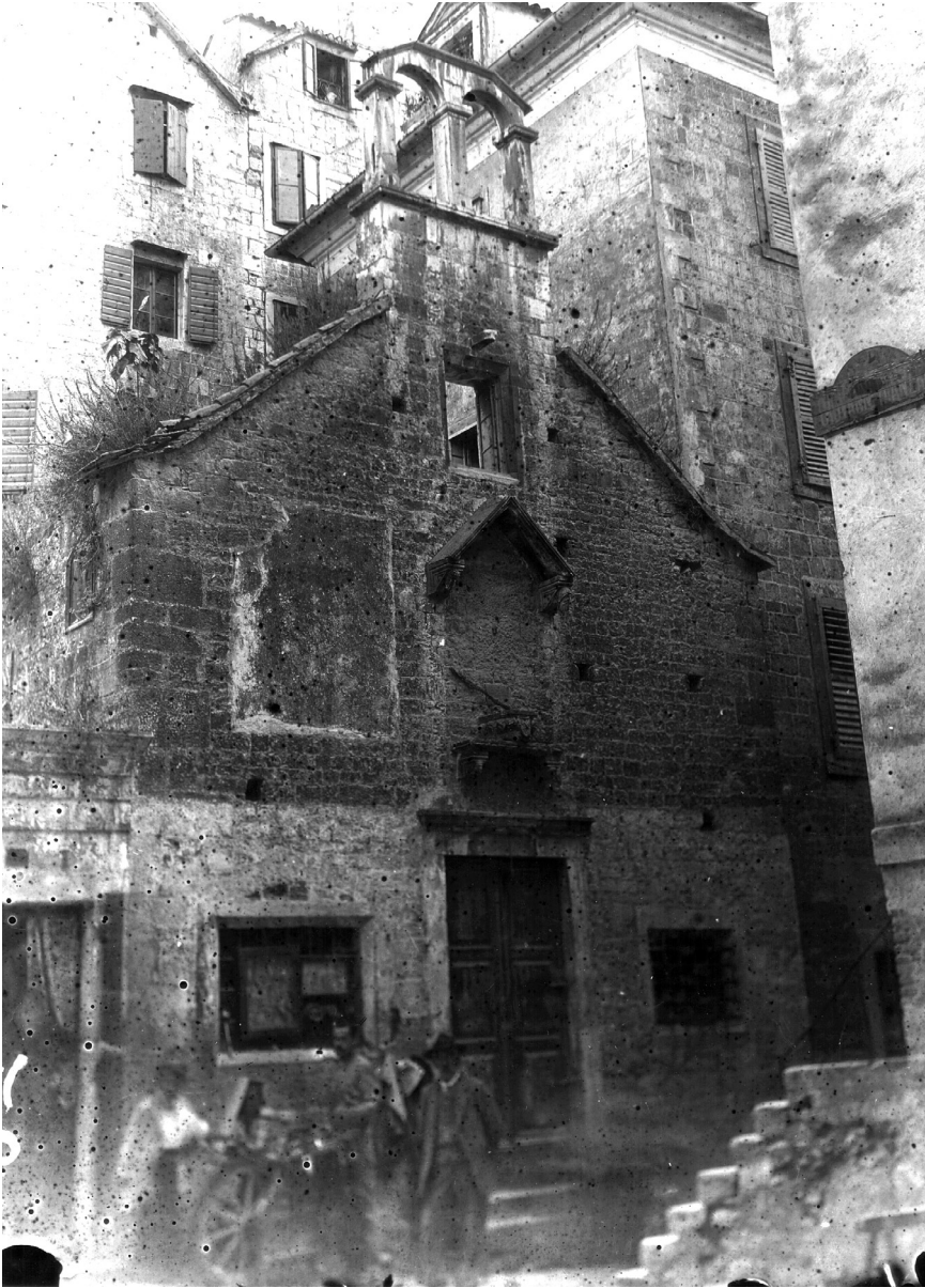
Crkva sv. Mihovila in ripa maris prije rušenja 1906. godine

generalni providur Alvise Mocenigo 5. travnja 1697. odobrio nabavu malog slobodnog zemljišta na sjevernoj strani crkve za njenu izgradnju. 4