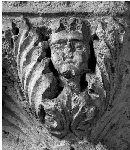
Glavica na kapitelu iz Arheološkog muzeja

nije isključeno da je u Muzej došla 1906. zajedno s ostalim spomenicima, ili pak ranije, poput Kristove glave iz iste crkve koju je 1885. darovalo sjemenište. 36 Što se tiče vremena njene izrade ono je određeno Zabarellinim grbom, a to je prva polovica XV. stoljeća.