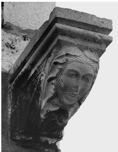
Konzole na kući u Bajamontijevoj ulici

Konzole s glavama dvojice muškaraca, koje su nosile krov edikule, 37 bile su, kao što je rečeno, datirane na početak XVI. stoljeća. Grb nadbiskupa Zabarelle, međutim, jasno pomiče njihovu izradu u prvu polovicu XV. stoljeća. 38 Muškarac s dugom bradom nosi kapicu kakvu ima majstor s korskih klupa splitske kate-