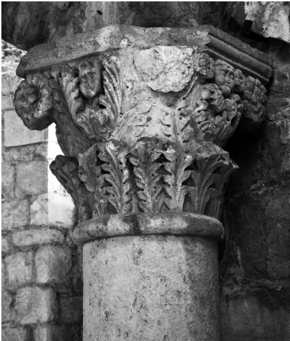
Kapitel s glavicama iz Arheološkog muzeja