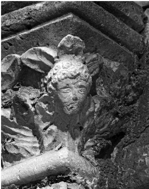
Lijevo kapitel portala kraj crkve Gospe od Zvonika