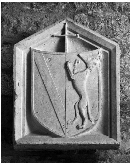
Grb nadbiskupa Zabarelle