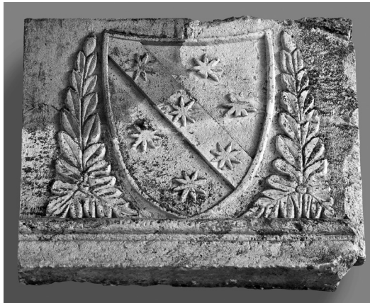
Grb nadbiskupa Zabarelle

osigurati udobno i natkriveno mjesto pa je 21. studenoga 1442. sklopila ugovor s prokuratorima samostana po kojem oni dopuštaju izgradnju lože uz uvjet da prodavači na svečev blagdan svake godine daju crkvi dva duplira, tj. velike svijeće od po dvije libre težine svaka. 5 Zbog prometnog položaja je i poduzetni i bogati trgovac Ivan Krstitelj Augubio 1449. iznajmio jedno skladište kod crkve. 6 Vjerojatno se zbog istog razloga na Trgu zeleni uz crkvu nalazila berlina, mjesto gdje su kažnjenici izvirgavani ruglu, a koja se spominje 1690. godine. 7 Uzme li se u obzir ustaljena predodžba o sv. Mihovilu kao pobjedniku nad Sotonom, odnosno zlom, i kao anđelu koji važe duše pokojnika na posljednjem sudu onda je postavljanje berline u blizini njegove crkve još logičnije. 8