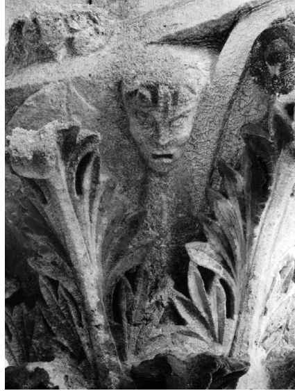
Glavica na kapitelima periptera Dioklecijanovog mauzoleja