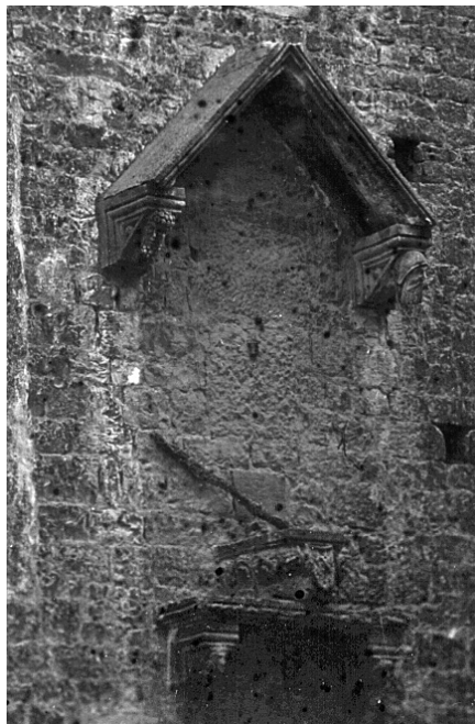
Edikula na crkvi sv. Mihovila in ripa maris