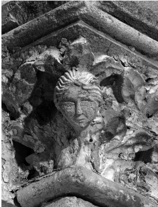
Desni kapitel portala kraj crkve Gospe od Zvonika