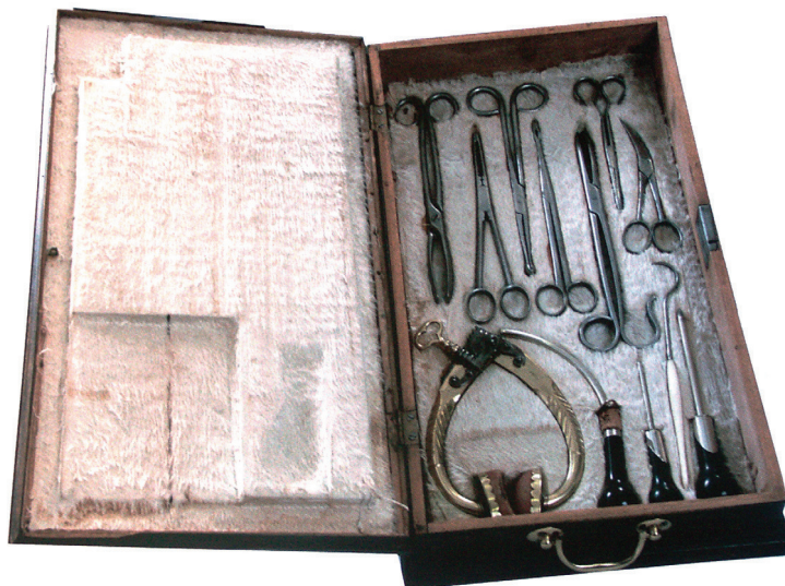
Drvena ukrašena kutija (45 x 26 cm) s dva seta kirurških instrumenata A decorated wooden chest (45 x 26 cm) with two sets of surgical instruments

započinje i njegov tjelobrižnički rad. Taj vijek, ispunjen radom, trajao je samo petnaest godina. Uz liječenje tijela bavio se i liječenjem duša – uz ljekarništvo bavio se i dušobrižništvom 44 .