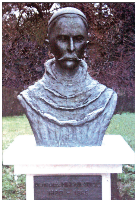
Poprsje dr. fra Mije Sučića ispred bolnice koja nosi njegovo ime u Livnu.

Ako je suditi po spomeniku, braća franjevci i zahvalni narod nisu štedjeli truda da mu načine ovakav spomenik koji još uvijek svojom veličinom dominira goričkim grobljem. I bolnica u Livnu nosi njegovo ime, kao županijska bolnica. Tamo je i poprsje dr. fra Mije Sučića ispred bolnice, koje podigoše franjevci, kao nijemi svjedok minule epohe i franjevačke humane misije. To je ujedno i potvrda kako se ne zaboravljaju dobročinitelji koji su zadužili narod. I tako, vrativši se bar u mislima