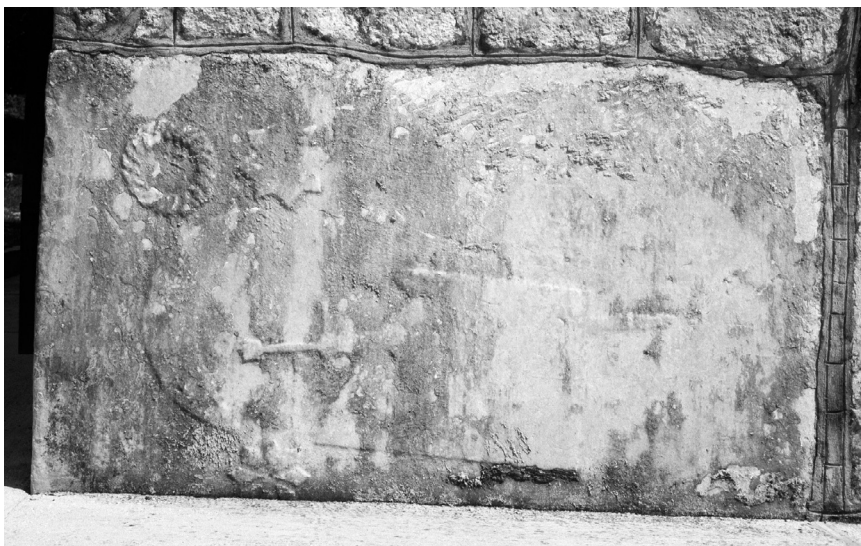
Stećak uzidan u sjeverozapadni ugao crkve u Stiljima (kat. 3)