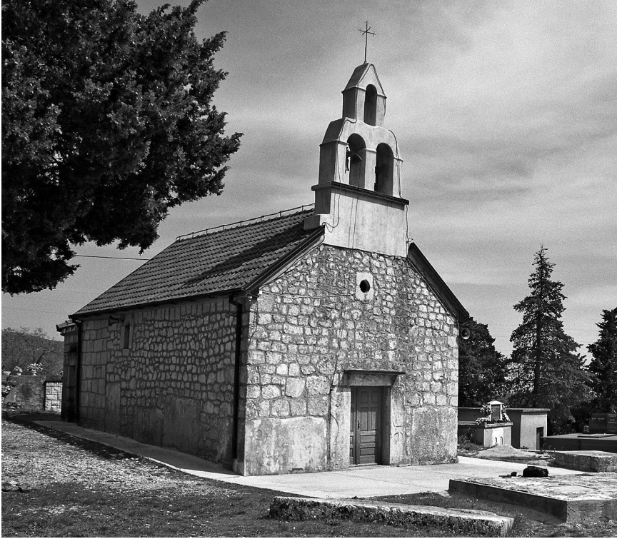
Crkva sv. Ivana Krstitelja u Stiljima

jem XIV. i u XV. stoljeću klešu stećke na širem području Vrgorca, dijelu današnje Imotske krajine, Makarskog primorja i susjedne Hercegovine. 2