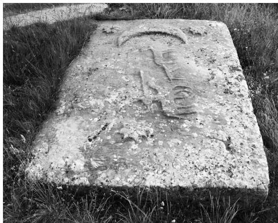
Stećak ispred pročelja crkve u Stiljima (kat. 6)

Opis: Na ovom najvećem sanduku u Stiljima (i jednom od većih uopće) središnji dio gornje plohe zauzima prikaz lova. Konjanik s kopljem i njegov pas progone jelena. Lijevo od tog prikaza dvije su osmerokrake zvijezde i veliki polumjesec, a desno jedna osmerokraka zvijezda. Na dva je ruba vrlo slabo vidljiva S bordura.