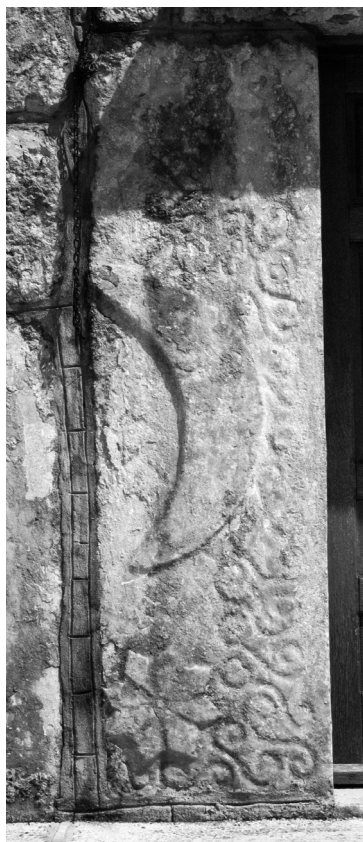
Dio stečka kao lijevi dovratnik crkve u Stiljima (kat. 9)