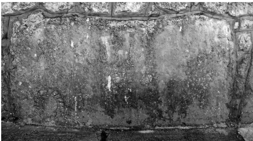
Stećak uzidan u sjeverni zid crkve u Stiljima (kat. 1)

Opis: Na stećku je vidljiv isklesan samo tordirani vijenac, djelomično oštećen