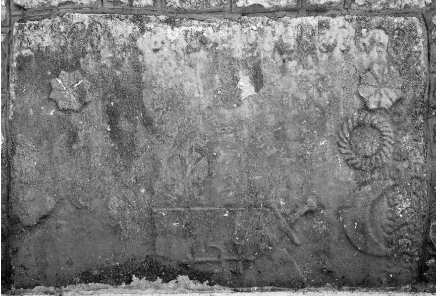
Stećak uzidan u sjeverni zid crkve u Stiljima (kat. 2)