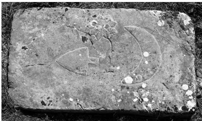
Stećak kod crkve sv. Mihovila u Ravči (kat. 13)

Opis: Gornja je ploha ukrašena reljefom motike, polumjeseca i deveterokrake zvijezde.