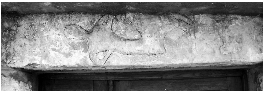
Dio stečka kao nadvratnik crkve u Stiljima (kat. 8)

Opis: U reljefu je sačuvan ljudski lik s rukama na bokovima. Prikaz je sačuvan vrlo loše.