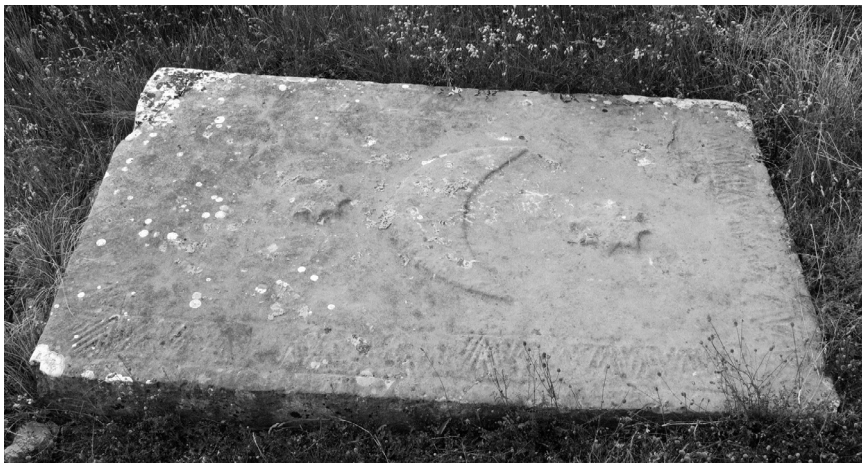
Stećak ispred pročelja crkve u Stiljima (kat. 7)

Opis: Uz rub gornje plohe slabo je sačuvana bordura ispunjena trokutima. Središnji dio plohe zauzima reljef polumjeseca s dvije osmerokrake zvijezde lijevo i desno od njega. Na jednoj kraćoj strani latinski je križ.