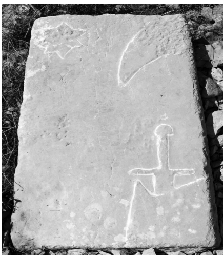
Dio stečka na Trlinovoj njivi (kat. 11)