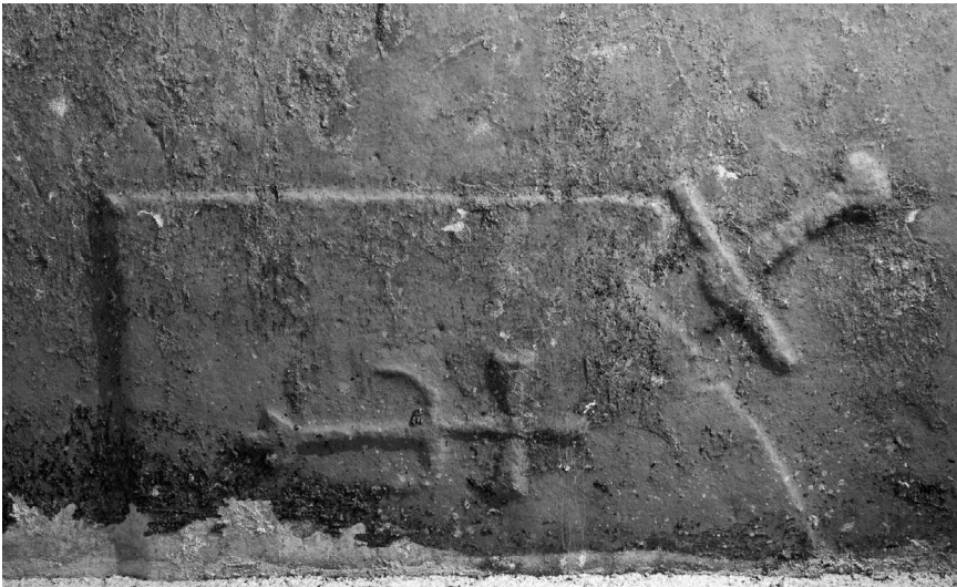
Detalj s križem i liljanom na štitu (kat. 2)

Br. 3. Sanduk uzidan u pročelje crkve u sjeverozapadnom uglu