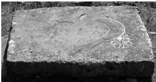
Stećak kod crkve sv. Mihovila u Ravči (kat. 14)

Opis: Na gornjoj je plohi prikaz polumjeseca i osmerokrake zvijezde.