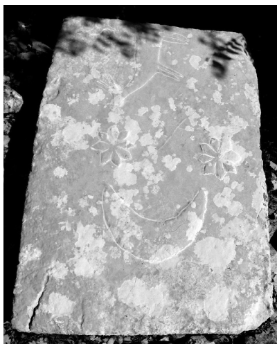
Dio stečka na Trlinovoj njivi (kat 12)