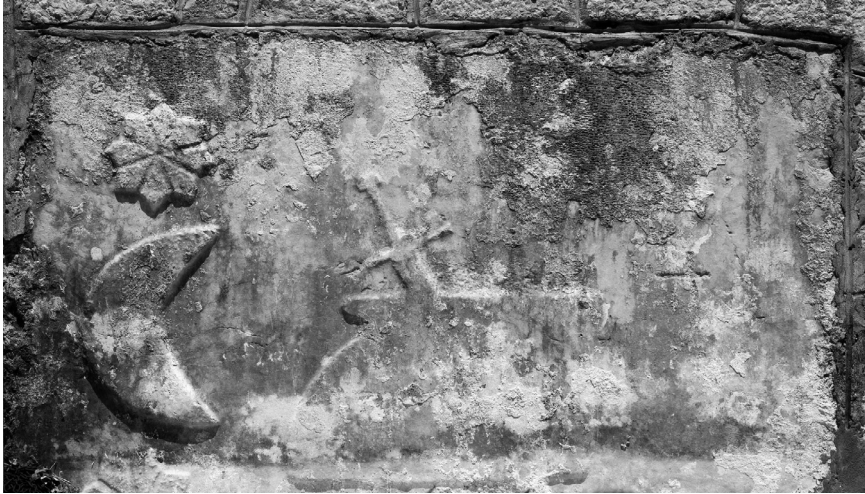
Stećak uzidan u južni zid crkve u Stiljima (kat. 5)

Opis: Središnji dio plohe zauzima reljef štita s mačem, a na lijevoj su strani dvije osmerokrake zvijezde i polumjesec. Desno je od štita naknadno urezan manji križ.