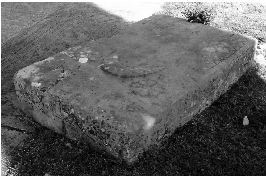
Stećak jugozapadno od crkve u Stiljima (kat. 4)

godina 189?. Na jednoj užoj strani uklesan je križ (ne kao niski nego kao plitki reljef).