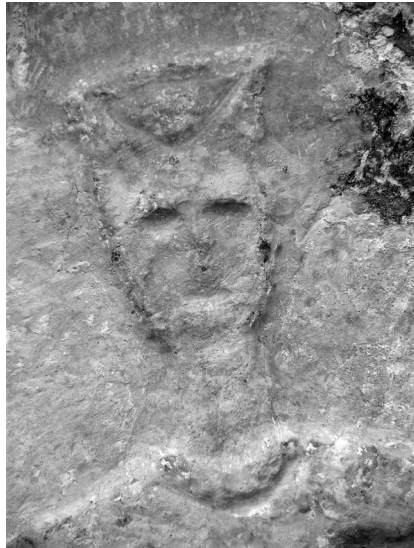
Detalj orantice (kat. 16)