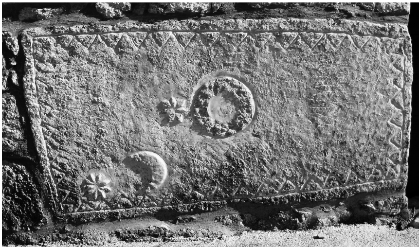
Stećak uzidan u pročelje crkve u Kljenku (kat. 18)

Br. 19. Ulomak stećka iskorišten kao podnožje oltara u crkvi