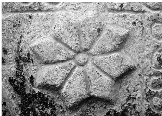
Detalj sa stećka u Kljenku (kat. 17)

Br. 18. Stećak uzidan u pročelje crkve lijevo od vrata