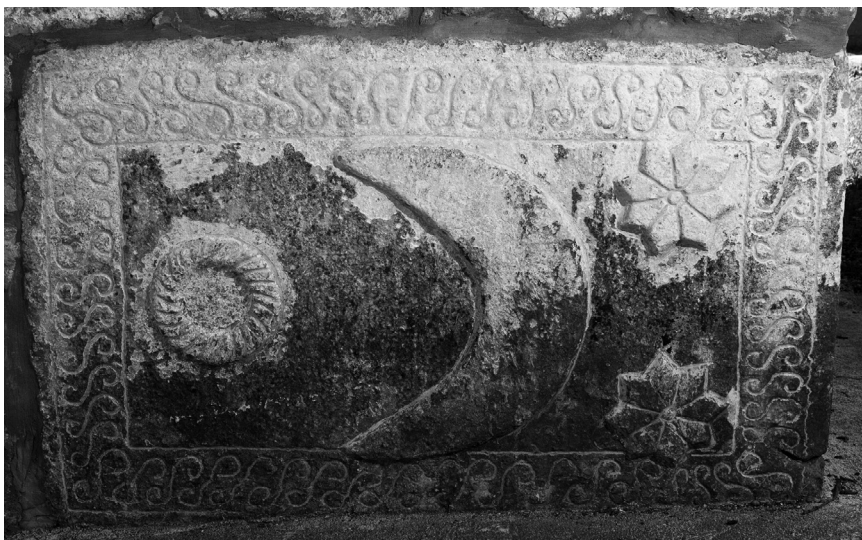
Stećak uzidan u sjeverni zid crkve u Kljenku (kat. 17)

Opis: Rubom čitavog stećka teče uokvirena S bordura. Gornjom plohom dominira veliki polumjesec, lijevo od kojega je tordirani vijenac a desno dvije osmerokrake zvijezde. Na vidljivoj je kraćoj strani otučen križ.