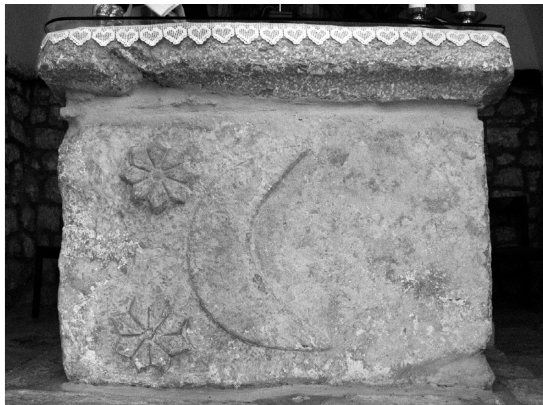
Stećak iskorišten kao podnožje oltara crkve u Kljenku (kat. 19)

Opis: Sačuvan je prikaz polumjeseca i dviju osmerokrakih zvijezda lijevo od njega.