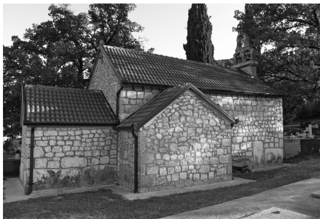
Crkva Svih svetih u Kljenku

Kljenak je selo smješteno uz cestu Ravča–Makarska. Crkva Svih svetih nalazi se nešto sjevernije od te ceste. Sagrađena je vjerojatno u prvoj polovici XVIII. stoljeća i pokazuje najmanje tri građevinske faze. U zidove je uzidano sveukupno 25 čitavih stećaka i ulomaka, iako je moguće da samih ulomaka ima znatno više.