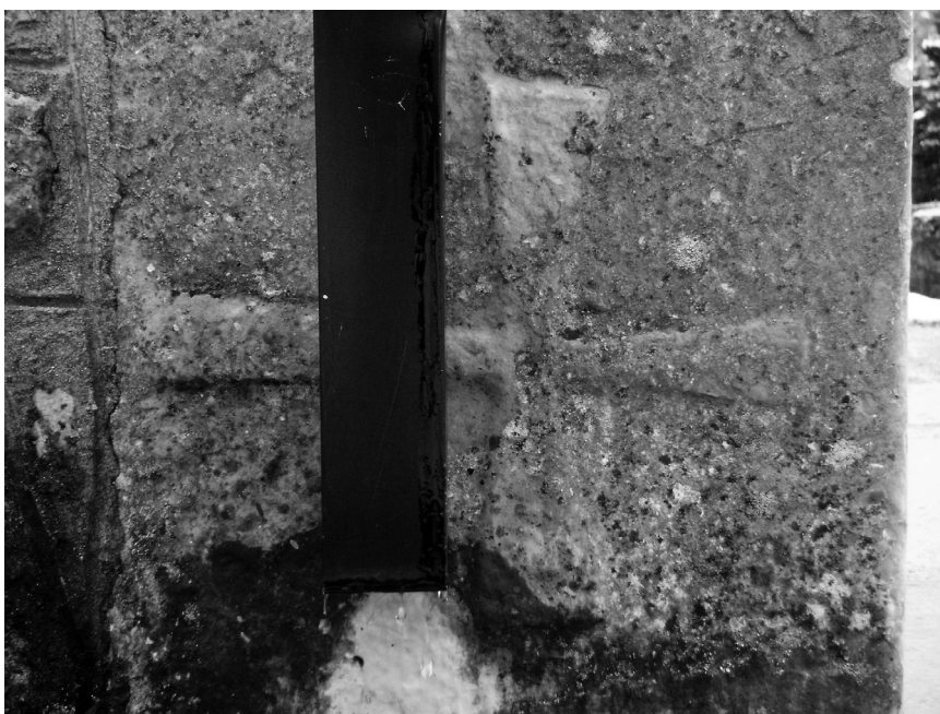
Križ na stećku (kat. 3)

Br. 4. Sanduk nekoliko metara od jugozapadnoga ugla crkve