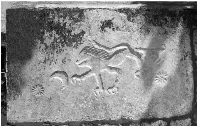
Stećak s lavom uzidan u crkvu u Kljenku (kat. 15)