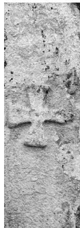
Križ na stećku (kat. 15)

Br. 16. Stećak uzidan u sjeverni zid crkve