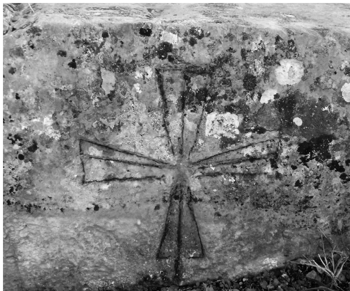
Križ na stećku (kat. 4)