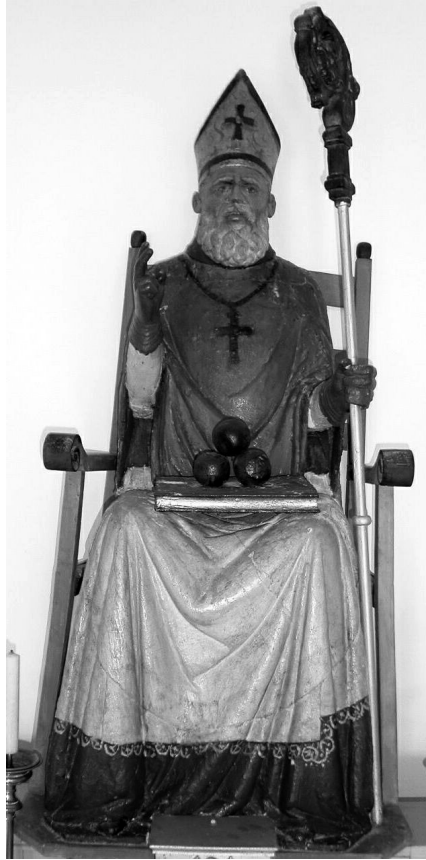
Skulptura sv. Nikole, Martinšćica, kapela Sv. Nikole, izvorno iz kapele Sv. Nikole u zaseoku Breg

Donji je dio oblikovan kao masivni skoro pravilni kubus, kojeg tvore u prostor izbačena koljena i draperija, koja poput zavjese obavija cijeli donji dio tijela. Sveci sjede na jednostavnoj katedri s naznakom jastuka, osim sv. Nikole koji je sekundarno dobio stolicu s naslonom za leđa i ruke. Takve su skulpture svetih biskupa pripadale serijskoj produkciji, a međusobno su se razlikovale samo po atributima. 12 Sv. Nikola iz Martinšćice u krilu nosi knjigu i tri kugle, dok su sv. Gaudencije i sv. Izidor prikazani samo kao biskupi, bez pratećih atributa.