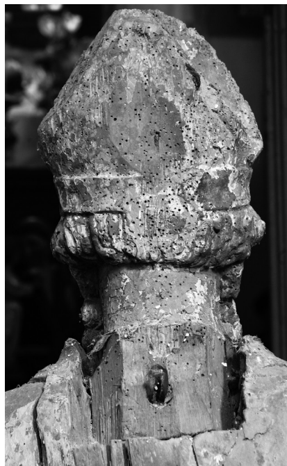
Skulptura sv. Nikole, Lubenice, sakristija župne crkve, detalj glave

skulpture titulara prikazuju sv. Antuna opata u sjedećem stavu, s mitrom na glavi i pastoralom u ruci i smještene su u centralnu nišu triptiha čija manja, bočna krila krase slikani prikazi. 42