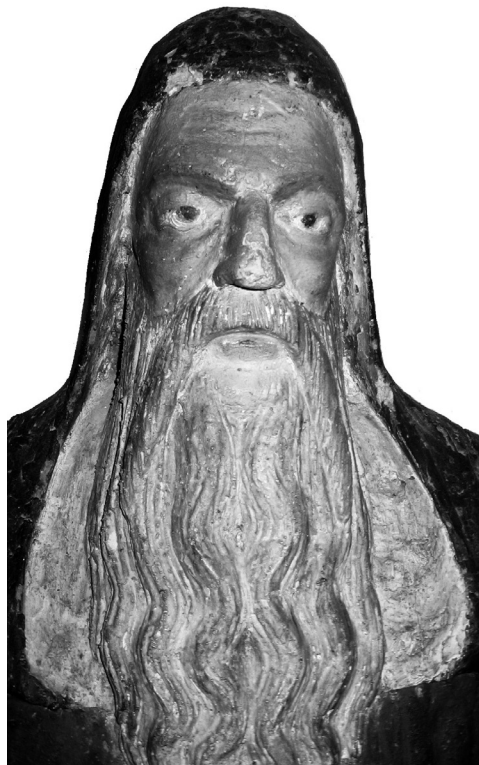
Skulptura sv. Jeronima, Cres, Creski muzej, detalj glave

Sv. Blaž, mučenik i biskup, prikazan je na uobičajeni način s mitrom na glavi. U krilu mu je knjiga. Sv. Jeronim je prikazan u kardinalskom grimiznom plaštu s rukama položenim u krilo, u gesti pridržavanja nedostajućeg atributa. Draperija na jednostavan način prati položaj tijela, a uz podnožje je omekšana u igri gustih valovitih pregiba. Dugačke brade oblikovane su identično kod oba sveca, u simetričnom rasporedu mekih, blago valovitih uvojaka.