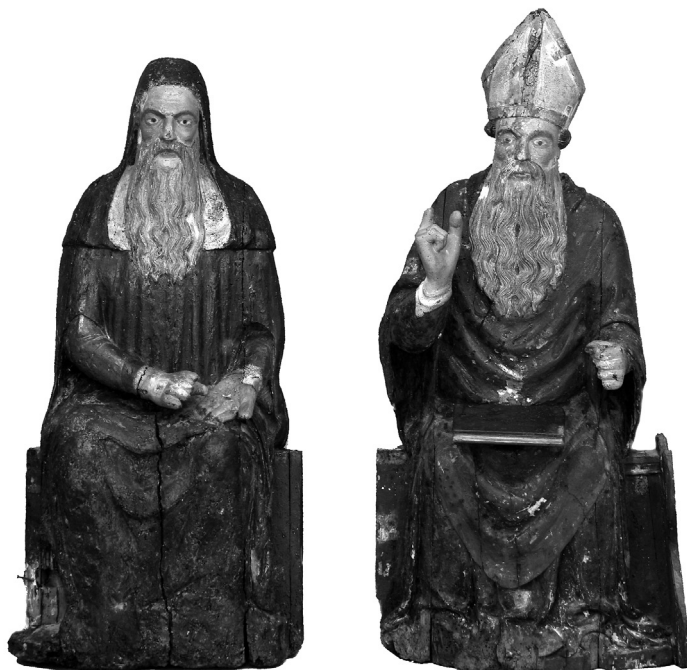
Skulpture sv. Jeronima i sv. Blaža, Cres, Creski muzej, izvorno iz kapele Sv. Blaža u zaseoku Sveti Blaž

Skulpture sv. Blaža (128 x 60 x 34 cm) i sv. Jeronima (119 x 56 x 30 cm) iz Creskog muzeja prenesene su u Cres iz kapele napuštenog zaseoka, odnosno pastirskog stana Sv. Blaž na zapadnoj obali sjevernog dijela otoka. Veleposjed je bio u vlasništvu creske općine, a spominje se od početka XVI. stoljeća. 34 Kapelu San Biagio della Mandria uzdržavala je istoimena bratovština. Bila je u funkciji do sredine XX. stoljeća, a do toga doba su i skulpture krasile glavni oltar. 35