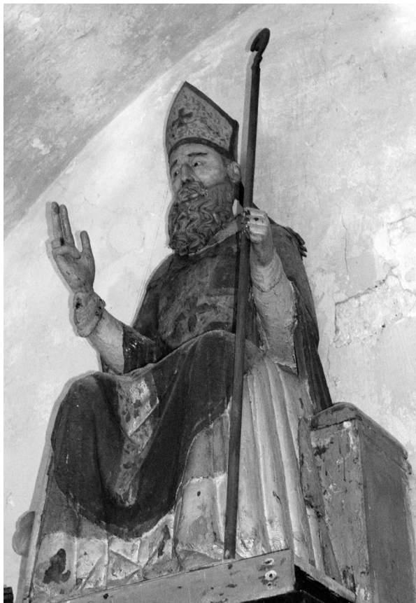
Skulptura sv. Gaudencija, Osor, kapela Sv. Gaudencija

katedrale i prije izgradnje nove. 9 Danas je skulptura izvan liturgijske funkcije, ali je zadržana u svetištu i postavljena iza kasnobaroknog mramornog oltara s oltarnom palom sv. Gaudencija iz XIX. stoljeća. 10