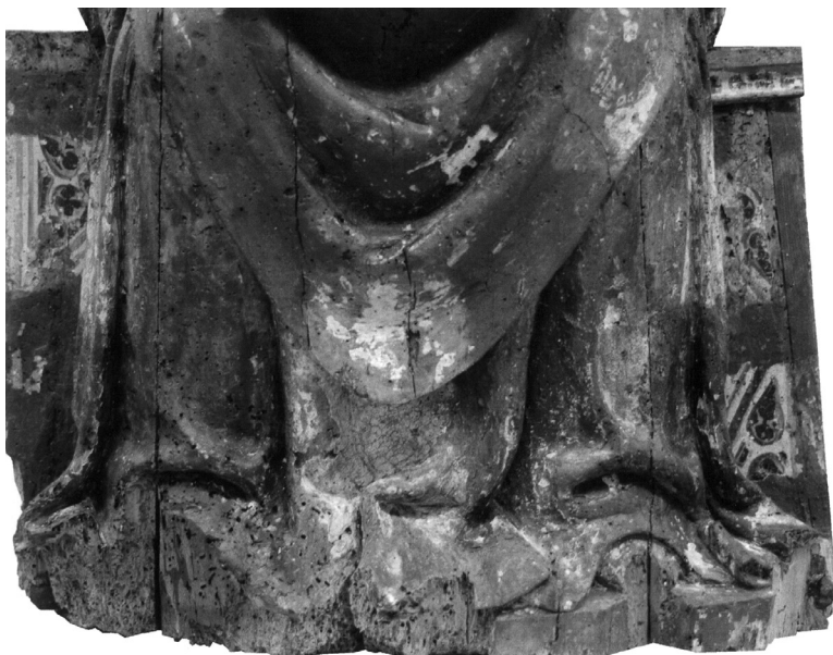
Skulptura sv. Blaža, Cres, Creski muzej, detalj donjeg dijela skulpture s oslikom sjedala

Iako ne mogu biti ocijenjene kao prvorazredno ostvarenje kasnogotičkog drvorezbarstva zbog određene skromnosti u oblikovanju volumena tijela i draperije te nerazrađenog oblikovanja ruku, skulpture sv. Blaža i sv. Jeronima kvalitetniji su drvorezbarski radovi od prethodno navedenih primjera iz Cresa, Osora i Martinšćice. Oblikovanje je korektno i skladno, a majstor je iskazao svoje umijeće prilikom razrade detalja lica, spuštenih kutova usana, markantnog širokog nosa, izraženih jagodičnih kostiju, razmaknutih krupnih očiju te naglašenih bora, podočnjaka i kapaka. Lica svetaca oblikovana su u naglašenijem reljefu portretnih odlika.