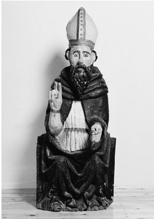
Skulptura sv. Antuna opata, Cres, Župni ured, izvorno iz kapele Sv. Antuna u Cresu

Takvoj vrsti skulpture rustičnih odlika, pripada i nešto manja skulptura sv. Antuna opata iz Cresa (115 x 46 x 30 cm). Danas u župnom uredu, izvorno je bila smještena u kapeli Sv. Antuna u Cresu, koja se u arhivskim dokumentima spominje od 1446. godine kao chiesa di Sant'Antonio in Borgo pod patronatom obitelji Petris Ercole. Kapela je zatvorena kultu 1958. godine radi ruševnosti krova te se počela koristiti za stanovanje. 14 U opisima kapele Sv. Antuna, prije njezine desakralizacije, uz kip sv. Antuna opata spominje se i drveni barokni oltar, veći broj slika te kipovi sv. Izidora i sv. Roka kao manje vrijedna skulptura, česta u otočkim kapelama. Godine 1949, B. Fučić navodi drveni lik sv. Nikole ili sv. Antuna opata u kapeli Sv. Antuna, no ne navodi njegov smještaj unutar kapele. Opisuje ga kao rustikalni, lokalni rad XV. ili XVI. stoljeća, vrlo trošan i oštećen. 15