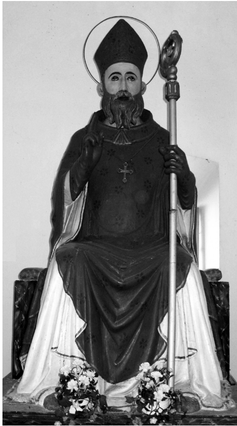
Skulptura sv. Izidora, Cres, Crkva Sv. Izidora

oltara je zabilježen u Inventaru kapela župe iz 1955. godine gdje se skulptura sv. Izidora spominje kao centralna figura oltarnog retabla: Altare di Sant'Isidoro – in pietra con intarsi di marmo; la parte superiore in legno stile rinascimento, dipinto a colori, pittura grezza data di recente che lo ha svalutato. Nella nicchia centrale la grande statua di S. Isidoro di legno di lauro, di cui la popolazione ritiene che la statua cresca continuamente. 7