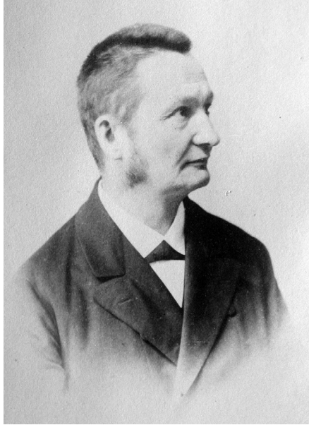
Portret Otta Benndorfa, Arheološki muzej Split, fotoalbum Arheološko-epigrafskog seminara.

je stoga preporučio sanacijske zahvate poput popravaka, zamjene dotrajalog materijala, podupiranja i sidrenja.