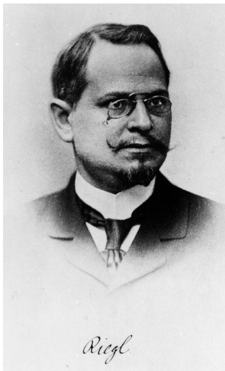
Portret Aloisa Riegla