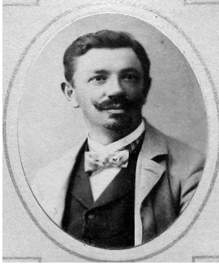
Portret Wilhelma Kubitscheka, Arheološki muzej Split, fotoalbum Arheološko-epigrafskog seminara

zervator I. odjeljenja. 35 U njegovu se tekstu ističe jedinstvenost Palače, ali i loši životni uvjeti unutar zidina.