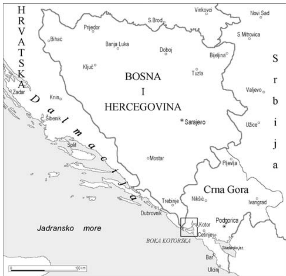
Sl. 1. Položaj Boka Kotorske na istočnoj obali Jadranskog mora Fig. 1 Position of the Boka Kotorska (Bay of Kotor) on the east coast of the Adriatic Sea

Zaljevi Boke Kotorske nastali su za vrijeme glacijacije riječnom erozijom u mekšim flišnim stijenama, dok su reljefno više strane zaljeva izgrađene od otpornijih stijena, pretežno trijaskih vapnenaca i dolomita. Kada se u postglacijalnom razdoblju površina mora podigla za oko 100 m, erozijom prethodno stvorene doline su potopljene i pretvorene u zaljeve. Reljef je dodatno modificiran djelovanjem krških procesa, a na višim padinama podno Orjena i djelovanjem ledenih jezika koji su se spuštali niz padine te planine. Istovremeno je Lovćen bio pokriven sniježnim pokrovom (Riđanović, J., 1990, 1993).