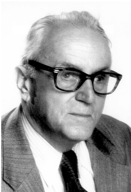
Dr. Antun Bonifačić. Punta na Krku 8. listopada 1901. - Chicago 24. travnja 1986.

pisom kojim su pisali Hrvati u domovini, 72 HR je obilježavala i predstavljala “konstruktivni kontinuitet hrvatske stoljetne nacionalne borbe za ostvarenje nezavisne države Hrvatske, za očuvanje ljudskih prava na polju hrvatske kulture, hrvatskog jezika i hrvatskog prisustva u Europi i u svijetu”. 73 Ona je upozoravala na probleme hrvatske političke emigracije, njezinu tamnu i za zapadni svijet neprihvatljivu stranu koja se izražavala terorističkim aktivnostima u Europi i Americi. U tim akcijama sudjelovao je njezin najekstremniji dio, mahom mladi ljudi “koji su odgojeni u socijalističkoj Jugoslaviji, a mnogi od njih su bili čak i članovi Saveza komunista Jugoslavije”. 74 Pokojni predsjednik Franjo Tuđman pokušao je opravdati takva stajališta i djelovanje, rekavši: “Povijesno gledajući, hrvatska emigracija, negirajući međunarodni poredak i Jugoslaviju u njemu, računajući s neriješenim blokovskim presizanjima i nagađanjima oko te Jugoslavije, samo je ekstreman izraz povijesnog