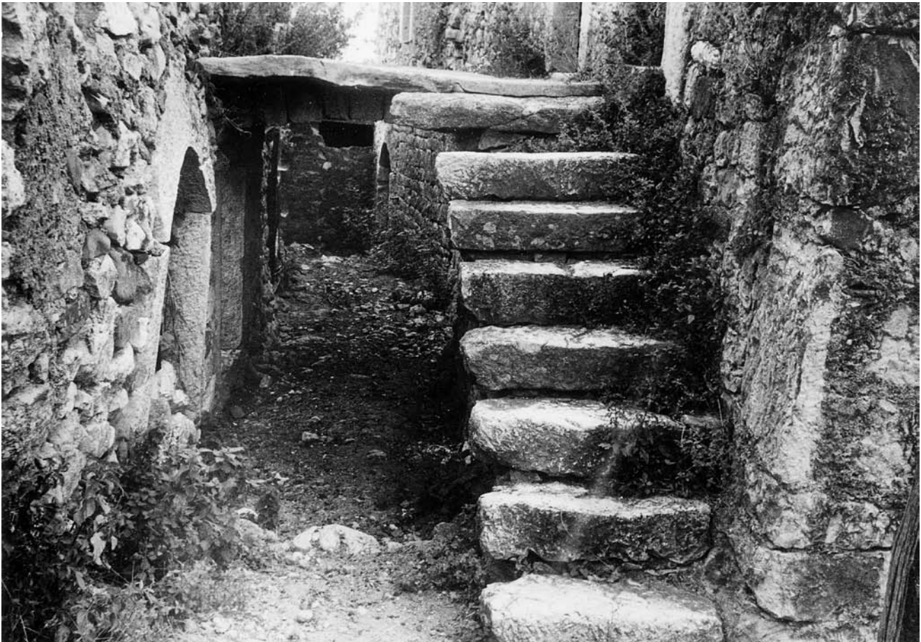
8. Karakteristični prolaz između kuća u istočnom dijelu Dolinjeg grada Characteristic passageway between houses in the eastern part of Dolinji Grad

Još niže prema sjeveru a osobito u istočnom dijelu Dolinjeg grada, preko urbanističke matrice, arhivske fotodokumentacije i tragova na terenu, možemo bolje pratiti karakterističnu morfologiju uličnih pravaca. Riječ je bila o pravocrtno nanizanim katnicama s jednom prostorijom u prizemlju i jednom na katu. Prizemlje u gospodarskoj funkciji često se dobrim dijelom oslanjalo na živu stijenu. Sučelice postavljena pročelja kuća, preko uskih prolaza koji su ih dijelili, često su bile povezana kontinuiranim, bačvasto svodenim premoštenjima opločenim škrlama (sl. 8). Do takvih su terasa vodila vanjska stubišta od monolitnih, grubo obrađenih kamenih greda. Koliko se može zapaziti iz arhivske