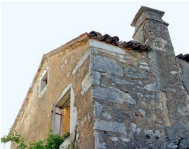
5. Ruševna kuća sjeveroistočno od župne crkve sa sekundarno uzidanom kamenom građom iz 16. st.

Dilapidated house to the south-east of the parish church with re-used sixteenth-century stone materials