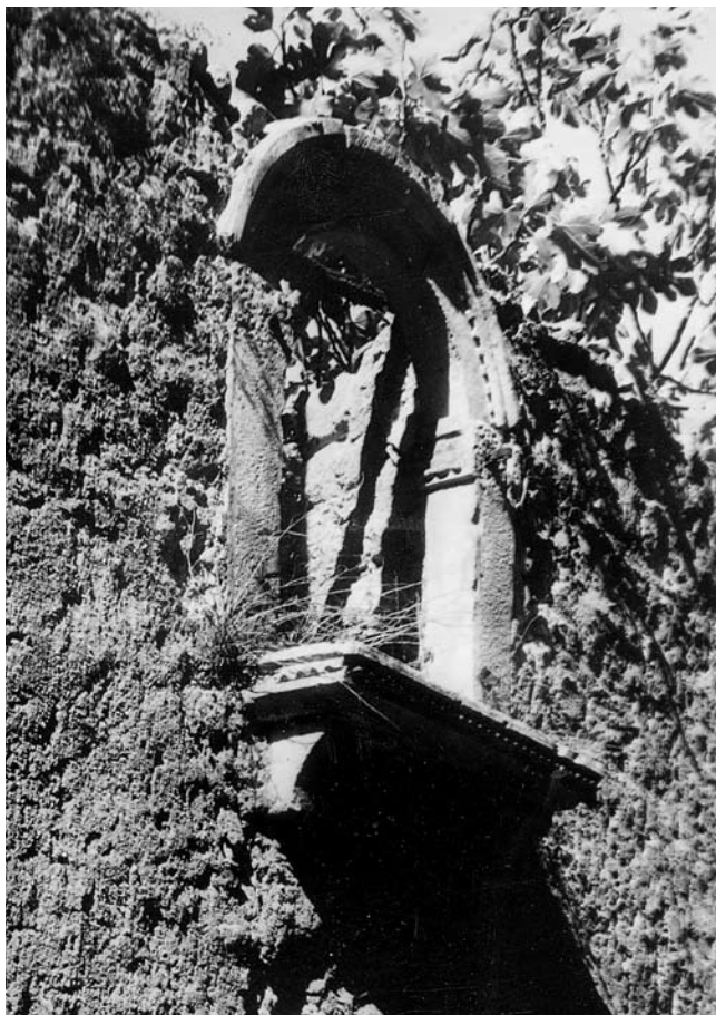
7. In situ dokumentirana renesansna monofora Dolinjeg grada, danas na kući u Gorinjem gradu (foto: S. Ulrich, fototeka Konzervatorskog odjela u Rijeci, 1962.)

Record of an in situ Renaissance single-light window opening in Dolinji Grad, today in a house in Gorinji Grad