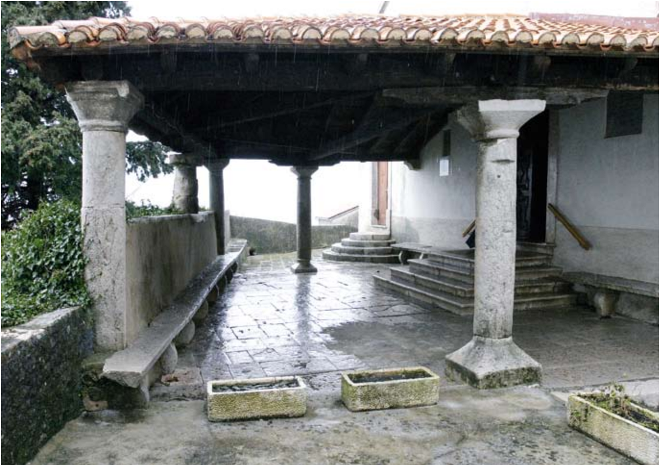
10. Cergan, trijem župne crkve sv. Stjepana

The Cergan porch of the parish church of St Stephen