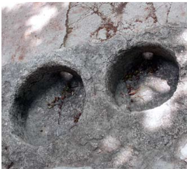
11. Javne mjere na Placi