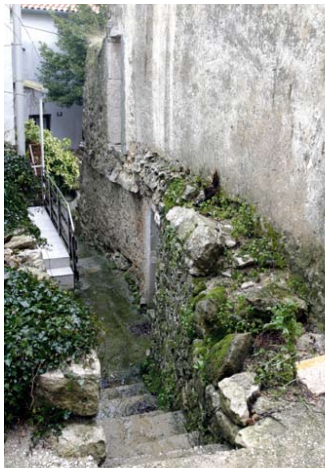
4. Ostatak karakterističnog uskog, svodnog prolaza u stambenom bloku sjeverno od svetišta župne crkve

položenim uz donji tok spomenute vinodolske rječice (sl. 1). 14 Postanak srednjovjekovnoga Dobrinja vjerojatno je dobrim dijelom morala obilježiti upravo markantna pozicija s naglaskom na vizualnoj kontroli zaljeva Soline i dijela Vinodolskog kanala, iako je bio udaljeniji od mora u odnosu na druge krčke kaštele. Uz eksploataciju obližnjega polja i šuma koje su ga okruživale, te kontrolu šireg agrarnog područja s nizom povijesnih sela, 15 jedan od temelja njegove gospodarske podloge morale su predstavljati kneževske solane, spominjane u izvorima u vrijeme Frankopana, osobito u kontekstu razgraničenja dobrinjskoga od omišaljskoga područja. 16 O dinamici kolonizacije priobalnog područja uokolo zaljeva Soline svjedoče i toponomastička istraživanja. U njima je uočena snažna prisutnost romanskih toponima koji se povezuju uz doseljenje vlašskog stanovništva, koje su „Frankopani angažirali za rad na solanama”. 17 Značajan je i podatak iz 1461. godine, kada se u mletačkom Senatu raspravljalo o isporuci pet stotina mjera soli