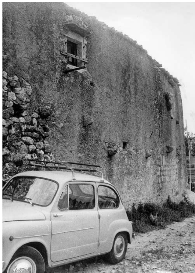
9. „Kaštel” na istočnom rubu Dolinjeg grada

Južno od župne crkve sačuvano je sjećanje na crkvu Sv. Lovre, smještenu pokraj južnog zida župne crkve Sv. Stjepana, mada na kući koja se danas ondje nalazi nema tragova takvoga zdanja. 44 U istom se sklopu nalazi „kaptul” - nekadanje sjedište dobrinjskoga seoskog kaptola u kojem se nalazio i desetinec, prostorija za čuvanje crkvene desetine, kakvu su imali svi krčki kašteli. Zgrada je u novije vrijeme potpuno pregrađena a i danas je u crkvenom posjedu. 45 Još južnije položena su dva stambena bloka čije kuće nose karakteristike kasnog 19. i početka 20. stoljeća, no u njihovim su supstrukcijama mjestimično sačuvani tragovi dosta rustično klesanih renesansnih otvora, uključivši i karakteristične „otvore na koljeno.” Postanak ovoga, već rubnoga dijela Dolinjeg grada, može se pripisati razdoblju renesanse. Njegovu osnovu čine upravo spomenuti blokovi, s istoka okomito položeni na Placu. Njima sučelice, ulicu koja vodi do zapadnog pročelja župne crkve, čini još jedan niz znatnije pregrađenih kuća kod kojih možemo