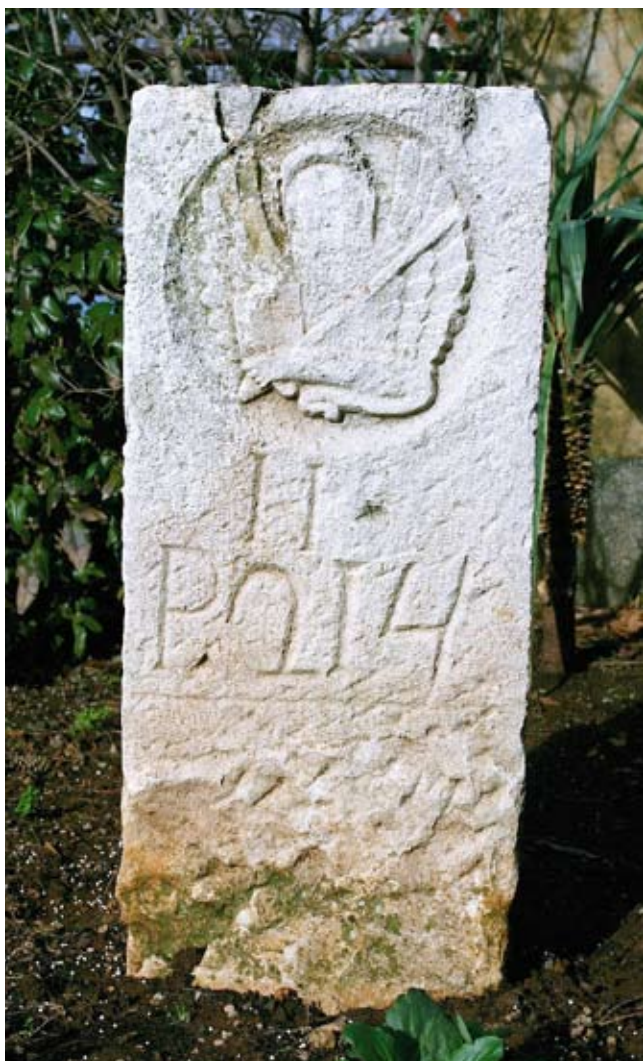
2. Šumski graničnik iz mletačkog razdoblja nađen na području Dobrinjštine

bio dodatno naglašen izgradnjom frankopanskoga kaštela neposredno nadomak samoga naselja, čime je ujedno napuštena ranija kneževska fortifikacija, koja se u razdoblju razvijenoga srednjeg vijeka na antičkoj podlozi razvijala na susjednoj uzvisini, danas poznatoj kao Fortičina. Na području Vrbnika, za razliku od uobičajenih pojednostavljenja, raspoznajemo barem tri težišta naseljenosti: ono u pretpovijesti vrlo dominantno na brdu Kostrij, sjeveroistočno od današnjega naselja; kasnoantičko na uzvisini Sv. Mavar, koja nad Vrbnikom dominira s juga; te zaključno, ono na kojem je obzidano naselje razvijenih urbanih karakteristika, na zasad nam nepoznatoj podlozi, napredovalo u razvijenom srednjem vijeku. 8 I ondje u kasnom srednjem vijeku zamire usamljena, nekoć matična, kneževska fortifikacija