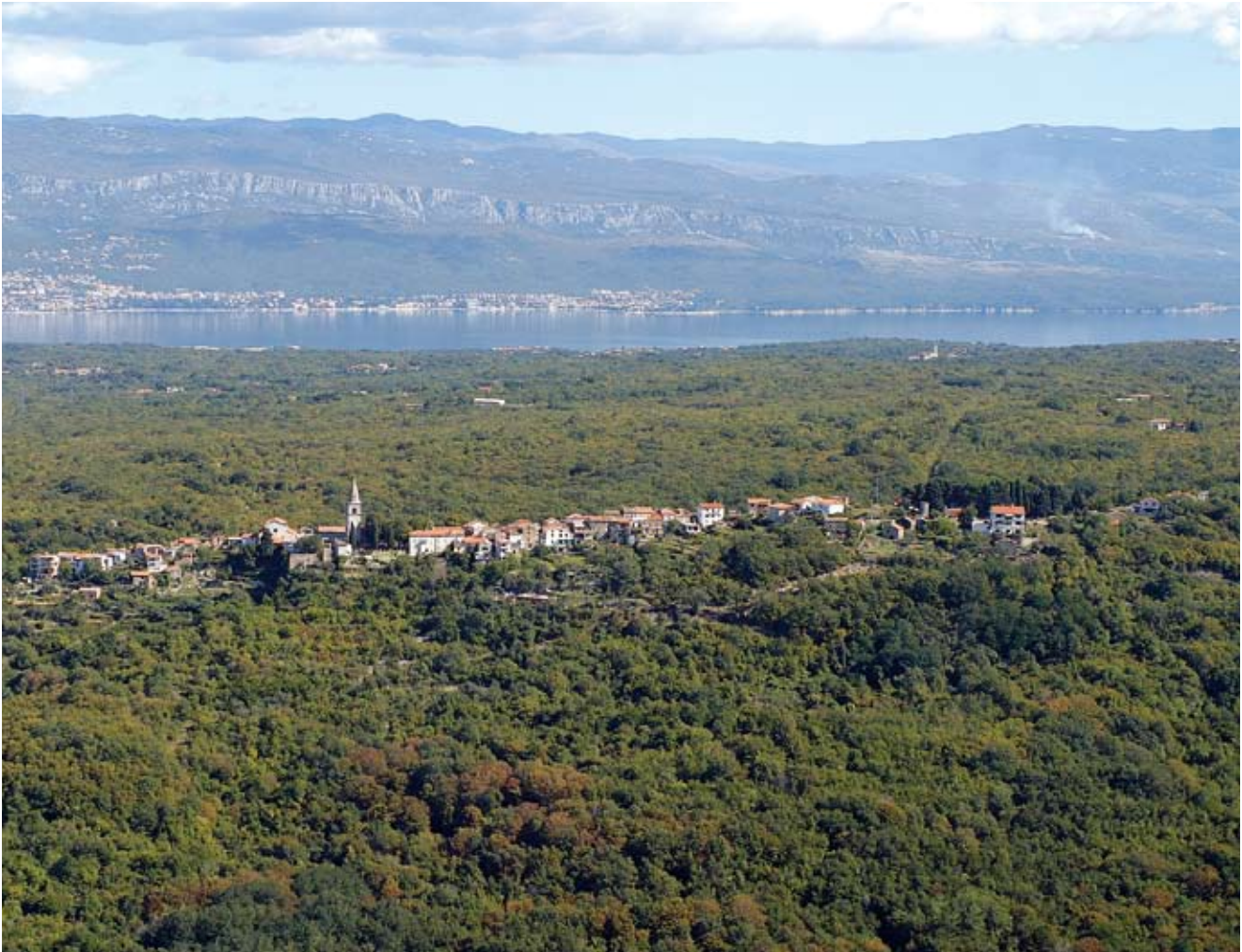
1. Pogled na Dobrinj sa zapada, u pozadini je Šilo, kao pandan vinodolskoj luci na ušću Dubračine, preko kanala je današnje crikveničko područje

View of Dobrinj from the west, in the background is Šilo, a counterpart of the Vinodol port on the mouth of Dubračina, across the channel is the present-day Crikvenica area