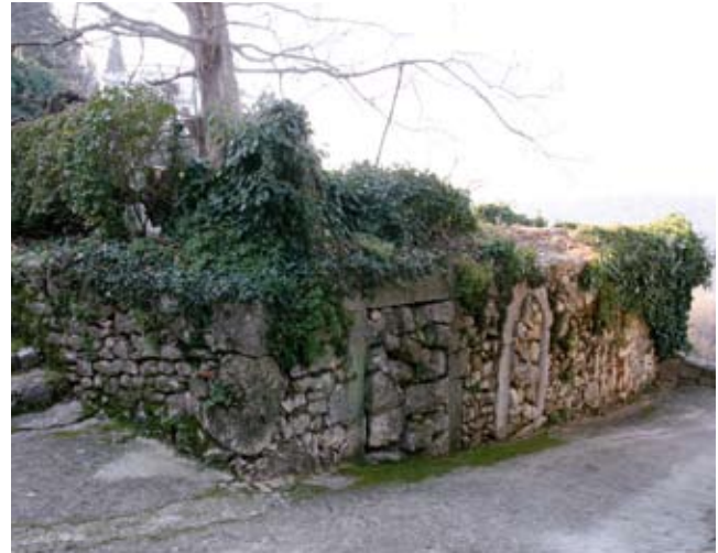
6. Ostaci većeg stambenog sklopa na Plokatu, podno trijema župne crkve

Dobrinj se u pisanim vrelima spominje u 12. stoljeću. 25 Šimunović naselje s okruženjem proglašava „najglavnijim punktom starohrvatske toponimije” na otoku Krku, pretpostavljajući da njegovo ime dolazi od osobnog imena Dobrina. 26 Slično nalazimo i kod Skoka: „Dobrinj je pridjev od starog imena od mila, od Dobroslav,” 27 te Jelenovića koji se toponimijom Dobrinjštine najdetaljnije bavio, a koji piše da mu je