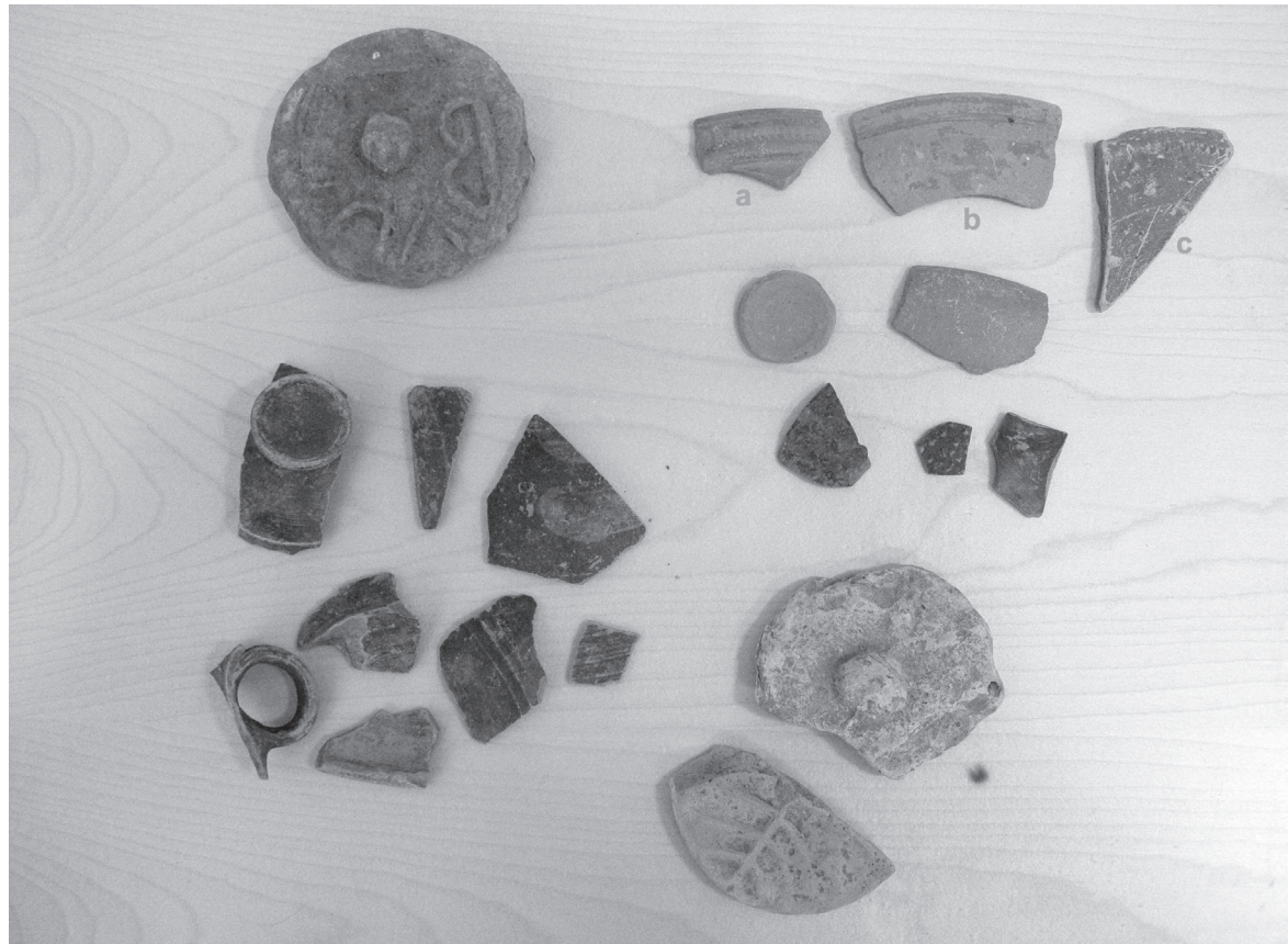
Slika 3. Keramika s lokaliteta Dobruške glavice

su otprilike 90 cm visine i oko 35 cm široke u predjelu trbuha, približno isto kao i amfore iz Komina. Međutim mlađa faza Grčko-italskih amfora i dalje ima duži vrat i otprilike razmjeran dužini tijela amfore, što nije slučaj kod amfora iz Komina 20 .