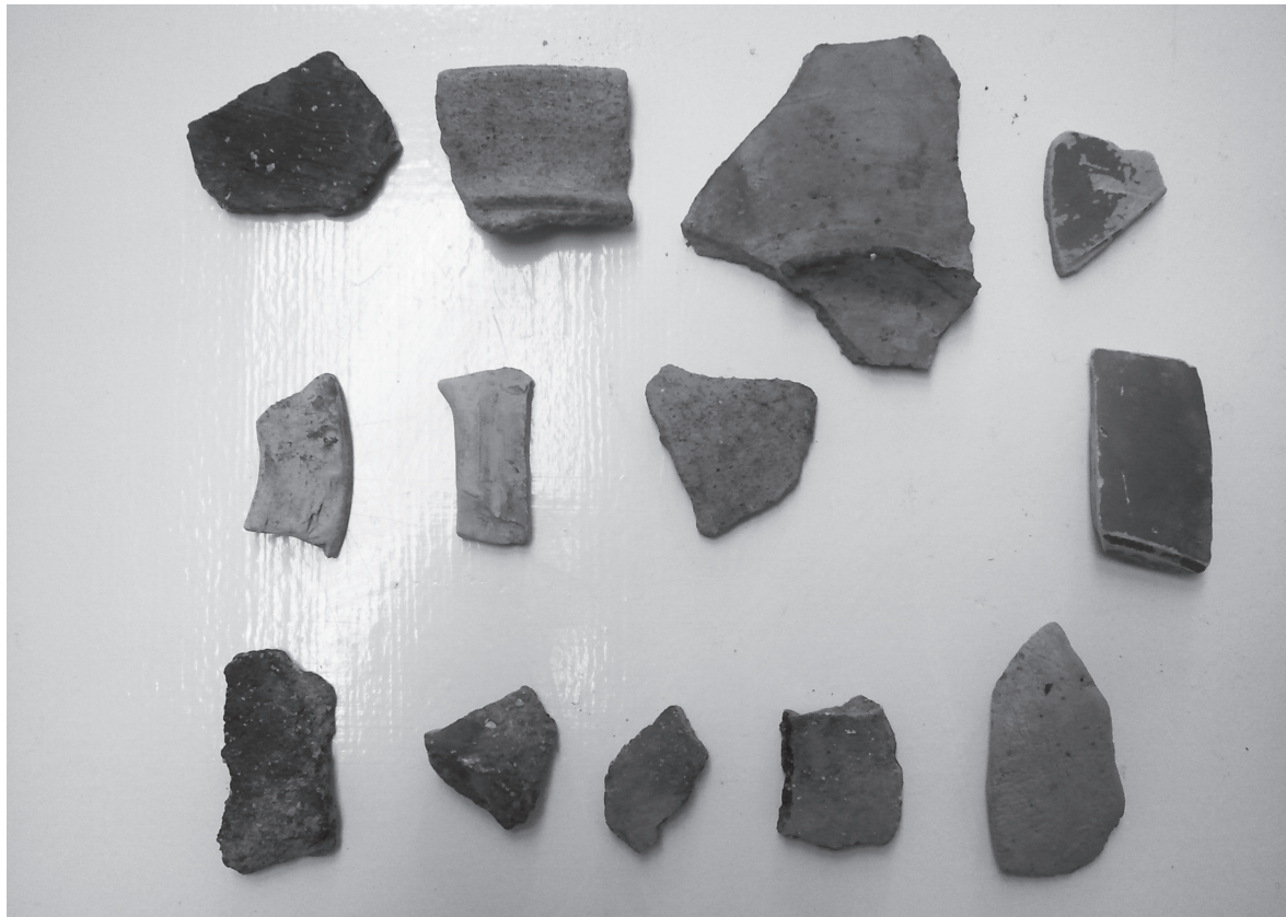
Slika 6. Keramika prikupljena na lokalitetu Vlaka

Dressel 6A amfore proizvode se od polovice 1. st. pr. Kr do otprilike polovice 1. st. Distribuirane su na području Italije, Hrvatske, Francuske, Velike Britanije, sjeverne Afrike, Slovenije, Austrije, Panonske nizine i Grčke. U njima se također prevozilo vino i maslinovo ulje.