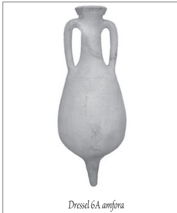
Dressel 6A amfora