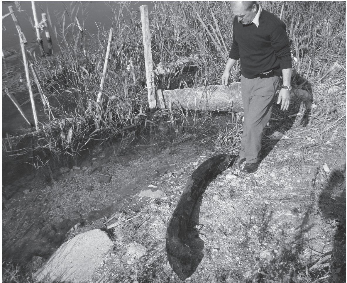
Slike 8. i 9. Obradeno drvo neposredno nakon vađenja iz mulja