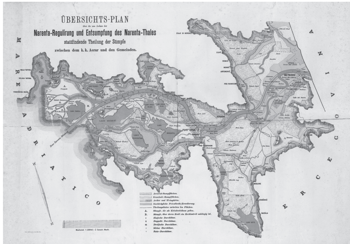
Karta 1. Austrijska karta doline rijeke Neretve, HR DAZD 383, Kartografska zbirka, br. 53/26

pomorske veze sa susjednim područjima, posebno s talijanskom obalom. Ta veza je išla linijom otoka Hvar – Palagruža – Tremeiti – Gargano, kao najjednostavnija i u ono vrijeme najsigurnija izravna ruta prema susjednoj obali 1 . Ovom rutom odvijala se robna razmjena već od vremena ranijeg neolitika, što se vidi i po keramici koja je istih karakteristika na obje obale. Ovo potkrepljuje i kamena sjekira kampsinijskog tipa iz Grapčeve spilje na Hvaru, koja je česti artefakt na poluotoku Gargano u Italiji, pa se vrlo vjerojatno radi o uvozu 2 . Kasnije se u neolitiku ova razmjena s obale širi na unutrašnjost Balkana i to dolinom Neretve i dalje kroz unutrašnjost uz rijeku Bosnu do područja Starčevačke kulture u središnjoj Bosni. Ovo je vidljivo po keramici koja je bila monokromna i ukrašavana tehnikom a tremolo i po školjci Spondylus , koje su pronađene na ovom području. U kasnom neolitiku najvažnija trgovina odvijala se dolinom Neretve prema unutrašnjosti, s butmirskom i dalje vinčanskom i sopotskom kulturom 3 .