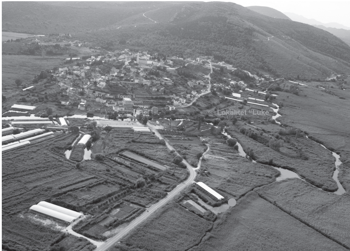
Slika 7. Zračni snimak Vida sa označenim lokalitetima