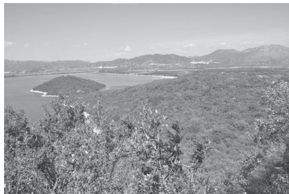
Slika 1. Pogled s istoka na otočić Osinj