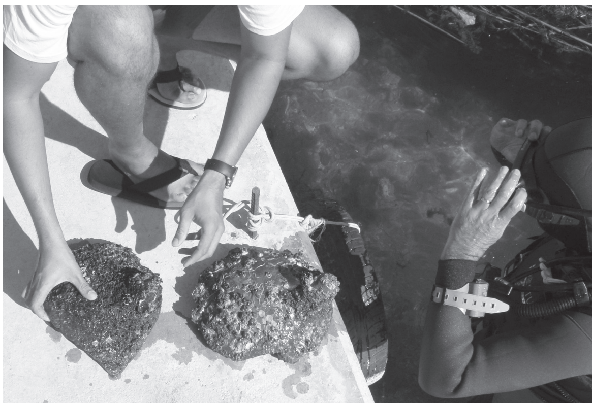
Slika 5. Ostaci amfora u trenutku vađenja iz Neretve

moglo jasno utvrditi o kolikoj se površini radi. Prema izvađenim dijelovima, vidljivo je da se radi o amforama koje imaju malenu nožicu i veće, odnosno „vrecasto“ oblikovano tijelo. Budući da se radi samo o fragmentima amfora, teško je reći jesu li Lamboglia 2 ili Dressel 6A amfore 21 . Naime, obje vrste amfora imaju slično tijelo u obliku vrece, s debljim stijenkama i kratku malu nožicu u obliku šiljka. Lamboglia 2 amfore javljaju se od 2. st. pr.