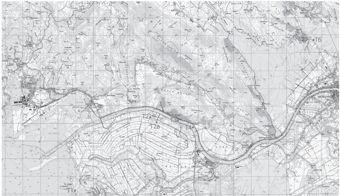
Karta 3. Topografska karta ušća i doline rijeke Neretve s označenim lokalitetima

Rimsko brodovlje krenulo je dalje prema sjeveru do Isse , kako bi protjerali Ilire koji su ga zaposjeli. S Demetrijem Farskim, Rimljani su u tome uspjeli, a ilirski (ardijejski) napadači su se raspršili i pobjegli u Arbon , Narbon , odnosno, u Naronu , kako donosi Polibije 10 .