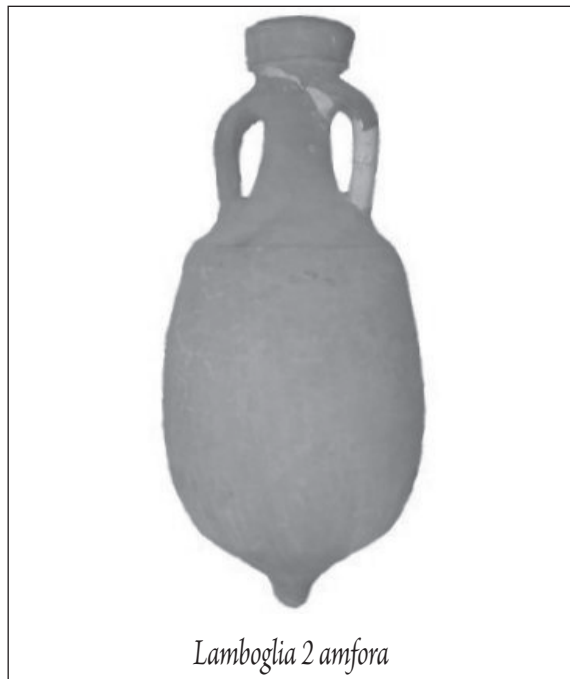
Lamboglia 2 amfora