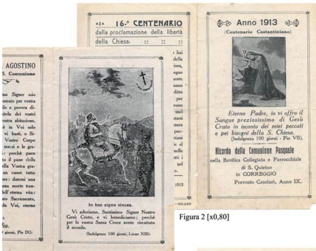
Figura 2 [x0,80]