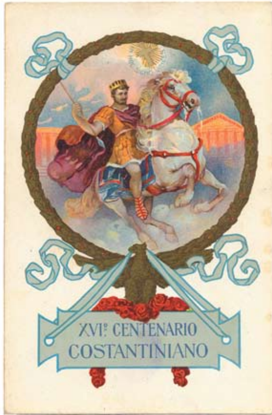
Figura 4 [x0,80]