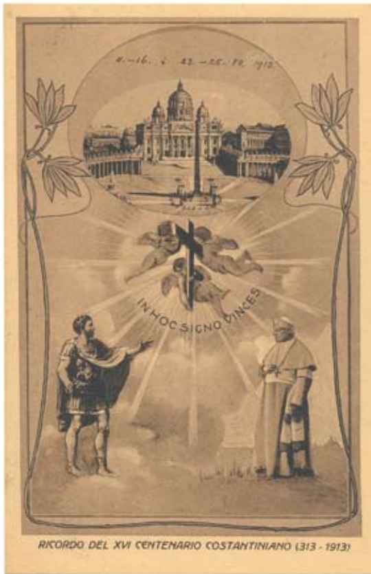
Figura 1 [x0,80]