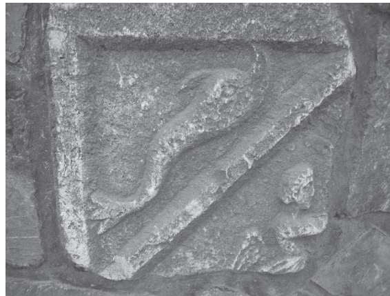
Slika 8 Theranda, dio reljefa s prikazom dupina uzidan u ogradni zid

dijelu provincije, u okolici Therande, blizu jedne rječice, nađen je spomenik na kojemu je u reljefu prikaz dupina.