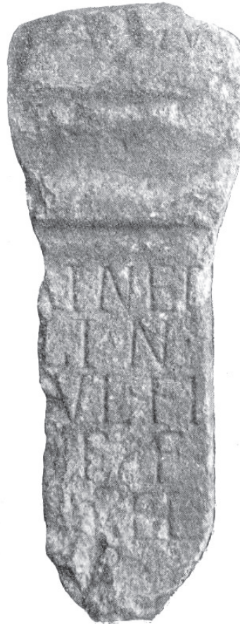
Slika 2 Stela iz Naisusa na kojoj se spominje disce(n)s epibeta