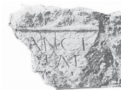
Slika 7 Dio spomenika posvećenog božici Siriji nađen u Skoplju

S druge strane, u srednjim i južnim dijelovima provincije, gdje nema velikih rijeka i jezera, premda nije bilo prirodnih uvjeta za plovidbu, nađeni su dokazi štovanja rimskih (Neptun) i istočnih (Izida, Serapis, Atargatis) božanstava, božanstava oceana, mora i vodâ i to uz rijeke Ibar, Drin, Vardar i Tresku. U južnomu