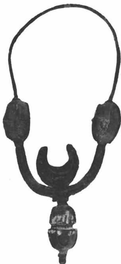
Sl. 7. Naušnica iz Knina. Muzej hrvatskih starina u Splitu. Foto: Viktor Živić o. 1935. g.