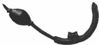
Sl. 6. Ulomak naušnice nađen u Kupu u Sisku. Originalna veličina. Zbirka Mateja Pavletića u Zagrebu. Foto: Jakov Pavletić 1952. g. Fototeka Konzervatorskog zavoda u Zagrebu br. 9649a.