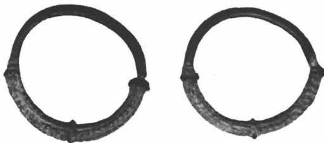
Sl. 8. Naušnice t. zv. naroskanog tipa iz Siska. Originalna veličina. Zbirka Mateja Pavletića u Zagrebu. Foto: Vlado Bradač 1953. g. Fototeka Konzervatorskog zavoda u Zagrebu br. 11.113.