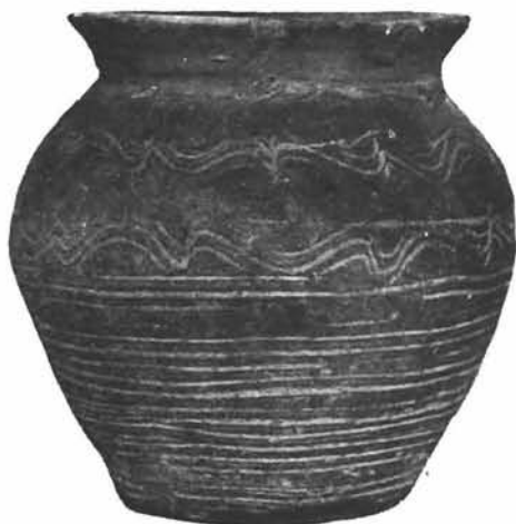
Sl. 11. Zemljana posuda iz Siska. (Umanjeno). Arheološki muzej Zagreb. Foto: Jakov Pavelić 1946. g. Fototeka Konzervatorskog zavoda u Zagrebu br. 6303a.