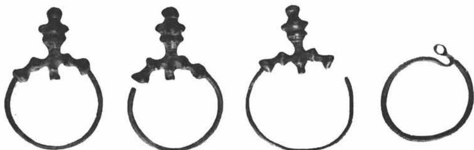
Sl. 5. Nalaz iz 1941. g. iz Stillerova vrta u Sisku. Originalna veličina. Zbirka Mateja Pavletiću, Zagreb. Foto: Jakov Pavelić 1952. g. Fototeka Konzervatorskog zavoda u Zagrebu br. 9649.