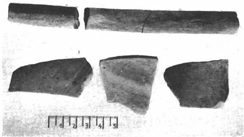
Sl. 12. Glineni predmeti nađeni pri nalazu naušnica 1941. g. (Nesigurne okolnosti). Zbirka Mateja Pavletića, Zagreb, Foto: Jakov Pavelić 1952. g. Fototeka Konzerva- torskog zavoda u Zagrebu br. 9650.