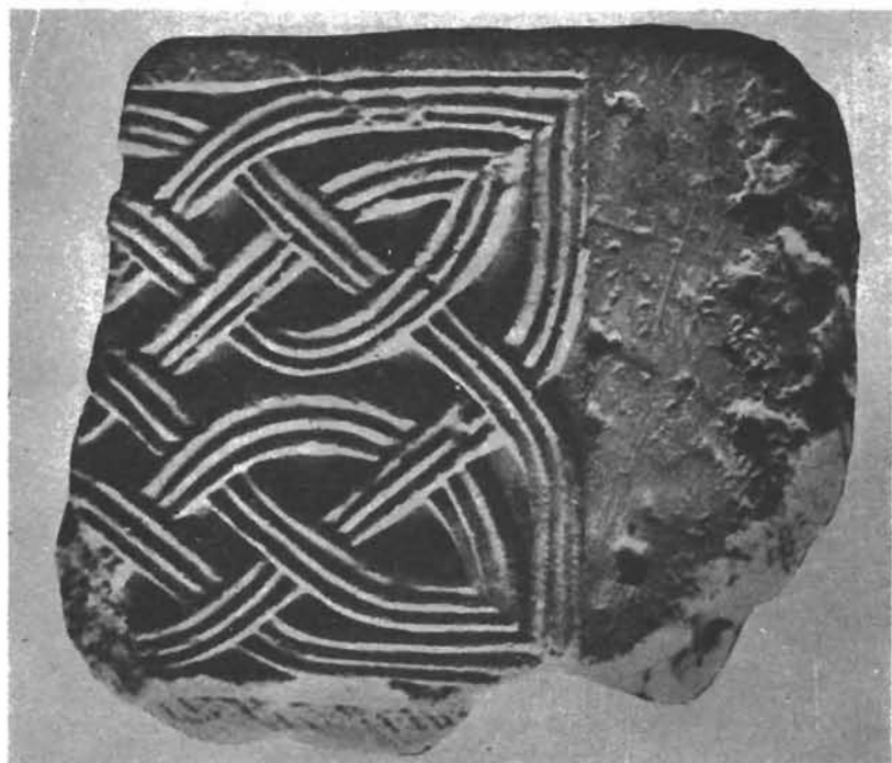
Sl. 3. Ulomak kamenog pluteja iz Siska iz 9. ili 10. st. U Arheološkome muzeju u Zagrebu (Brunšmidov broj 805).