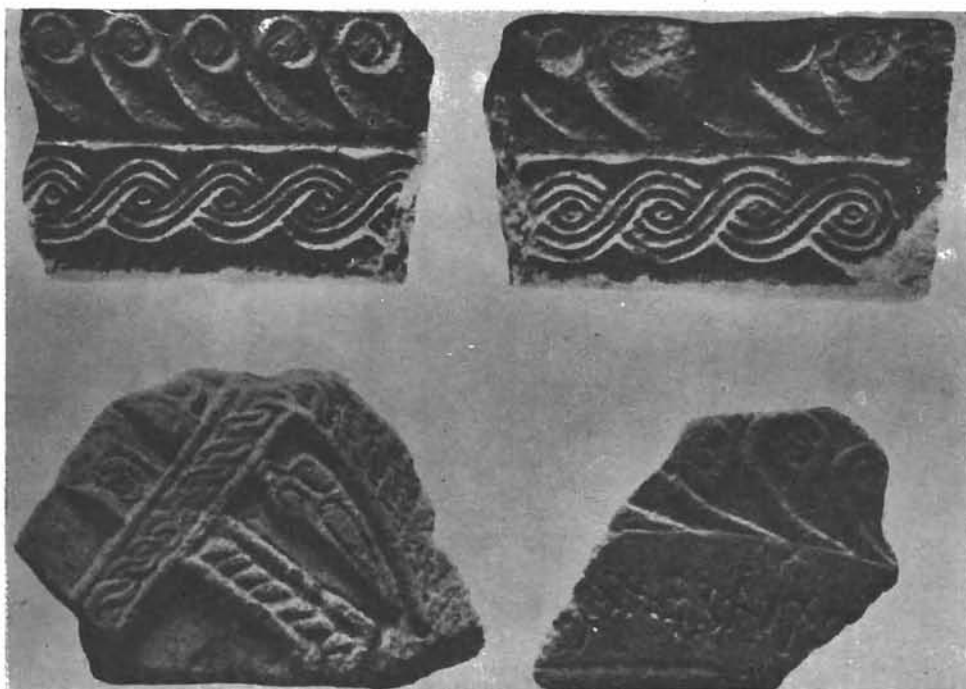
Sl. 2. Četiri kamena ulomka, za koje se drži da su iz Siska, ali nije sigurno. Postoji veća vjerojatnost, da su gornja dva iz Siska (Brunšmidovi brojevi 792 i 793), negoli dva donja (Brunšmidovi brojevi 806 i 791). Arheološki muzej u Zagrebu. Foto: Brunšmid o. 1912. g.