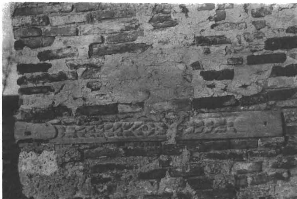
Sl. 1. Rimska kamena greda uzidana kao građevni materijal u staju sisačkoga grada, koji je građen u 16. st. Upropaštena pri uklanjanju ruševina nakon bombardiranja grada 1945. g. Foto: Gjuro Szabo 1916. g. Fototeka Konzervatorskog zavoda u Zagrebu br. 6338.