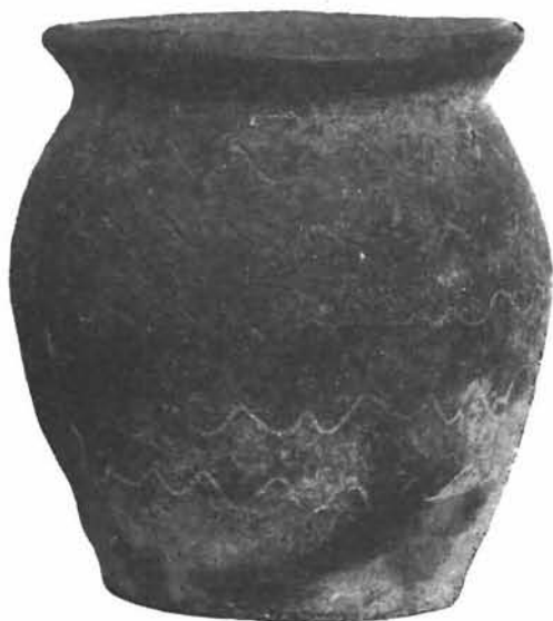
Sl. 10. Zemljana posuda iz Siska. (Umanjeno). Arheološki muzej Zagreb. Foto: Jakov Pavelić 1946. g. Fototeka Konzervatorskog zavoda br. 6303.