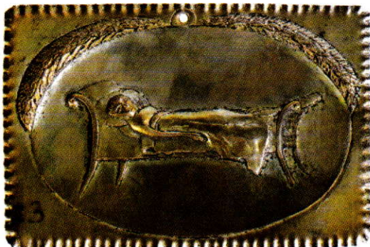
Motiv bolesnika, srebro, Marija Bistrica, oko 1800. Riznica zagrebačke katedrale.

policama punima vještichih rekvizita. Tu je namjera autorica bila pokazati vještichju djelatnost bajkovito, a ujedno i edukativno, kako bi se djeca poučila i o dobrim stranama žena koje su znale spravljati ljekovite pripravke.