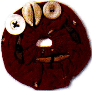
Hamajlija, na rozeti od crvene svile prišivena su tri komadića tisovine, kauri pužić (Cypraea moneta) i dva sedefasta puceta. Nosio ju je ušivenu u odjeću protiv uroka dječak star tri mjeseca, Abdija R. iz sela Turije kraj Bihaća, početak 20. stoljeća. EMZ, inv. br. 13730. Snimio Vid Barac.

Vitrine koje prikazuju odnos prema majci i djetetu svojim ovalnim oblikom simboliziraju zagrljaj i zaštitu majčinih ruku oko djeteta, donoseći niz dragocjenih sitnih predmeta od srebra i dragog kamenja koji štite djevojku, mladenku, trudnu ženu, majku i dijete od zla oka i uroka. Vitrine na sredini povezuje plahta bogato ukrašena crvenim vezom kao aptropejskom bojom, iza koje se naziru obrisi djeteta koje se rađa, kako se u stvarnosti događalo u mnogim krajevima Hrvatske do polovice 20. stoljeća, kad je žena ostajala "za plahtami" nakon porođaja još 40 dana.