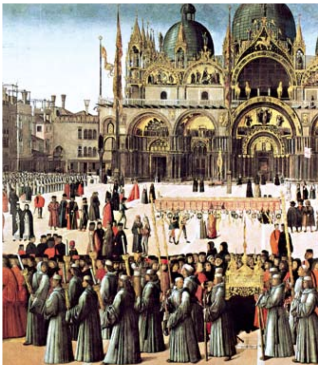
9. Gentile Bellini, Procesija na Trgu Sv. Marka, detalj s Križem pod baldahinom (izvor: VALCANOVER, F., 1995., 98)

Gentile Bellini, Miracolo della Croce caduta nel canale di San Lorenzo, Andrea Vendramin col reliquiario della Croce