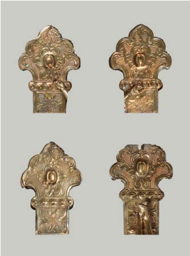
3. Barokne lamele s dubrovačkog Raspeća Lamiere sbalzate seicentesche dalla croce ragusea

masivne konzole obočuju edikule s bogatim gotičkim dvostrukim biforama pod zabatima pred kojima je postavljen po jedan lijevani sićušni svetački lik. Iste su edikule i u gornjem katu nodusa, no s vrlo elegantnim fijalama, pa je konstrukcija u cjelini umjerenija. Izvornom križu pripadaju sve figure na raspelu, mali lik Sv. Frane na reversu te korpus Krista s tugujućim parom Marije i Ivana koji su u punoj plastici montirani na zasebnim konzolama, a postavljeni bočno i nešto niže od Raspetoga. Razvidno je iz opisa da je većina ključnih elemenata od kojih je sastavljeno ovo srebrno Raspeće sačuvana u izvornom obliku, a da su oštećeni bili tek krakovi samog križa. Barokne su pritom samo metalne lamele ovih krakova, dok je srebrni okvir na obodu u koji su umetnute sačuvan u izvornom obliku. Upravo ta činjenica potiče me da još jednom proučim sudbinu ovog Raspeća te pokrenem pitanja koja se odnose na izvorni izgled dijelova zamijenjenih poslije potresa. Stanje sačuvanosti izvornih dijelova svjedoči da su oštećenja morala biti neznatna. Posebno je uočljivo kako barokne lamele ne leže u okviru savršeno precizno. Naime, okvir je po cijeloj svojoj nutarnjoj strani, i to