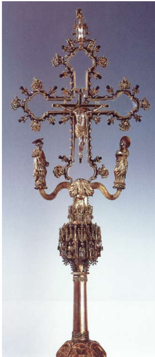
6. Križ u Scuoli di San Giorgio degli Schiavoni La croce nella Scuola di San Giorgio degli Schiavoni

Postaje tako razvidno da su se zastupnici dubrovačkih franjevaca, skrbeći se o relikviji Sv. Križa, obratili majstoru koji može imitirati čuveni uzorak, a koji su i oni sami vjerojatno poznavali, barem po čuvenju.