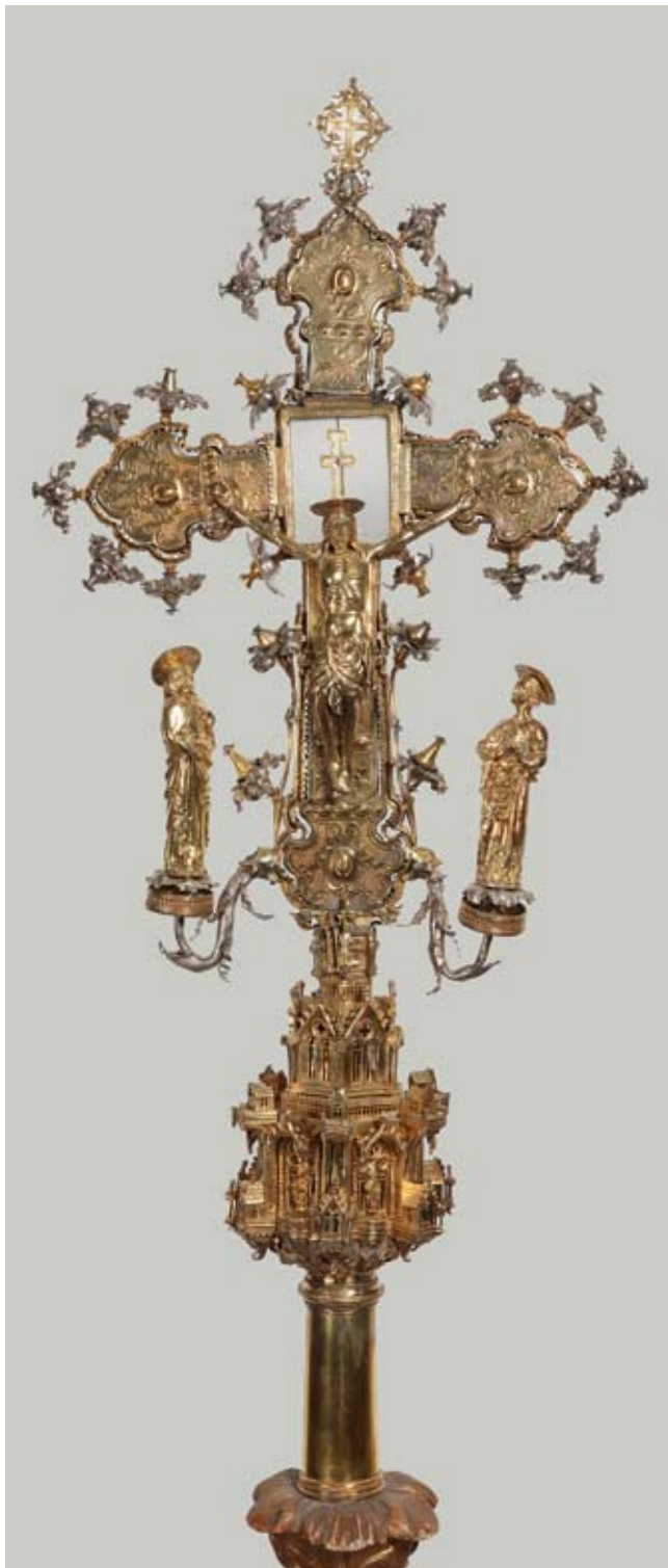
1. Raspeće u Dubrovniku, postojeće stanje - avers La croce a Ragusa, stato attuale - obverse

konzolama, te Sv. Frane i Kristov korpus na križu. Sastavni je dio umjetnine iz 15. stoljeća i srebrni okvir oboda križa, zajedno sa svim razlistanim cvjetićima na