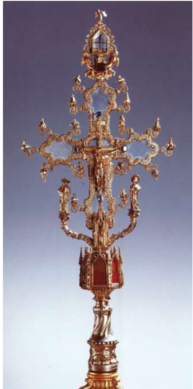
4. Križ u Scuola Grande di San Giovanni Ev. La croce dalla Scuola Grande di San Giovanni Evangelista

na oba lica, providen gusto raspoređenim pravokutnim dentikulima koji su nekoć pridržavali izvorne uloške. Nove barokne lamele ne upadaju dovoljno precizno u ta ležišta, pa ih dentikuli i ne drže, čime njihova uloga postaje posve bespredmetnom. Razvidno je stoga da su ulošci koje su dentikuli pridržavali nestali, a mogli su biti izrađeni samo od brušenog gorskog kristala (kvarc, SiO 2 ) koji nam je na ovom Raspeću u jednom detalju i sačuvan tek kao theca .