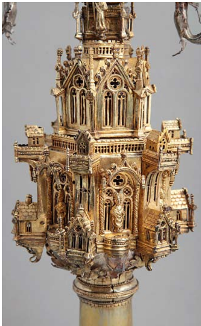
2. Raspeće u Dubrovniku - kaštilac La croce a Ragusa - nodo

Raspeće je montirano na šuplji cilindričan nosač koji služi da ga se natakne na motku. Krakovi križa sastaju se u kristalnoj theci u kojoj se čuva ulomak drva Svetog Križa na kojem je Krist bio raspet. Pravokutna je theca okovana u srebrni okvir u koji se usađuju krakovi križa. To je složena i vrlo osjetljiva konstrukcija tako da je križ prilično raskliman. Krakovi križa sapeti su po obodu srebrnim okvirom, a završavaju tipičnim gotičkim obrisom u obliku peterolista. Izvoran je na ovom križu nodus u obliku dvokatnog, vrlo bogatog kaštilca. U donjem katu je širi i bogatiji, šesterostran i podijeljen arhitektonski riješenim vrlo istaknutim konzolama s kućicama pokrivenim dvostrešnim krovčićima. Te