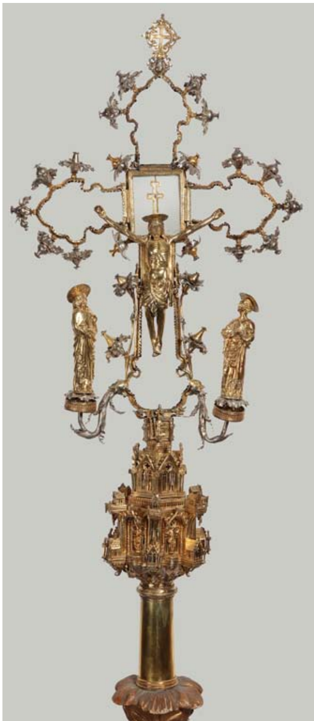
5. Raspeće u Dubrovniku, rekonstrukcija izvornog izgleda La croce a Ragusa, ricostruzione dell'aspetto originario

Tanki srebrni okvir oboda po kojem su raspoređeni cvjetići s pupoljcima plodova kakav zapažamo na dubrovačkom Raspeću, karakterističan je upravo za jednu seriju križeva-relikvijara i Raspeća napravljenih