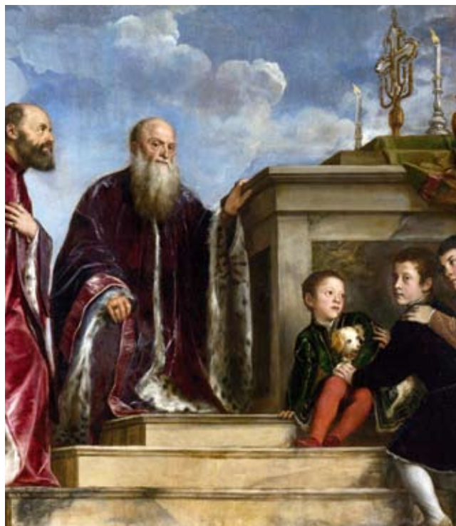
10. Tizian, Obitelj Vendramin pred relikvijarom Svetog Križa, detalj

Gentile Bellini, Processione della Croce in Piazza di San Marco, particolare con la Croce sotto il baldachino