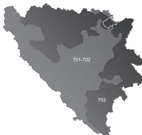
Karta 1. Izborne jedinice na izborima za Predsjedništvo BiH

U Predsjedništvo BiH biraju se tri člana: jedan Bošnjak i jedan Hrvat u istoj izbornoj jedinici (Federacija BiH: 701-702) i jedan Srbin u posebnoj izbornoj jedinici (Republika Srpska: 703). Prema članku 8.1 Izbornog zakona BiH "birač upisan u Središnji birački popis ... u Federaciji Bosne i Hercegovine može glasovati ili za Bošnjaka ili za Hrvata, ali ne za oboje", a "izabran je bošnjački i hrvatski kandidat koji dobije najveći broj glasova među kandidatima iz istog konstitutivnog naroda."