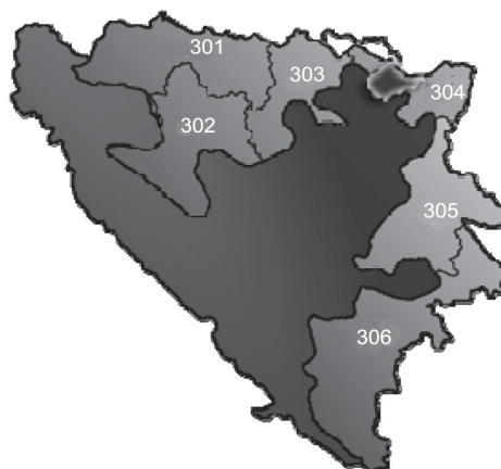
Karta 4. Izborne jedinice na izborima za Narodnu skupštinu Republike Srpske