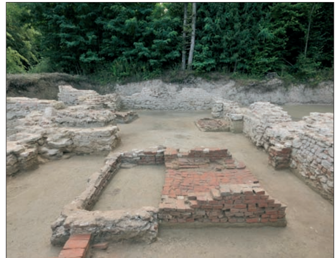
Sl. 4 Pogled s istoka na istražene zidane grobnice ZG 3 i 4 u četvrtom traveju lađe samostanske crkve (snimio: J. Kliska 2011.)

Exception amongst the examined graves in the nave of the monastery church is grave 071 (G 71, average h – 152.97