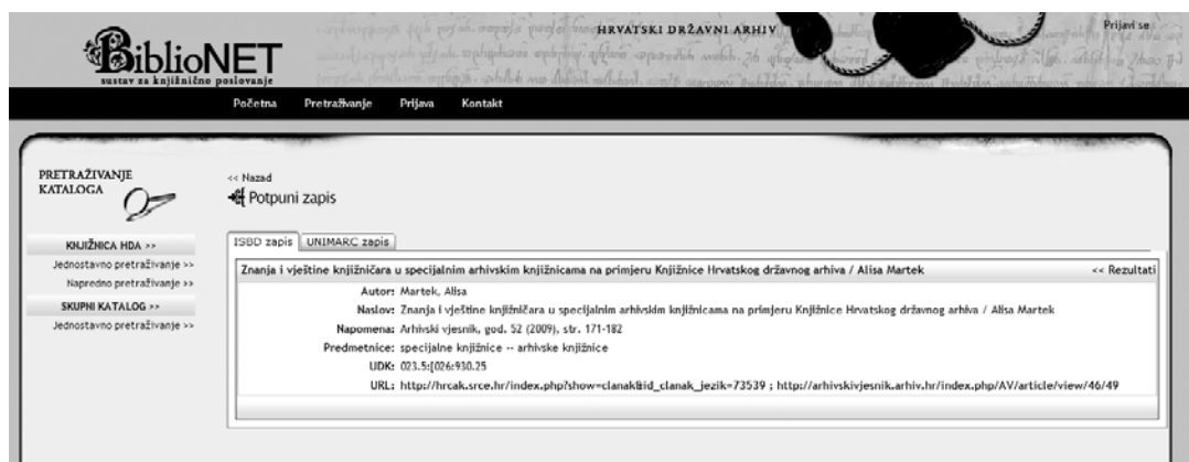
Slika 1. ISBD zapis u BiblioNET-u i prikaz poveznice na članak na portalu Hrčak.

Knjižnica HDA je povezala članke dostupne u otvorenom pristupu na portalu Hrčak s bibliografskim zapisom katalogiziranih članaka u BiblioNET-u ( slika 1 ). Tako je mrežno mjesto na Hrčku vidljivo u ISBD zapisu u BiblioNET mrežnom katalogu, što pridonosi još boljej vidljivosti članaka Arhivskoga vjesnika .