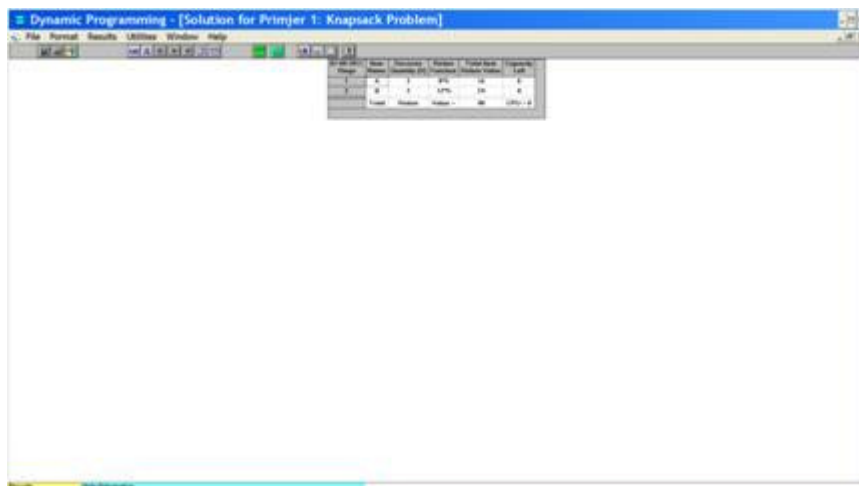
Slika 3. Izlazni podatci u Primjeru 1.

Lijevom tipkom miša kliknimo na izbornik Solve and Analyze , pa odaberimo opciju Solve the Problem . Dobivamo Sliku 3.