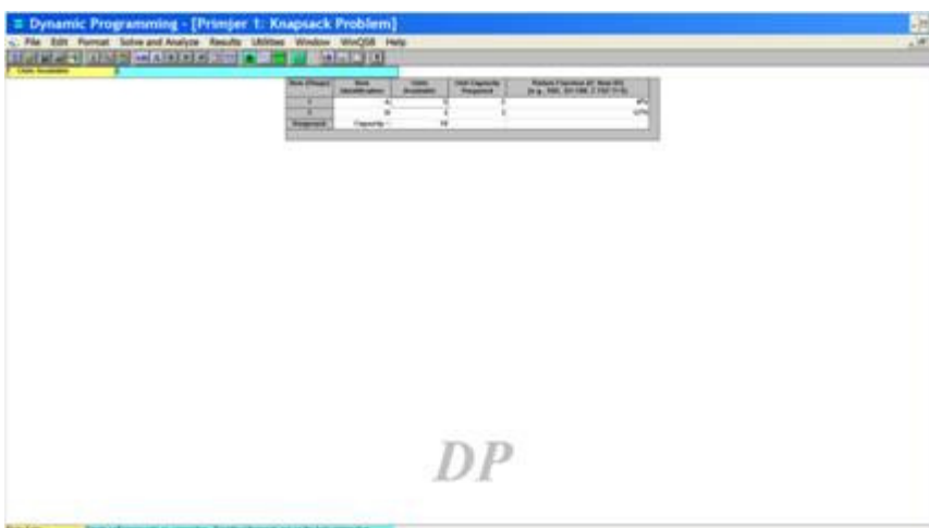
Slika 2. Unos ulaznih podataka u Primjeru 1.

Ovime je unos ulaznih podataka završen. Dobivamo Sliku 2.