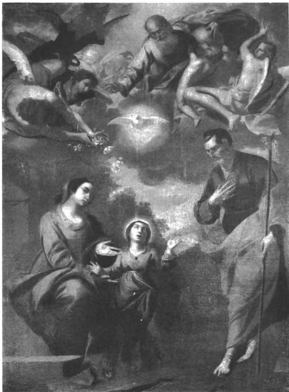
Majstor ABD: Sv. Obitelj u crkvi Gospe od Šunja na Lopudu