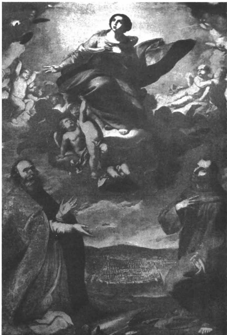
Majstor ABD: Bogorodica između sv. Franje i sv. Vlaha u crkvi Dominikanaca u Dubrovniku