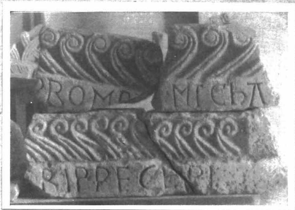
5. Pronađeni natpisi u crkvi na Mijovilovcu

crkva istovetna s crkvom sv. Trojice u Poljudu kod Splita i sv. Marije u Trogiru, koje se tragovi nalaze pod pločnikom. Uza nju, pred vratima, otkrivene su naknadno zidane prostorije poput narteksa, u koje se je ulazilo sa sjeverne strane. Do nje opet vežu se zidovi velikog otkrivenog dvokrilnog samostana, što predstavlja prvi slučaj u zahvatima hrvatske arheologije. Našli su se najviše u samostanu, sučelice crkvenom ulazu, dijelovi sa pleternom skulpturom. Nađeno je i dijelova natpisa, među kojima i fragment sa tekstom MICHA (elis), što ve-