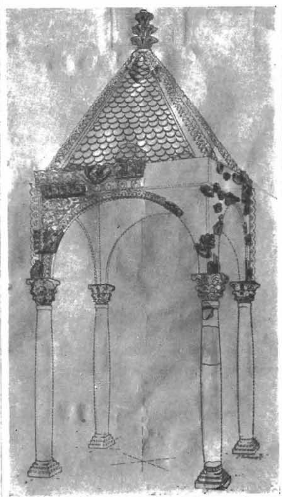
1. Rekonstrukcija ciborija iz Biskupije (po izvedbi dr. Gunjače nacrtao P. Salopek)

ali su se i postigli rezultati u ispitivanju odnosa pojedinih arhitektonskih fragmenata, koji su dotada bili u muzeju posvuda i odjelito postavljeni, a da se nije znalo za međusobne pripadnosti. Povezano je preko 300 pronađenih fraktura, iskrslili su neki čisto novi oblici. Spomena je vrijedna konstatacija o povezanosti napisa na temelju koje je oborena tvrđnja o spominjanju kneza Zdeslava na ostacima natpisa u kninskom muzeju (v. Vjesnik za arheologiju i historiju dalmatinsku LI. str. 197—202). Istim radom uzmogao se je idejno rekonstruirati krasni ciborij sa Crkvine u Biskupiji, od kojeg je dotada bila prepoznata samo kitnja. Terenski rad bio je uglavnom ograničen na traženje samih