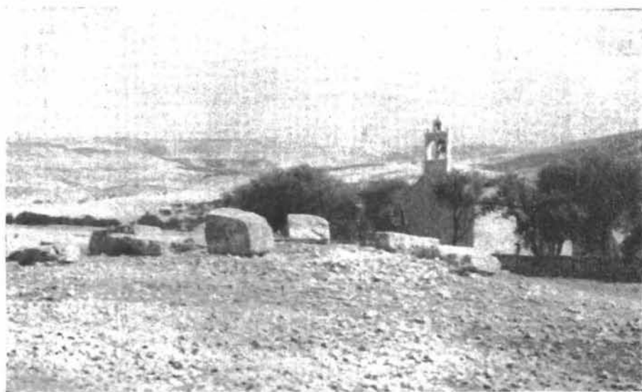
4. Stećci pred crkvicom sv. Jere u Gljevu kod Sinja