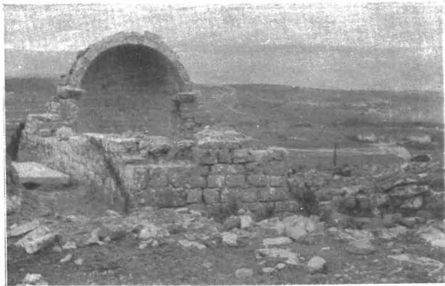
3. Ostaci crkve na Krinju kod Sinja

apsida, koje je čeonu luk kasnije popravljen. Narod je sada zove sv. Jure. Oko nje ima stećaka.