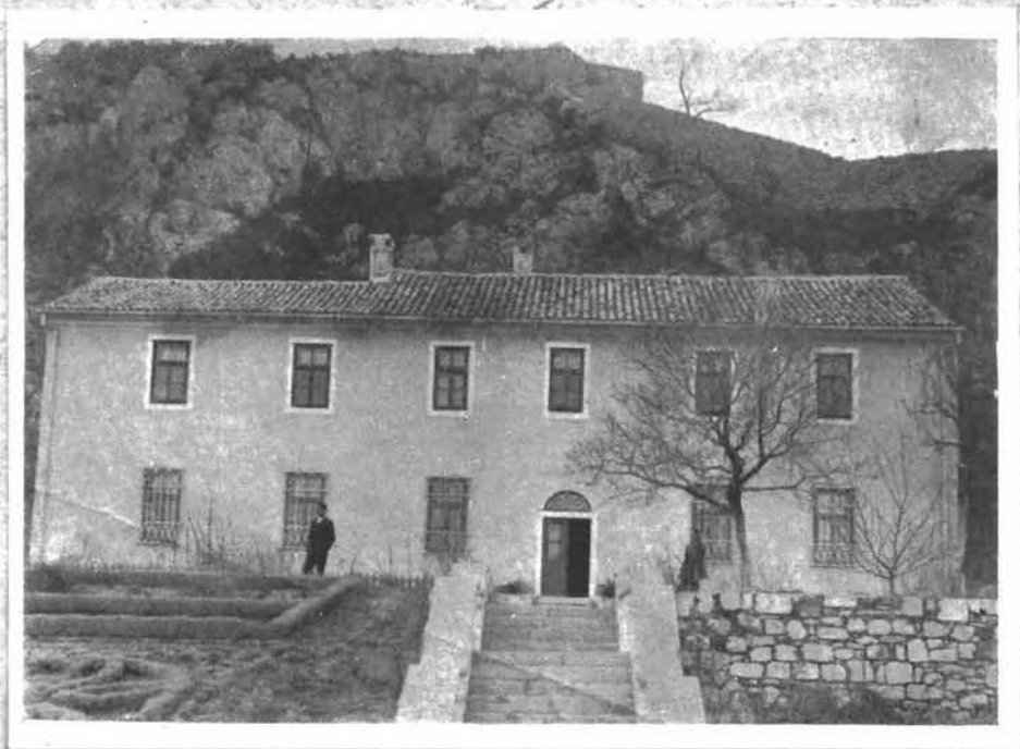
7. Zgrada starohrvatskog muzeja u Kninu bombardirana 1943.

Kad je kustos muzeja otišao na oslobođeni teritorij, prostorije u njegovu stanu u Sinju, gdje je bio pohranjen muzej zapečatila je ustaška kotarska oblast u srpnju g. 1943. i naložila sinjskoj općini, da sve vrednije stvari položi