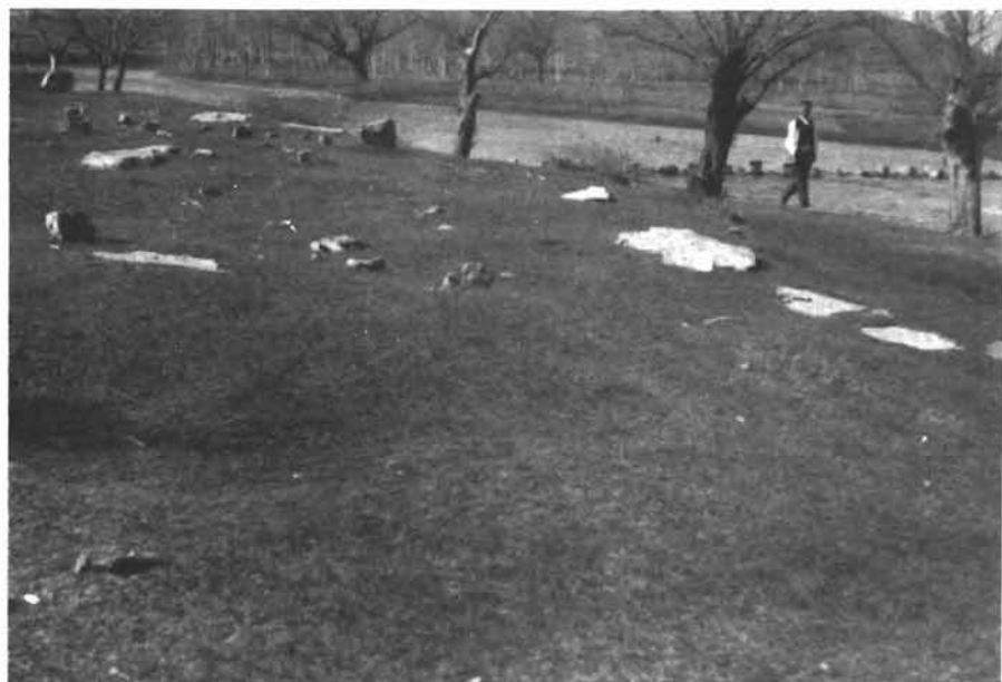
2. Stećci uz Cetinu kod Koljana