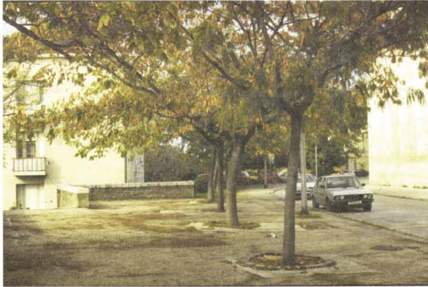
Slika 3. Ulica Zadarskog mira 1358 Albizzia julibrissin