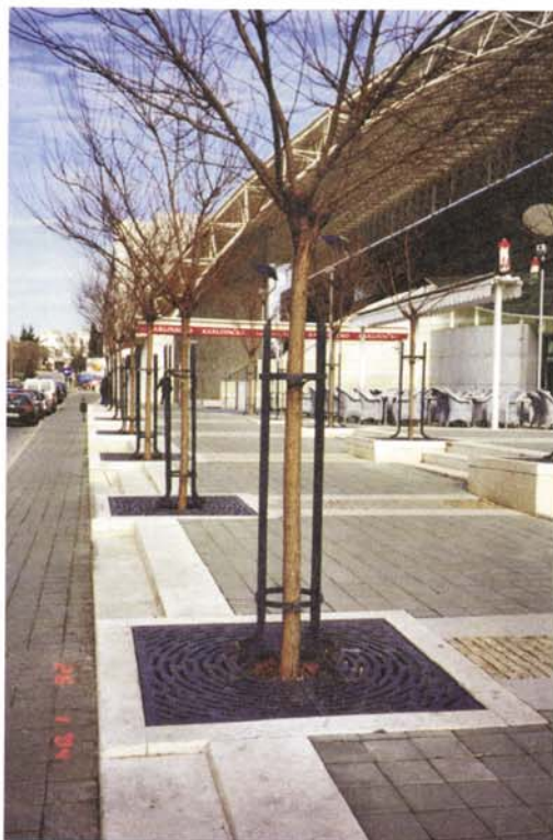
Slika 5. Trgovinski centar Robinia pseudoacacia "Umbraculifera"

Od svih drvoreda posađenih zadnjih desetak godina samo tri imaju zaštitne rešetke koje štite i deblo i korijen. Cijevi za prozračivanje i prihranu nema nijedan. Kad se projektiraju ulice ili trgovi u većini slučajeva se ne pita mišljenje hortikulturnog stručnjaka, pa su uvjeti u kojima će živjeti stabla prilikom izvedbe već zadani. To se odnosi i na financije. O daljnjoj njezi se u proračunu nažalost vodi još manje računa, pa se sve svodi na umješnost onih koji preuzimaju brigu o njima koliko će njege uspjeti pružiti stablima dok ne ojačaju.