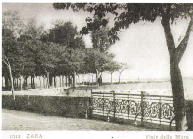
Slika 1. Stari Muraji Quercus ilex

Sljedeći drvored crnike u staroj gradskoj jezgri je onaj na Novoj rivi odnosno današnjoj Obali kralja Petra Krešimira IV. Riva je sagrađena 1875. godine, a zgrade duž obale do 1906. godine. U tom razdoblju je posađen i dvostruki drvored stabala duž cijele obale. Po nekim razglednicama s kraja 19. stoljeća može se