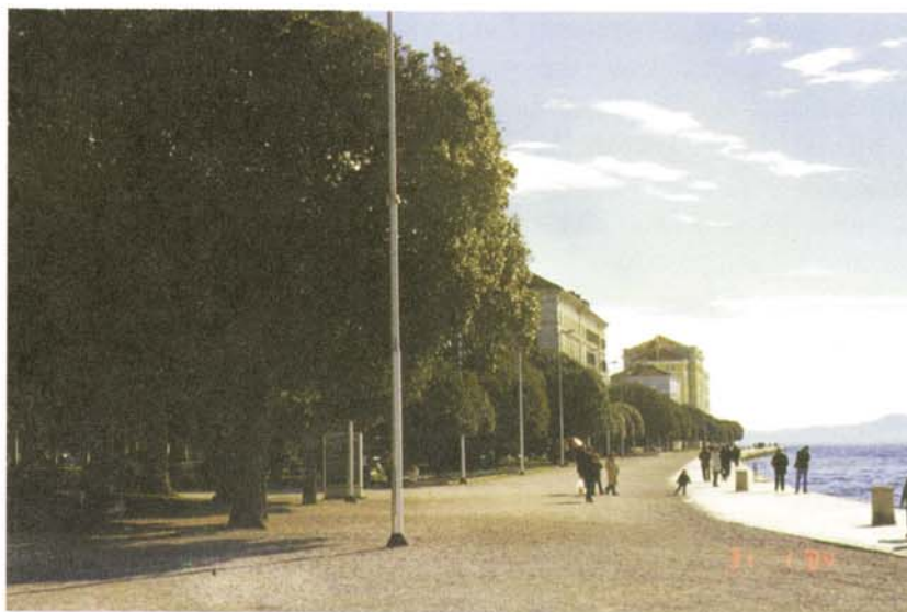
Slika 2. Nova riva Quercus ilex

zaključiti da su to bila listopadna stabla, sudeći po obliku krošnje vjerojatno brijestovi. Kasnije su ta stabla zamijenjena crnikama, vjerojatno dvadesetih godina prošlog stoljeća u doba talijanske vlasti, a možda i ranije.