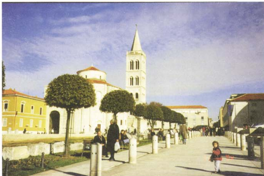
Slika 4. Šetnica na Forumu Quercus ilex