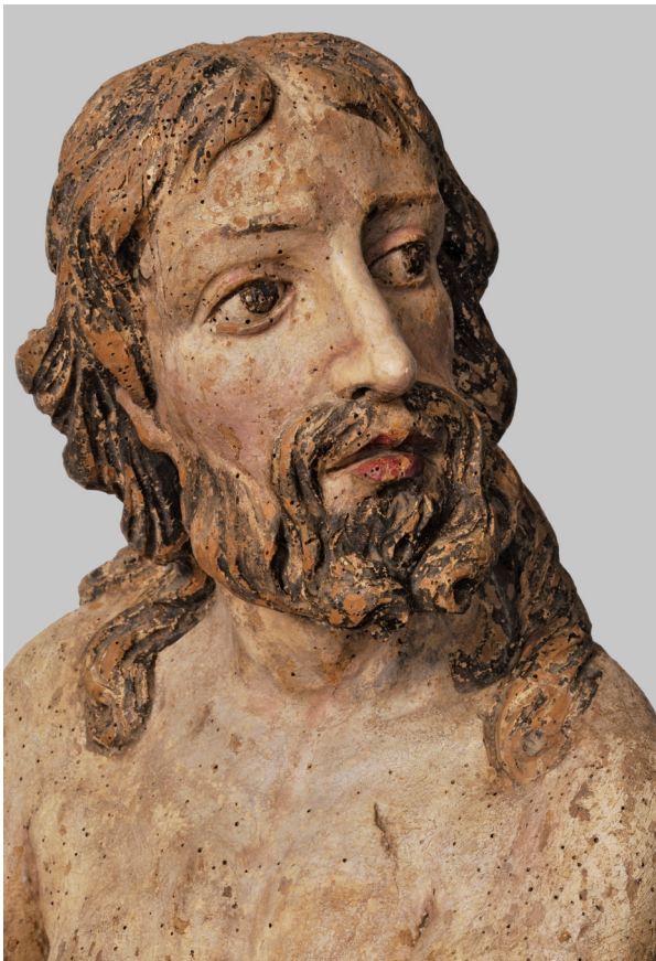
2. Sv. Ivan Krstitelj s oltara sv. Marije Magdalene, detalj St. John the Baptist from the altar of St. Mary Magdalene, detail

U četiri od pet spomenutih ugovora, točnije u dva ugovora za oltar sv. Emerika, kao i u onima za oltare Blažene Djevice Marije i sv. Ladislava, precizira se narudžba točno određenog, i to istog, tipa polikromacije. Za oltare Blažene Djevice Marije i sv. Ladislava traži se „uere puro Auro, Colore Caeruleo in locis dumtaxat opportunis intermixto,