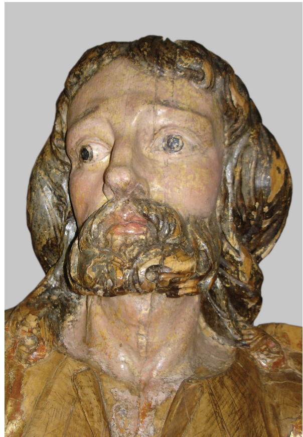
3. Sv. Josip s oltara sv. Ladislava iz zagrebačke katedrale, detalj, kipar Johannes Komersteiner, polikromator Bernard Bobić, 1690. g., Muzej za umjetnost i obrt Statue of St. Joseph from the altar of St. Ladislav in Zagreb Cathedral, detail, by sculptor Johannes Komersteiner and polychromist Bernard Bobić, 1690, Museum of Arts and Crafts