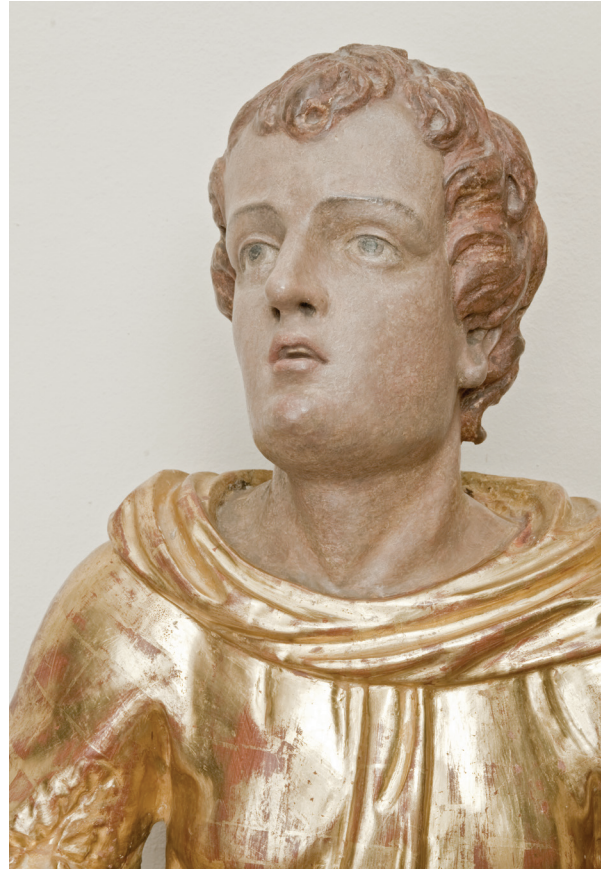
7. Sv. Lovro s oltara sv. Fabijana i Sebastijana, detalj, kipar Johannes Komersteiner, polikromator Johanos Rosman, 1689. g., Vurot, (fototeka HRZ-a, snimio J. Kliska) St. Lawrence from the altar of St. Fabian and Sebastian, detail, by sculptor Johannes Komersteiner and polychromist Johanos Rosman, 1689, Vurot (photographic archive of the HRZ, photo by J. Kliska)

coeruleum, ceruleum, coelin, Caeruleum, Azzurro celeste, Cilestro, Blu di Hopfner, Blu celino, Blu di cobalto e stagno ) je kobalt(II)-stanat koji se primjenjuje od oko 1860. godine. Vrlo je stabilan i otporan na svjetlo, zelenkasto-plave boje i ograničene pokrivenosti. Koristi se u ulju, najviše za slikanje neba, kao što su ga, primjerice, primjenjivali impresionisti, a ne u temperi, koja je vezivo u boji nbrojenih oltara. 13