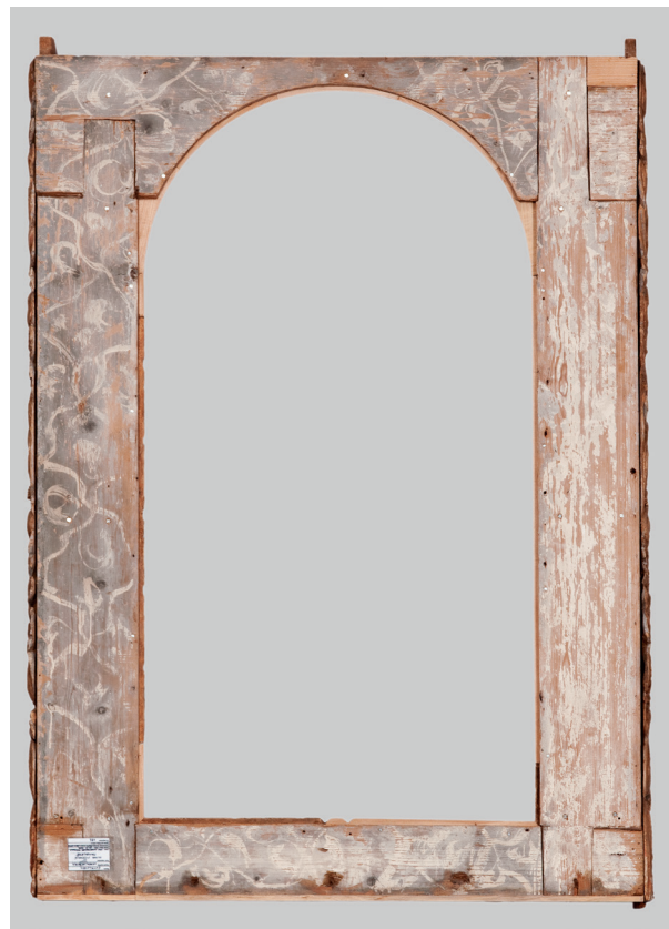
5. Ornamentirana poleđina središnjeg okvira s oltara sv. Marije Magdalene, kipar Johannes Komersteiner, oko 1690. g., Gotalovec, repolikhromacija nepoznatog autora Decorated back of the central frame of the altar of St. Mary Magdalene, by sculptor Johannes Komersteiner, c. 1690, Gotalovec, repolychromed by an unknown painter

Premda je asocijacija na pigment koji danas zovemo ceruleum sugestivna, on u vrijeme narudžbe oltara još nije postojao i može odvesti na krivi trag, čak i svojom nebeskoplavom nijansom, kojom se približava korijenu latinske riječi caeruleus , koja etimološki potječe od caelum (nebo). Pigment koji danas zovemo ceruleum ( blu ceruleo , Coelinblau , bleu céleste , cerulean blue , coerulean , cerulean ,