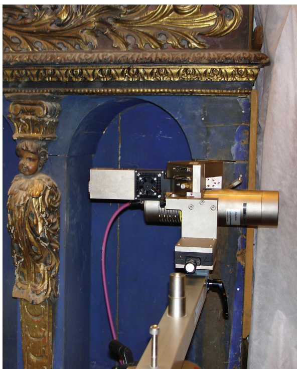
8. Predela s oltara sv. Ladislava i sv. Marije iz zagrebačke katedrale, kipar Johannes Komersteiner, polikromator Bernard Bobić, 1689.–1690., Muzej za umjetnost i obrt, xrf-analiza

Predella of the altar of St. Ladislaus and St. Mary from Zagreb Cathedral, by sculptor Johannes Komersteiner and polychromist Bernard Bobić, 1689–1690, Museum of Arts and Crafts, XRF analysis