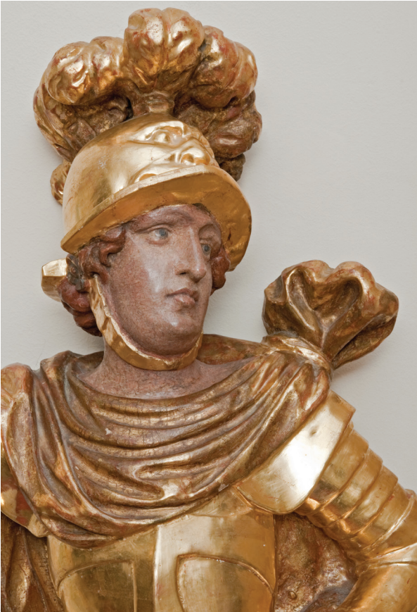
6. Sv. Juraj s oltara sv. Fabijana i Sebastijana, detalj, kipar Johannes Komersteiner, polikromator Johanos Rosman, 1689. g., Vurot, (fototeka HRZ-a, snimio J. Kliska) St. George from the altar of St. Fabian and Sebastian, detail, by sculptor Johannes Komersteiner and polychromist Johanos Rosman, 1689, Vurot (photographic archive of the HRZ, photo by J. Kliska)