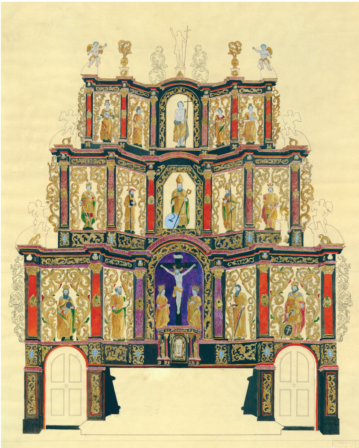
19. Rekonstrukcija izvornog sloja polikromacije i pozlate na oltaru sv. Križa iz 1714. g., (dokumentacija HRZ-a, crtež izradili Đ. i J. Šimičić) Reconstruction of the original polychromy and gilding on the altar of the Holy Cross from 1714 (HRZ documentation, drawing by Đ. Šimičić and J. Šimičić)

zidu jasenovačke crkve kod propovjedaonice. U središnju nišu prvog kata umjesto kompozicije Sv. Križa postavljen je nama nepoznati kip Immaculate , a raspored ostalih skulptura prvog kata ostao je isti. Raspored skulptura trećeg kata nije se mijenjao. Na atici nije postavljen kip Uskrslog Krista. Na krajeve vijenaca prvog i drugog kata