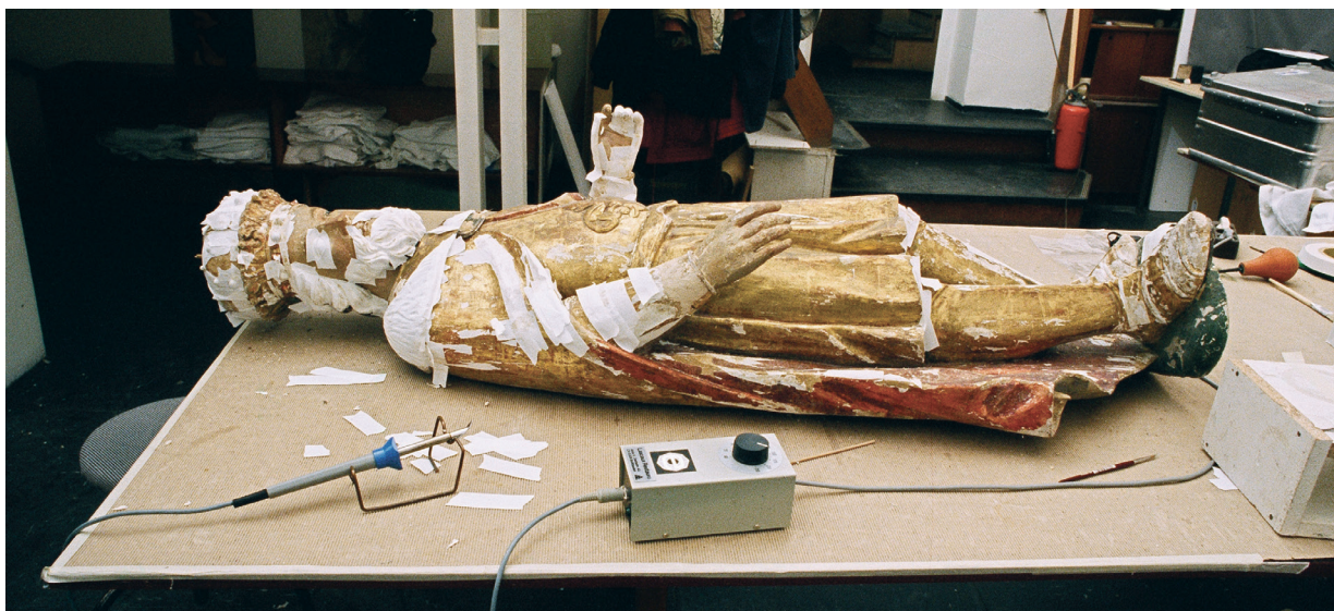
16. Skulptura sv. Ladislava tijekom radova na podljepljivanju odvojenih slojeva kredne osnove i pozlate Sculpture of St. Ladislaus, during the gluing of detached layers of the chalk base and gilding

centar Ludbreg, postojala je opasnost da se oštećenja povećaju, jer je morao uslijediti proces sušenja drvenog nosioca. Taj proces nastojao se što je više moguće ublažiti postupnom prilagodbom na nove uvjete. Dijelovi su dezinficirani i djelomično su uklonjene plijesni i gljivice. Poslije se pristupilo privremenom podljepljivanju kredne osnove. Na dijelovima arhitekture i pozlaćene ornamentike nastavljeno je podljepljivanje i nakon prebacivanja dijelova oltara u depo Ludbreg, a u Ludbregu je prije smještanja umjetnina u depo provedena ponovna dezinfekcija metilbromidom. Tijekom radova na pozlaćenoj ornamentici izvedeno je oko 25% rekonstrukcija rezbarenjem u lipovu drvu i oko 40% rekonstrukcija kredno-tutkalne osnove. Drveni nosilac učvršćen je od 2 do 8%-tnom otopinom Paraloida B-72 u nitrorazrjeđivaču ili u acetonu. Čuvali su se svi zatečeni dijelovi pozlate i inkarnata, i to oni koji su imali površinski sloj. (sl. 16) Retuš je izveden na pozlati zlatnim listićima, a prema procjeni i zlatnim prahom. Pozlata je zatim polirana. U ponovnoj intervenciji inkar-