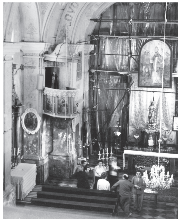
6. Pogled s kora crkve na radnu grupu koja 1971. g. dogovara daljnji tijek radova na oltaru View from the church choir. Working group discussing the course of works on the altar in 1971

Ivo Maroević u dijelu teksta u kojem obrađuje jasenovački oltar, piše da je premještanje oltara u jasenovačku crkvu izazvalo promjenu formata i izvorne ikonografske sheme rasporeda kipova na oltaru, dok je preslikavanje slojeva izvorne pozlate, srebra i lazura, dovelo u raskorak vizualni, a time i estetski i stilski sadržaj te umjetničke cjeline. „Dezinsekcija i učvršćivanje crvotočinom oštećenih dijelova ansambla bili su tek preduvjet za razmišljanje.