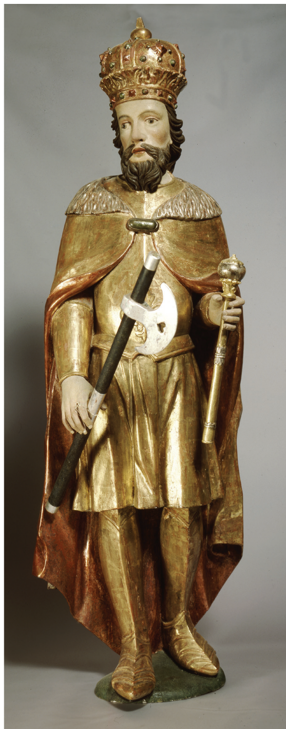
11. Sv. Stjepan i sv. Ladislav nakon dovršenih konzervatorsko-restauratorskih radova za izložbu 1989. g. St. Stephen and St. Ladislaus after the completion of the conservation-restoration works for the exhibition in 1989

dvije vrlo lijepe i vrijedne skulpture sv. Petra i sv. Pavla, zatim veći dio skulpture lijevog anđela s trećeg kata oltara te jedna mala svetačka skulptura iz niše tabernakula. Arhitektura i pozlaćena ornamentika retabla zatečena je u vrlo teškom stanju. Zbog prokišnjanja u prostor crkve moralo se brzo djelovati, tako da je ponovno demontirana arhitektura i ornamentika oltara i prebačena