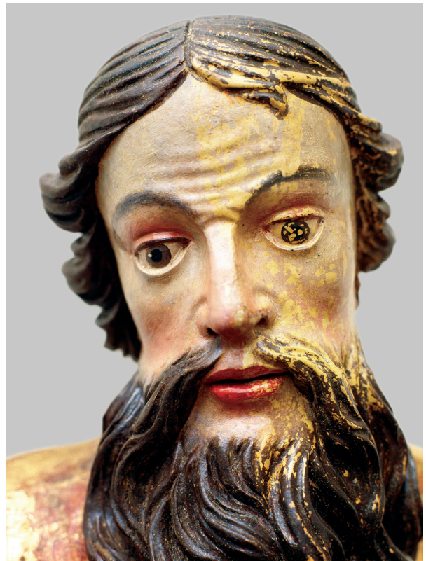
9. Retuš izvornog sloja inkarnata skulpture sv. Pavla, detalj The retouch of the original polychromy of the sculpture of St. Paul, detail

popustilo i dijelovi su rezbarije bili olabavljeni ili potpuno razdvojeni. Elementi rezbarije velikih vitica niša bili su s poledine grubo učvršćeni letvicama zakucanim željeznim čavlima, koji su s vremenom zahrđali. Čavli su bili zakucani kroz cijeli drveni nosilac, kredno-tutkalnu osnovu i pozlatu, čime su bila izazvana teška oštećenja, no ipak su se dijelovi tako sačuvali uz cjelinu. Utvrđeno je jače odvajanje kredno-tutkalne osnove – podbuhlost te oštećenja nastala kasnijim popravcima, kitanjem i većim brojem preslika. Ukrasnoj rezbariji nedostajao je veći dio pozlate, slojevi preslika mjestimično su se nalazili izravno na drvenom nosiocu, bez kredno-tutkalne podloge. 15 Istraživanja na 86 elemenata rezbarenih ukrasa pokazala su da je ornamentika bila pozlačena, a na posrebnim mjestima lazurirana crvenom i zelenom lazurinom. Izrađena je grafička dokumentacija, ucrtana su oštećenja drvenog nosioca. Obilježena su mjesta na kojima se nalazila pozlata i posrebnje s lazurama. U vrijeme izrade grafičke dokumentacije, na poledinu rezbarija upisana je boja lazure.