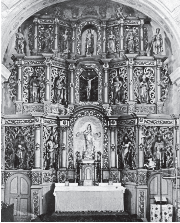
3. Oltar sv. Križa nakon preseljenja u Jasenovac na fotografiji iz 1920. g. The altar of the Holy Cross after removal to Jasenovac on the 1920 photo