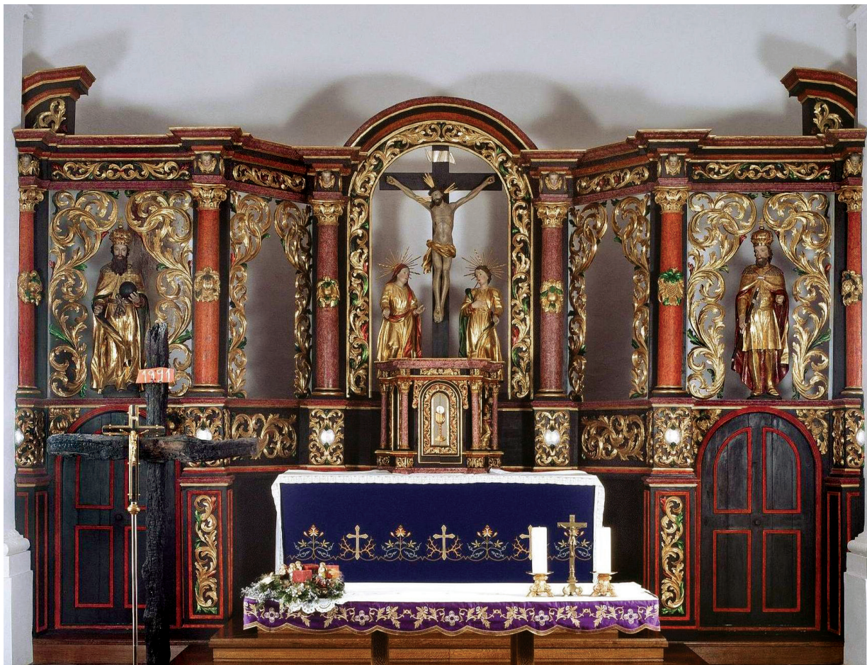
1. Tomo Jurjević i Pavao Bellina (?), glavni oltar župne crkve u Jasenovcu, 1714. g., stanje nakon dovršenih restauratorskih radova na prvom katu retabla 2008. g.

Tomo Jurjević and Pavao Bellina (?), the main altar in the parish church in Jasenovac, 1714, after the completion of the conservation-restoration works on the first tier of the retablo in 2008