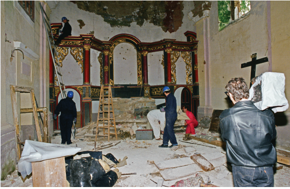
12. Interijer crkve u Jasenovcu nakon ratnih razaranja, pogled prema svetištu tijekom demontaže glavnog oltara

Interior of the church in Jasenovac after destruction by war. View of the sanctuary during the dismantling of the main altar