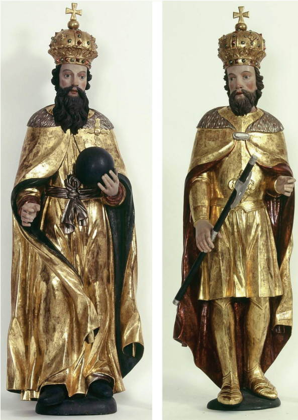
17. Sv. Stjepan i sv. Ladislav nakon dovršenih konzervatorsko-restauratorskih radova 2008. g. St. Stephen and St. Ladislaus after the completion of the conservation-restoration works in 2008

nat je retuširan i rekonstruiran pigmentima Schmincke i vezivom Plextol D 498. Retuš ploha arhitekture, profilacija vijenaca i stupova izveden je istim postupkom. Lazure i ujednačavanje dijelova stare i nove pozlate izvedeno je odmašćenim lazurnim slikarskim uljanim bojama (Schmincke). Za vrijeme radova na rekonstrukciji nestalih dijelova ornamentike i skulptura korištena je dokumentacija izrađena tijekom radova izvođenih sedamdesetih i osamdesetih godina. (sl. 17 i 18)