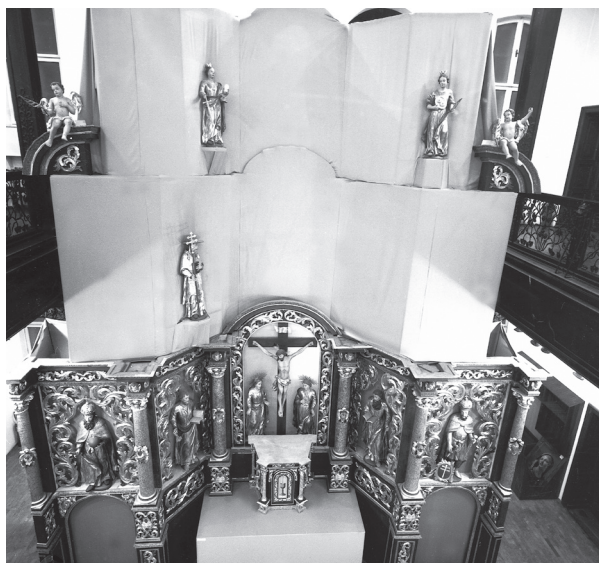
10. Oltar na izložbi Kultura pavlina u Hrvatskoj održanoj u Muzeju za umjetnost i obrt u Zagrebu 1989. g. Altar at the exhibition Pauline Culture in Croatia , held in the Zagreb Museum of Arts and Crafts in 1989

Od 1973. pa do 1991. godine neprekidno se radi na 23 skulpture retabla. Tijekom radova izvorni sloj se maksimalno čuvao. 19 Godine 1988. radovi se proširuju na skulpture sv. Barbare i sv. Agate te na dva anđela s trećeg kata, potom i na kip sv. Jeronima drugog kata. 20 Sljedećih godina radovi se proširuju na ostale skulpture, tako da do 1991. godine obuhvaćaju sve skulpture retabla. Odignuti slojevi skulptura podljepljeni su 3–6%-tnim zečjim tutkalom, preslici su uklonjeni s pozlate kemijskim putem (Moltofort, Paintoff, Abeizer) 21 , a s inkarnata mehaničkim i kemijskim putem (mješavinom alkohola i terpentina, dimetil-sulfoksidom). S inkarnata su preslici uklanjani postupno. Uklonjen je drugi i treći sloj preslika. Prvi preslik je fotografski dokumentiran, a zatim uklonjen mehaničkim i kemijskim putem (Moltofort). (sl. 8) Nedostajući dijelovi rekonstruirani su rezbarenjem u lipovu drvu, a na mjestima gdje je nedostajala kredno-tutkalna osnova, ona je rekonstruirana. Izveden je retuš i rekonstrukcija pozlate na mjestima gdje je nedostajala, i to 22-karatnim zlatnim listićima, koji su zatim polirani. Retuš inkarnata