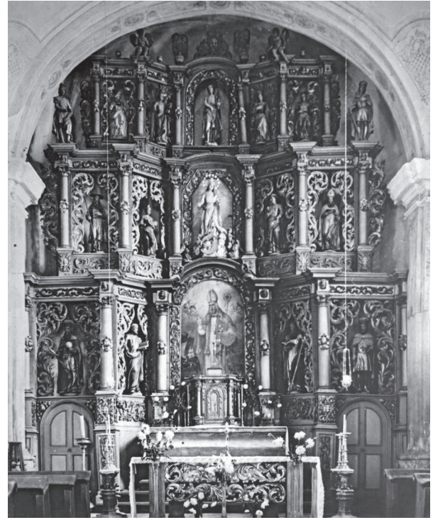
4. Fotografija iz 1968. g. pokazuje izmijenjeni ikonografski postav skulptura na oltaru u Jasenovcu A 1968 photo showing changed iconographic arrangement of sculptures on the altar in Jasenovac

ne, o obojenju oltara (modra i bijela) i postavljanju dviju skulptura klečećih anđela na tabernakul. 6