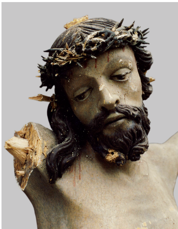
14. Skulptura Krista s prvog kata glavnog oltara, detalj s oštećenjima, 1995. g., (fototeka HRZ-a, snimio Đ. Šimičić) Sculpture of Christ from the first tier of the main altar, detail showing damages, 1995 (photographic archive of the HRZ, photo by Đ. Šimičić)

arhitekture oltara zatekli smo oštećenja manjih razmjera od onih na skulpturama i onih na ukrasnoj ornamentici; bila je prisutna prašina, dijelovi otpale žbuke, razdvajanje na spojevima, isprani dijelovi kredne osnove i polikromacije do drvenog nosioca. Anđeoske glavice, kerubini, sa završnog vijenca bile su većim dijelom sačuvane.