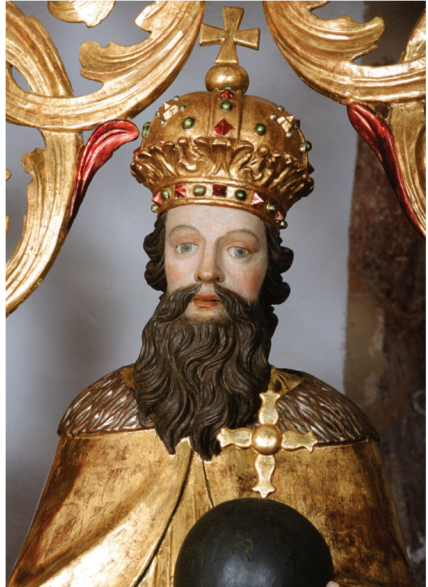
18. Sv. Stjepan, detalj nakon montaže u oltar 2008. g. St. Stephen, detail after repositioning on the main altar in 2008

Godine 2003. završen je elaborat 26 s opisom stanja, predviđenih radova i troškovnikom na pojedinim skulpturama, ornamentici i dijelovima arhitekture svih katoava. Opisan je smještaj i količine ukrasne ornamentike arhitekture oltara koja se još nalazila u Zavodu i u depou Restauratorskog centra Ludbreg. U rujnu 2007. godine Ministarstvo kulture RH osnovalo je Stručno povjerenstvo za obnovu interijera župne crkve Sv. Nikole u Jasenovcu za donošenje prioriteta radova te praćenje realizacije uređenja interijera, obnovu sačuvanog pokretnog inventara i izvedbe novih elemenata potrebnih za uređenje sakralnog prostora. 27 Godine 2008. ponovno su završeni konzervatorsko-restauratorski radovi na visokom postamentu prizemlja i zoni prvog kata. Visoki postament i prvi kat s pripadajućom ornamentikom i pet skulptura prvog kata ponovno se montiraju u svetište crkve u Jasenovcu. Nakon