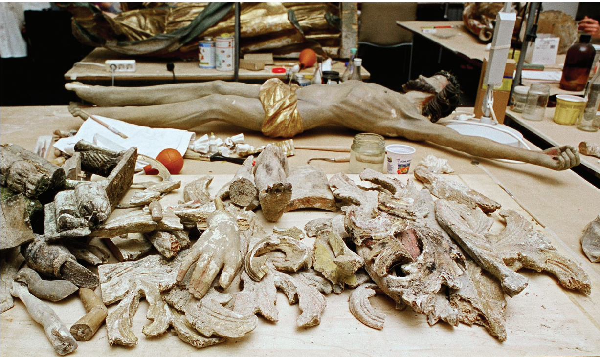
13. Dijelovi glavnog oltara nakon ratnih razaranja 1995. g. (fototeka HRZ-a)

Od triju skulptura središnje niše kompozicije Sv. Križa, na kipu Raspetog Krista (137 × 115 × 26 cm) bila je gotovo u cijelosti sačuvana kredno-tutkalna osnova s polikromacijom i pozlatom. (sl. 14) Nedostajala je cijela ruka. Jaka oštećenja bila su na dvjema skulpturama: sv. Mariji (123 × 47 × 23 cm) i sv. Ivanu evanđelistu (123 × 43 × 26 cm). Nedostajala je gotovo sva kredno-tutkalna osnova s pozlatom i polikromacijom. Drveni nosilac bio je izrazito natopljen vlagom i prekriven bijelom, crvenom i crnom plijesni. Nedostajale su zrake na glavi svih triju skulptura. Na cijeloj površini skulptura sv. kraljeva Ladislava (150 × 52 × 37 cm) i Stjepana (150 × 53 × 36 cm) bile su prisutne plijesni, a kredno-tutkalna osnova mjestimično se mrvila i odvajala od nosioca, no u odnosu na druge skulpture i druge dijelove oltara, te su dvije skulpture bile nešto bolje sačuvane. Nedostajali su im dijelovi svetačkih atributa. Skulptura desnog anđela s trećeg kata (70 × 35 × 25 cm) vrlo je teško oštećena, dijelovi skulpture drugog anđela većim dijelom su nestali. Na tabernakulu oltara zatečena su vrlo velika oštećenja istovjetna onima koje zatječemo na skulpturama. (sl. 15) Na plohamama i profilacijama vijenaca