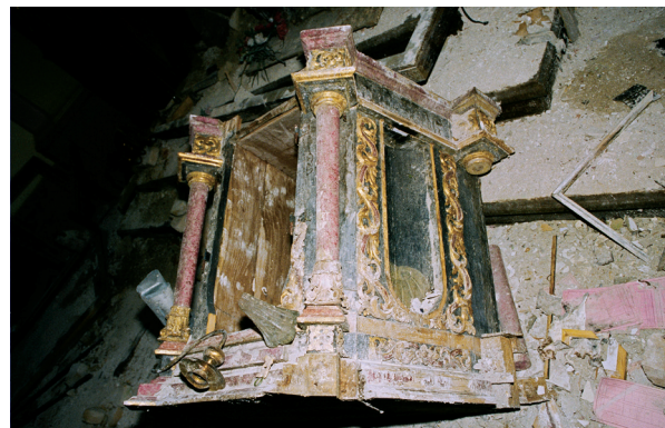
15. Svetohranište glavnog oltara, stanje 1995 g. u jasenovačkoj crkvi Tabernacle of the main altar. Condition in 1995 in the church in Jasenovac

Nakon prijevoza skulptura i ukrasne ornamentike oltara u Zagreb i dijelova arhitekture retabla u Restauratorski