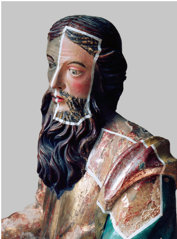
8. Sv. Pavao tijekom istražnih radova na polikromiji skulpture, detalj sa sondom dokumentira prvi preslik inkarnata St. Paul during the research work on the sculpture polychromy. Detail during the cleaning documents the first layer of the overpainting