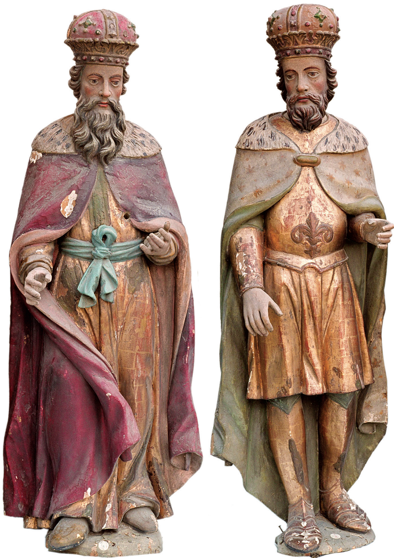
7. Sv. Stjepan i sv. Ladislav prije restauratorskih radova St. Stephen and St. Ladislav before restoration work