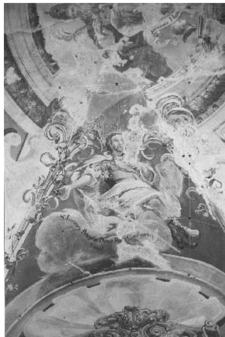
4. Ivan Krstitelj Ranger, S. Ioannes, Konstantinin skrbnik, svod svetišta.