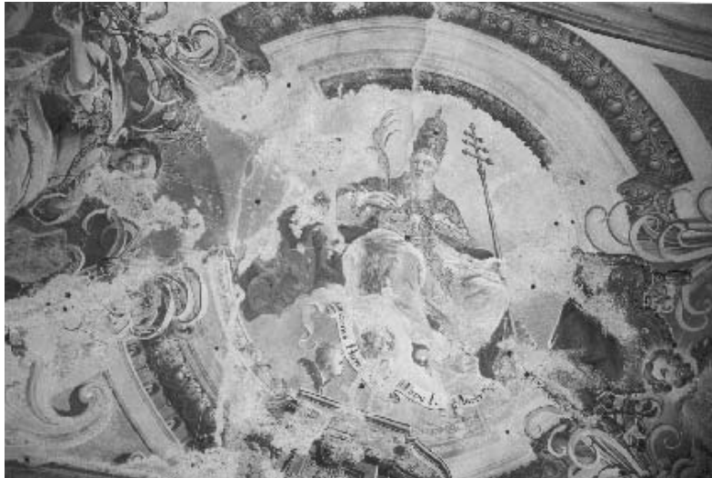
2. Ivan Krstitelj Ranger, S. Ioannes Papa, svod svetišta.