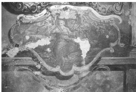
7. Ivan Krstitelj Ranger, S. Ioannes Eremita, južni zid svetišta.