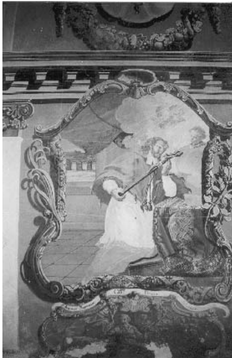
5. Ivan Krstitelj Ranger, S. Ioannes Nepomuceno, sjeverni zid svetišta.