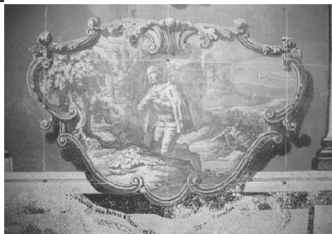
6. Ivan Krstitelj Ranger, S. Ioannes Chozibita, sjeverni zid svetišta.