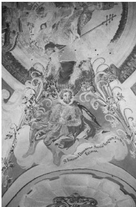
3. Ivan Krstitelj Ranger, S. Ioannes Damascus, svod svetišta.