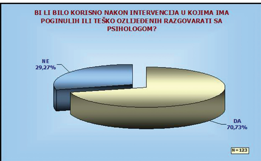
Slika 3. Stav vatrogasaca prema psihološkoj pomoći (Šimić, 2008)

Istraživanje koje je provedeno 2007. godine u kojem su sudjelovali profesionalni vatrogasci iz nekoliko većih hrvatskih gradova, pokazalo je da 70% profesionalnih vatrogasaca (slika 3.) smatra da bi nakon teških intervencija (intervencije s teško ozlijeđenim ili smrtno stradalim osobama) bilo korisno razgovarati s psihologom. (Šimić, 2008.).