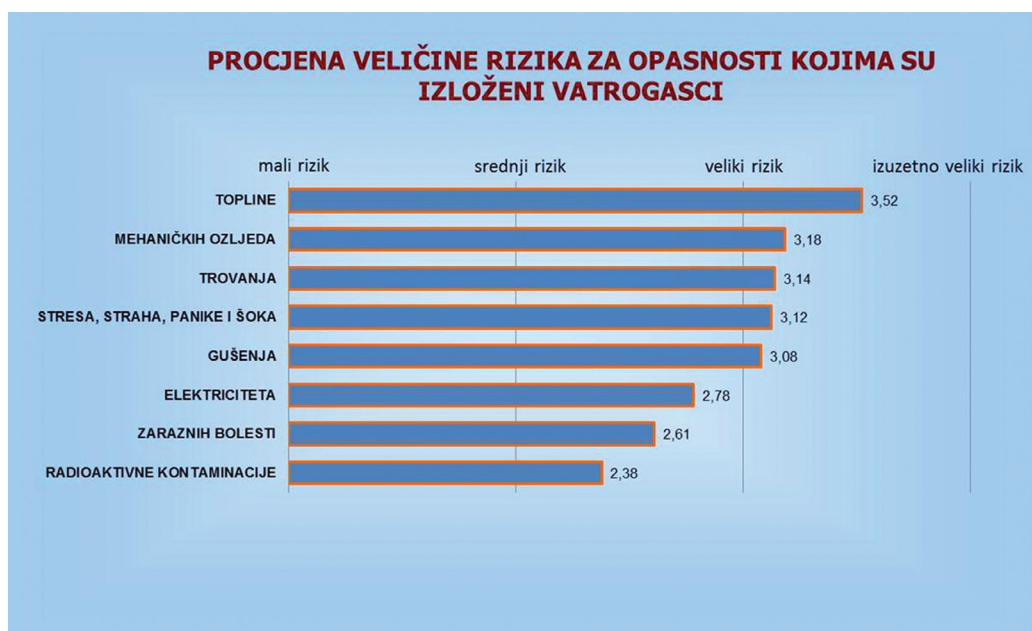
Slika 1. Srednja vrijednost procjena veličine rizika za opasnosti kojima su izloženi vatrogasci

koliko dana u pravilu je neškodljiv za čovjeka (Tyrer 1991). Važno je razlikovati štetan stres od svakodnevnih poteškoća koje su sastavni dio čovjekova života, rasta i razvoja, ali isto tako i od uobičajenih promjena raspoloženja. Ne postoji nitko tko nije bio izložen djelovanju stresora i tko nije doživio stres, a osobito ne postoji niti jedan vatrogasac koji je pošteđen stresa. Da stres predstavlja veliki rizik opasnosti kojima su vatrogasci izloženi, pokazuje istraživanje provedeno u Hrvatskoj na populaciji profesionalnih vatrogasaca (Slika 1.) u kojem su stres, strah, panika i šok procijenjeni jednako opasni kao i opasnost od mehaničkih ozljeda, trovanja i gušenja (Szabo i Šimić, 2007).