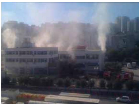
Slika 2. Početak izbijanja požara (slika lijevo glavni ulaz, slika desno raspored vozila sa zapadne strane objekta