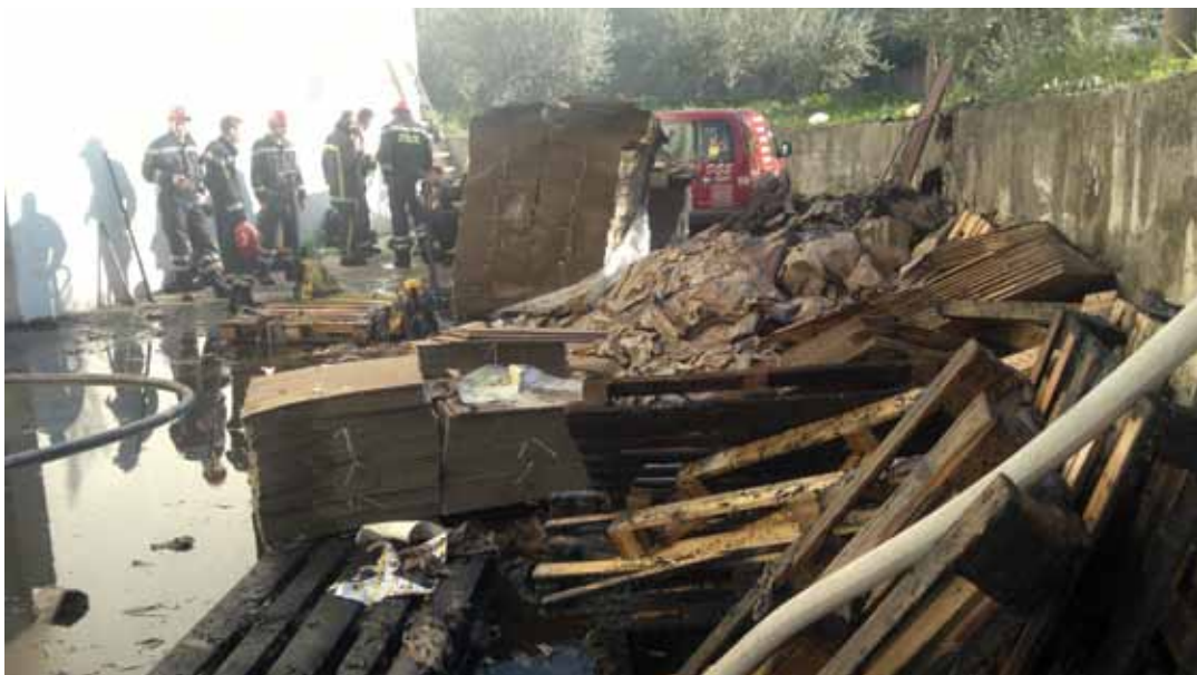
Slika 4. Materijal koji je izvučen iz požara