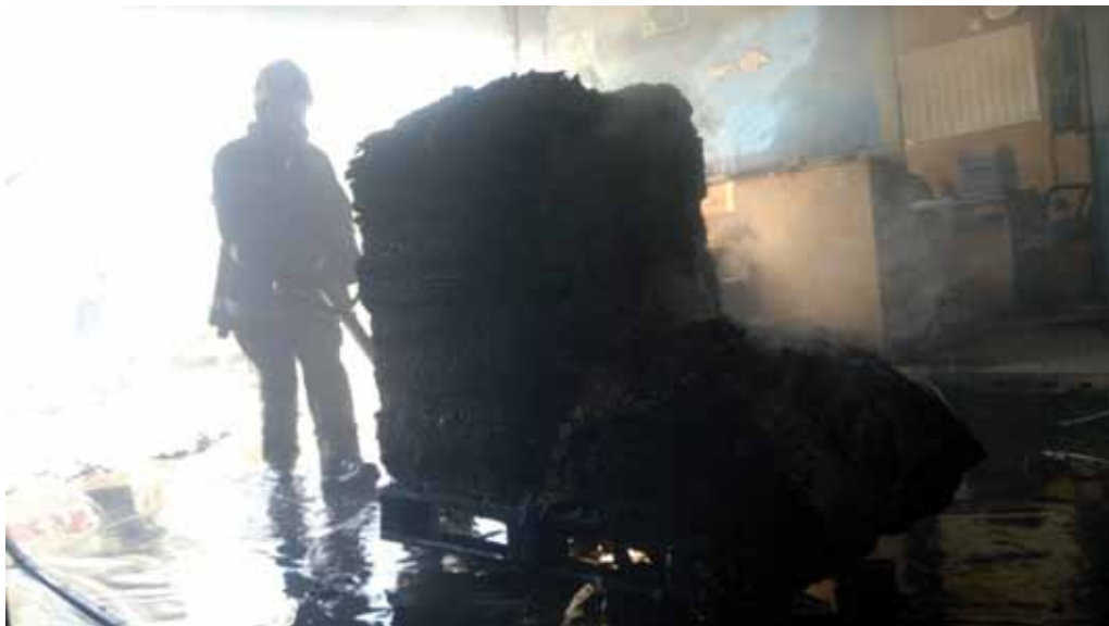
Slika 5. Izvlačenje gorivog materijala