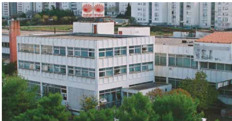
Slika 1. Zgrada DES-a

Na sadašnjoj lokaciji u Splitu, na adresi Boktuljin put b.b., poduzeće djeluje od 1978. godine i to u poslovnoj zgradi od cca 7.500 m 2 neto građevinske površine (cca 9.000 m 2 bruto građevinske površine). Od tada poduzeće ostvaruje značajne rezultate, tako da na 35 godišnjicu poslovanja ima zaposleno 420 radnika. Od konca 2003 godine osnivači Ustanove postaju Grad Split sa 65% i Splitsko-dalmatinska županija sa 35% osnivačkog udjela, te je Ustanova pod sadašnjim nazivom registrirana u siječnju 2004. godine.