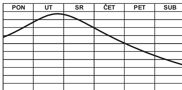
Slika 3: Tjedni bioritam polaznika i spremnost za nastavne aktivnosti (prilagođeno prema Bujas, 1968. i Poljak, 1970.)

zamoliti neke od njih da se dobrovoljno jave. Na taj način, nekoliko puta tijekom devedesetominutnog druženja nastavnik mijenja uloge polaznika od slušača u aktivnog subjekta koji treba čitati, razgovarati, rješavati probleme, odgovarati na pitanja, razmišljati, zamišljati itd.