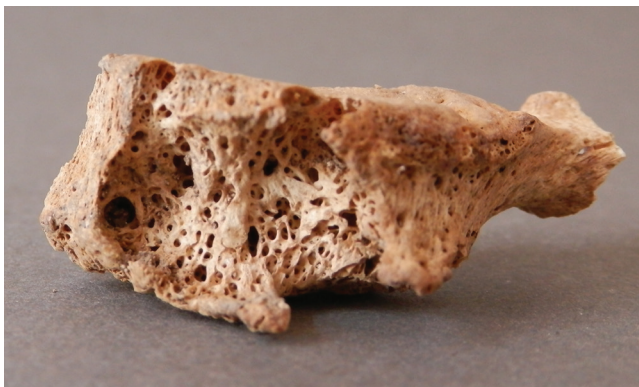
Sl. 2 Litičke lezije na prednjoj strani tijela slabinskog kralješka Fig. 2 Lytic lesions on the anterior side of lumbar vertebral body.

Značajke i rasprostranjenost litičkih lezija na kralješcima (slika 2) i križnoj kosti (slika 3), poroznost i novi sloj kosti na zdjelici te pojačana poroznost na dugim kostima upućuju na prisutnost tuberkuloze kod ove osobe. Tuberkuloza se kod djece vrlo često javlja u milijarnom obliku, a najčešće zahvaća kralješke, kuk i koljeno te gležanj. Tipične promjene su destruktivne lezije i stvaranje vrlo malog sloja nove kosti. Od dugih kostiju najčešće su zahvaćene bedrena i goljenična, a bolest zahvaća dijafize, i to na mjestima gdje su smješteni hranidbeni kanali ili preko zaraženih metafiza (Lewis, 2007). Bolest može zahvatiti i zglobove prstiju pa dolazi do nastanka cističnih lezija, oticanja zglobova