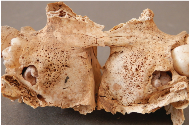
Sl. 4 Poroznost iza alveola za trajne kutnjake na obje strane gornje čeljusti Fig. 4 Porosity posterior to first permanent molar alveoli on both maxillae.

te uništavanja kosti, bez stvaranja novog sloja kosti (Waldron, 2009). Tuberkuloza kod djece ponekad može zahvatiti i kosti glave, najčešće svod lubanje, odnosno čeonu i tjemenu kost. Pritom je karakteristična samo jedna okrugla lezija, koja može probiti svod lubanje. Širenjem bakterije može doći i do razvoja meningitisa (Lewis, 2011).