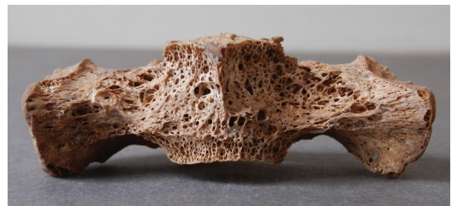
Sl. 3 Litičke lezije na prvom kralješku križne kosti Fig. 3 Lytic lesions on the first sacral vertebra.

The characteristics and distribution of lytic lesions on vertebrae (Fig. 2) and sacrum (Fig. 3), porosity and new bone formation on pelvis, and extensive porosity on long bones are suggestive of tuberculosis. In children, tuberculosis is often present in its miliary form, most commonly affecting vertebrae, hip, knee and ankle. Typical changes are destructive lesions accompanied by very little new bone formation. The most commonly affected long bones are femur and tibia, more precisely their diaphyses that may become infected through the nutrient canals, or through the infected metaphysis (Lewis, 2007). The infection may spread to finger joints causing cyst-like lesions, joint swelling and cortical destruction but no new bone formation (Waldron, 2009). Tuberculosis in children may also affect the cranial bones, most commonly the cranial vault, i.e. the frontal and parietal bones. The most characteristic lesion is a