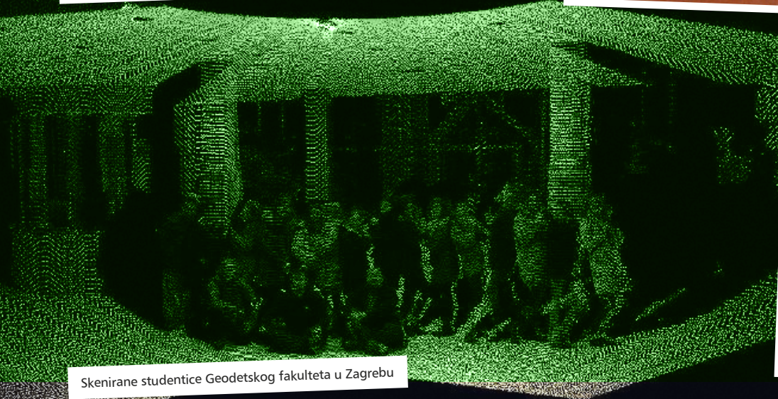
Skenirane studentice Geodetskog fakulteta u Zagrebu