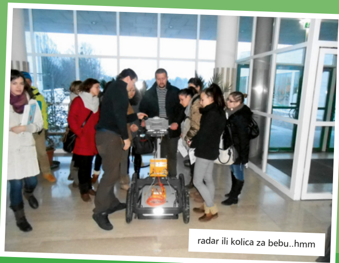
radar ili kolica za bebu..hmm