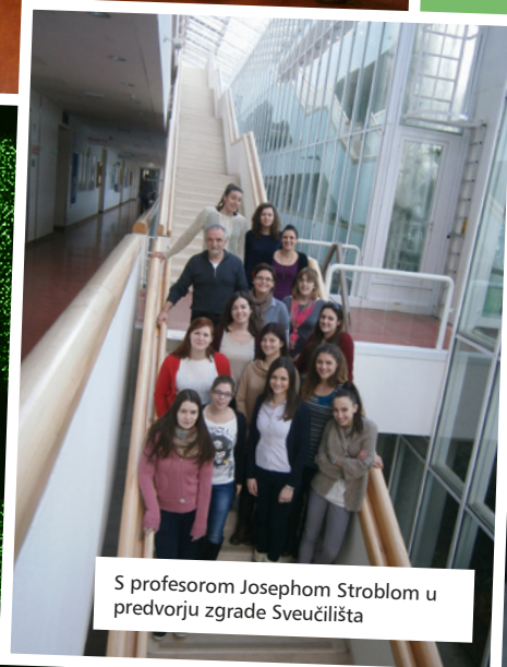
S profesorom Josephom Stroblom u predvorju zgrade Sveučilišta