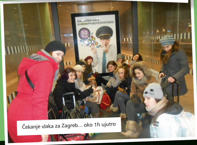
Čekanje vlaka za Zagreb... oko 1h ujutro